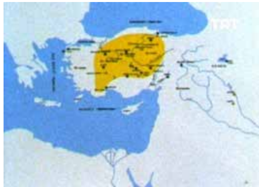
Görsel 2. Frig Krallığı