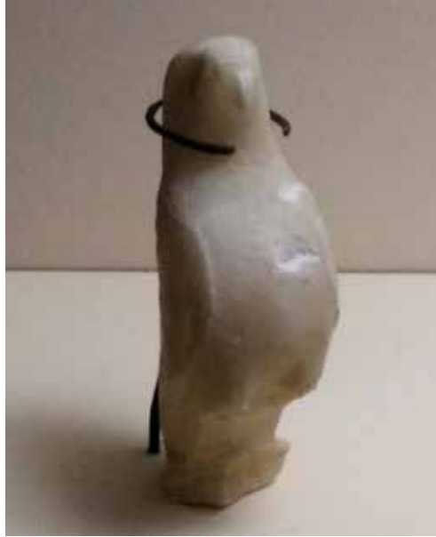
Görsel 9. Şahin Heykelciği: Su mermeri

1995. Uygarlıklar Ülkesi Anadolu 6. Bölüm: 00:19:37:02 – 00:20:01:18) (Görsel 9). Seramik sanatında da çok önemli eserlere imza atmış bir topluluk olan Frigler gündelik yaşam döngüsü içerisinde pek çok seramik - keramik üretimi yapmıştır. Frig keramiğinde (Orta Anadolu Demir Çağı Keramiği) Tabal, Muşki, ve Phrygia gibi farklı etnik unsurlar ihtiva ederken Friglere ait olarak atfedilen keramiklerin en belirgin özelliği madeni kaplara benzer biçimler olarak dikkat çekmiştir (Uçankuş, 2002, s.41 – 52). “Frig seramiklerine dekorlama teknikleri açısından baktığımızda geometrik bezemeler, hayvanların betimlendiği koyu mat boyalı seramikler ve mühür baskı süslemeli seramikler olarak üç grup karşımıza çıkmaktadır. Genel olarak Frig seramiklerini sınıflandırdığımızda, şekillendirme yöntemleri, biçimsel özellikleri ve dekorlama tekniklerini ayrı ayrı özellikler olarak belirleyebiliriz” (Pekyaman, 2008, s.23).