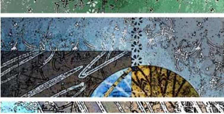
Görsel 14. Fırat Çağrı Kırmızıgül, Bir Gökyüzü Denemesi, Dijital Tasarım, Karışık teknik, 25x10 cm. 2024

Görsel 14'de yer alan Bir Gökyüzü Denemesi adlı çalışma Gordion müzesinde bulunan ve Orta /Geç Frig buluntularından olan çizgi bezekli fildişi bir disk üzerinde bulunan şekillerden ilham alınarak düşünülmüştür. Bu şekillerin karmaşık yapısı bizleri adeta gökyüzünde özellikle geceleri daha çok belirginleşen takımyıldızlarını çağrıştırırken aynı zamanda bu formların karmaşık yapısı insan zihninin karmaşıklığıyla özdeş bir görüntü de oluşturmaktadır. Bu durum Köktürk'ün de bahsettiği (2014) sembol, algı ve bilinç arasındaki iç içe geçmiş olan realiteler bütünü gibi varolanı temsil eden sembolün aynı zamanda özne ile bilişsel ve zihni bir yolculuğa girerek bilinçten ayrılamayan bir de bütünselliği oluşturmaktadır. (Köktürk, 2014, s.55).