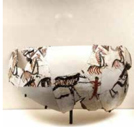
Görsel 7, 8. Orta/Geç Frig Çömlekçiliği (M.Ö. 7. – 4. YY)

Frigler kronolojik bağlamda baktığımızda uzun bir zaman dilimi içerisinde mimarlıktan anıtlara, heykel sanatından keramiklere, maden işçiliğinden marangozluğa, çok geniş bir yelpazede ürünler ortaya çıkarmışlardır. Bu bakımdan Frigler özellikle mimarlıkta ahşap ve taş malzemelerden evler yaparken aynı zamanda mezarlar, kutsal yapılar, megaronlar, inşa etmiş, heykel alanında ise taş yontular, kaya anıtları ve mezarları, yüksek ve alçak kabartmalar üretmişlerdir. Heykel alanında estetik açıdan önemli sayılabilecek eserler ortaya çıkaran Friglerin Midas şehrinde bulunan kadın heykelleri, Palanga heykeli, Kybele heykeli yanında çeşitli tanrıça ve kabartma heykelleri Friglerin bu sanat dalında önemli bir konumda olduğunun göstergesidir (Uçankuş, 2002, s.41 – 52). “Friglerin değişik malzemelerden değişik boyutlarda yaptıkları kabartma ve heykellerde belirtmeye değer özellikler gösterir...Kemikten, fildişinden veya diğer metallerden yapılmış bu değişik figürlerde Frig sanatının bütününe değerlendirmek Anadolu'nun uzun gelişimindeki ağırlıklarını belirtmek mümkündür” (TRT,