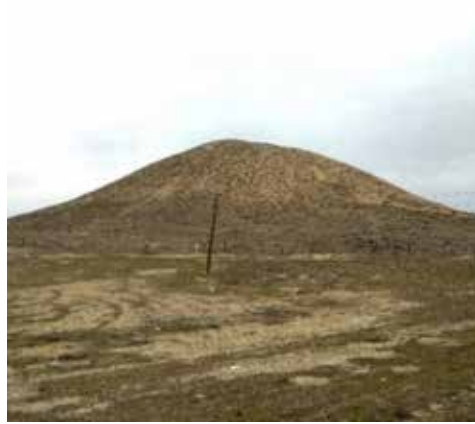
Görsel 3. Gordion'da bulunan Midas Tümülüs'ü

Frig uygarlığı ve kültüründe önemli olan diğer simgelerin başında ise ölüm sonrası hayat ve inanç sistemleri içinde yer alan Tümülüsler önemli yapıların başında gelmektedir. Tümülüsler genelde toplumda kral veya kraliyet ailesinden kişiler ile çeşitli soyluların ağaçtan çukurlar içine konularak yığma toprakla kapatılması ve etrafının moloz taşlarla örtülmesi sonucu oluşan konik bir biçimi andıran yapılardır. Bu yapılar mimari olarak eşsiz görünümlere sahiptirler (Young'dan akt. Erdoğan, 2007, s.11 – 12). Tümülüslerin bilinen en büyük örneği günümüze kadar da gelebilmiş olan Polatlı Gordion'da bulunan Kral Midas'a ait olan Büyük Tümülüs'tür (Uçankuş'tan akt. Bilge, 2020, s.10) (Görsel 3). “Büyük Tümülüs'te; toprak düzeyinde ardıc ve çam ağacından yapılan mezar odası; kaba kireç taşı bloklarından 80 cm. kalınlığında bir duvar ile çevrilidir. Duvar ile oda arasında kalan boşluk, küçük taşlarla doldurulmuştur” (Anonim a. 2023)