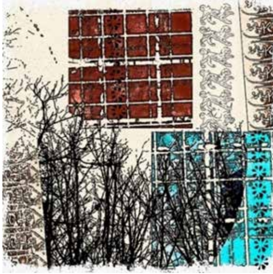
Görsel 12. Fırat Çağrı Kırmızıgül, Frig Serisi II, Dijital Tasarım, Karışık teknik, 20x20 cm. 2024

Görsel 13'de yer alan Frig Serisi III adlı çalışma Frig yazıtlarının tipografik ve kaligrafik olarak etkileyiciliği üzerine bir düşünceden yola çıkılarak yapılmıştır. Bu çalışmada Gordion bölgesinde bulunan çanak, çömlek parçaları, amfora vb. arkeolojik eserlerin üzerinde yer alan şekil, işaret, yazı, harf gibi bulgulardan hareketle bu ifadelerin geçmiş ile günümüz arasında önemli bir köprü görevi olarak kültür etimolojisinde yazının önemini betimlemek amacıyla yapılmıştır.