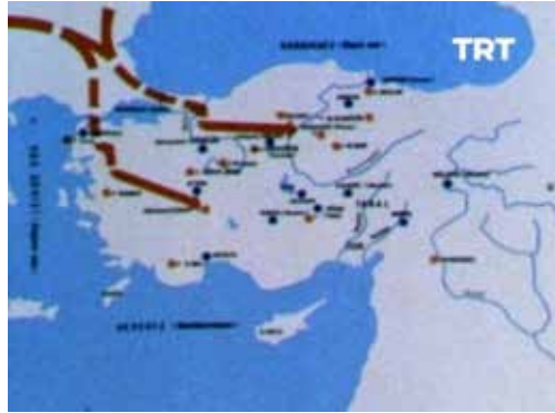
Görsel 1. Friglerin Balkanlardan Anadolu'ya göç yolları süreci

Friglerin bilinen ilk kralı Gordios beyliğin yönetimini merkez olarak Asurluların baskısından dolayı Yozgat yakınlarında bulunan Alishar'dan günümüzde Ankara'nın Polatlı ilçesinde bulunan Gordion şehrine nakletmiştir. Friglerin Gordios'tan sonraki kralı ise oğlu Midas olmuştur. Frigler en güçlü dönemini kral Midas zamanında yaşamıştır (Akurgal'dan akt. Kavak, 2019, s.24). Büyük kısmı köylü ve çiftçilerden oluşan Friglerin aynı zamanda Gordion ve Midas gibi büyük şehirlerde yaşayan gelişmiş toplumsal katmanları da bulunmaktaydı (Pekyaman'dan akt. Kızıl, 2020, s.8).