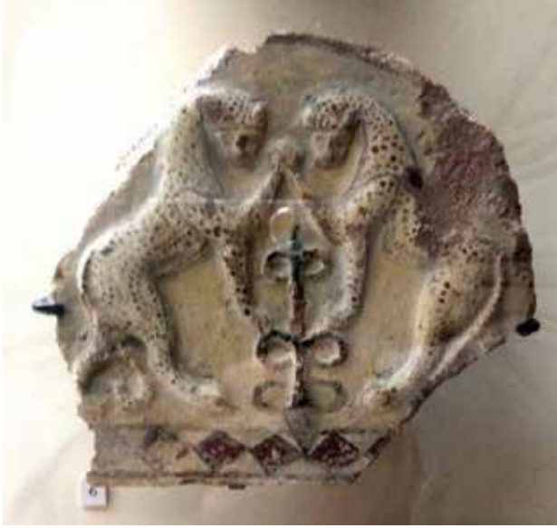
Görsel 10. Panter Figürlü bir Antefix