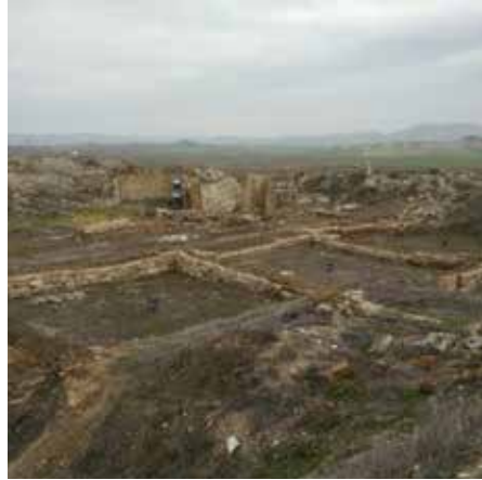
Görsel 6. Gordion Antik Kenti

Gordion Antik kenti Ankara'nın Polatlı ilçesini geçtikten sonra karşımıza çıkan Gordion bölgesinin üst kısmında bulunmaktadır. Yakın Doğunun en önemli bulgularının olduğu ve Tunç Çağından itibaren 4000 yıllık bir yerleşim yeri olarak kullanılan alanda anıtsal binalar barındıran bölgede 100'den fazla tepe bulunmaktadır. Gordion Antik Kentine giriş yaptığınızda 10 farklı bölümden oluşan noktalarda bizi Erken Frig Kapısı ve Stadeli, Erken ve Orta Frig Stadeli, Frig Sur Duvarları ve Helenistik dönemdeki Gordion'un aşağı şehri bizi karşılamaktadır (Anonim b.2023) (Görsel 6).