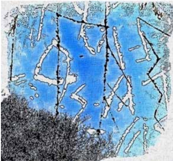
Görsel 13. Fırat Çağrı Kırmızıgül, Frig Serisi III, 20x20 cm. Dijital Tasarım, Karışık teknik, 2024

Görsel 13'de yer alan Frig Serisi III adlı çalışma Frig yazıtlarının tipografik ve kaligrafik olarak etkileyiciliği üzerine bir düşünceden yola çıkılarak yapılmıştır. Bu çalışmada Gordion bölgesinde bulunan çanak, çömlek parçaları, amfora vb. arkeolojik eserlerin üzerinde yer alan şekil, işaret, yazı, harf gibi bulgulardan hareketle bu ifadelerin geçmiş ile günümüz arasında önemli bir köprü görevi olarak kültür etimolojisinde yazının önemini betimlemek amacıyla yapılmıştır.