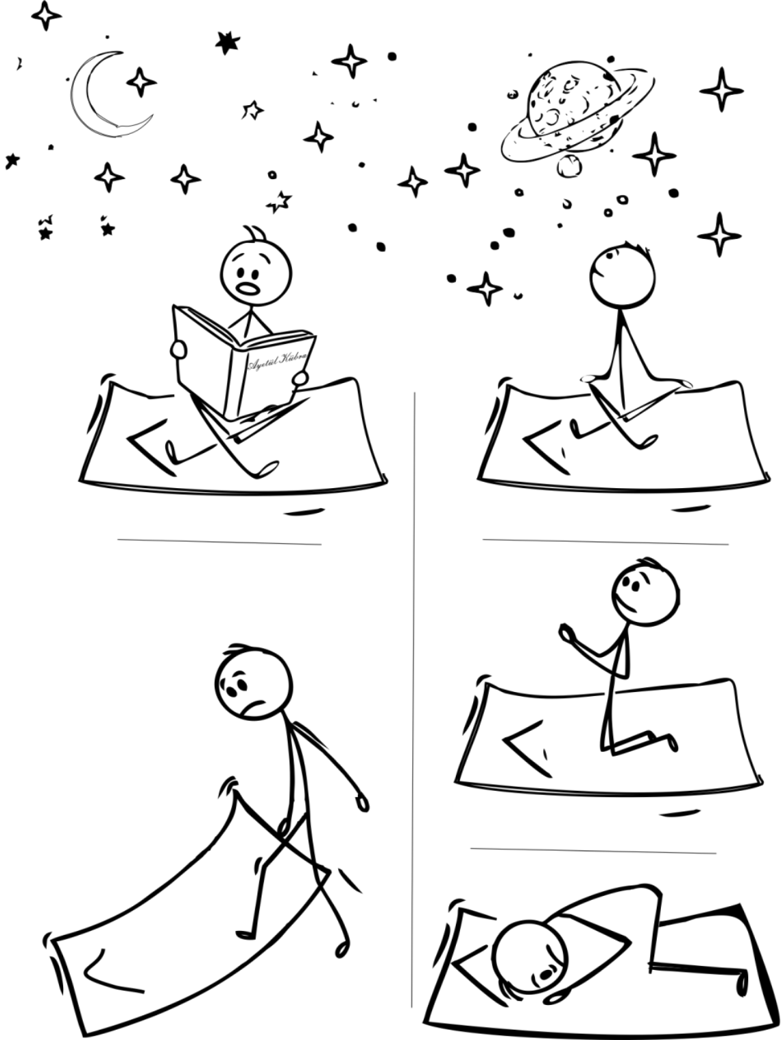
Görsel 2. Allah'ın Kudretinin ve Hikmetinin Doğadaki Yansımasının Merdiven'deki Görsel Sunumu

Yukarıda Merdiven adlı eserden yapılan alıntıya ilişkin ilgili safalarda Görsel 2 'deki gibi tasvir edilmiştir