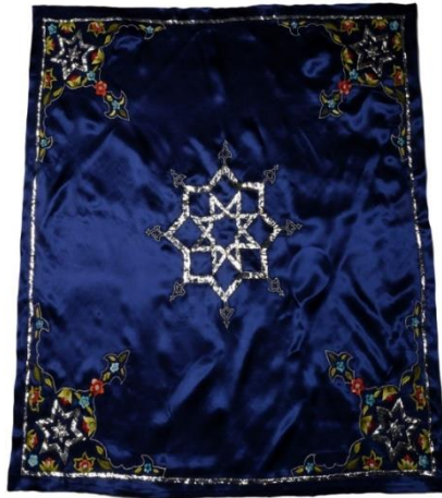
Görsel 29: Mardin Savur Hacı Abdullah Bey Konağı Duvar Tezyinat Süslemeli Bohça