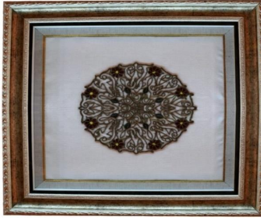
Görsel 6: Latifiye Cami Şadırvanı Üzerinde Yer Alan Süsleme ile Tasarlanan Tablo