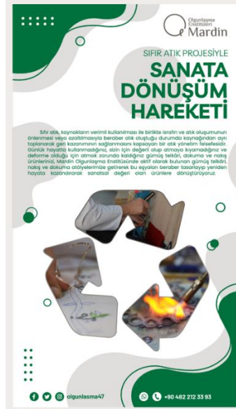
Görsel 8: Sıfır Atık Projesiyle Sanata Dönüşüm Proje Afışı

Emine Erdoğan öncülüğünde hayat bulan sıfır atık projesi kapsamında; günlük hayatta kullanılmayan ve deforme olduğu için atmak zorunda kalınan gümüş telkâri, dokuma ve nakış ürünleri, enstitümüzde aktif olarak bulunan gümüş telkâri, nakış ve dokuma atölyelerimize getirilerek bu eşyalar yeniden tasarlanıp sanatsal değeri olan ürünlere dönüştürüldü.