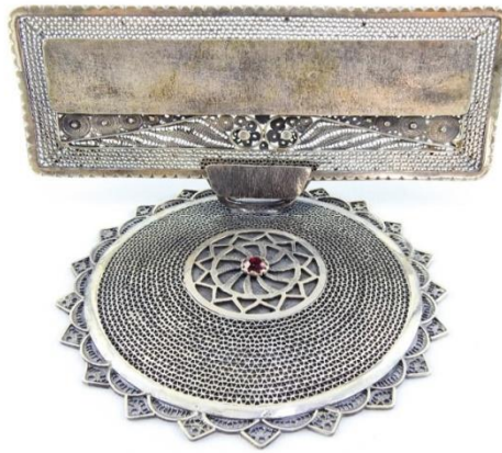
Görsel 1: Mezopotamya Çiçekli Taç ve Yüzük

Çalışma alanı içerisinde bulunan Mardin, Siirt, Şırnak illerinde yapılan incelemeler sonucunda Mezopotamya çiçekleri ve geleneksel kapılarda bulunan tokmaklar ürünlere yansıtılmıştır.