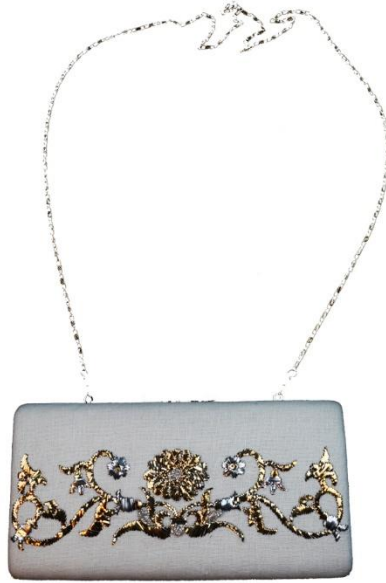
Görsel 28: Mardin Müzesinde Yer Alan Taş Süsleme Detaylı Nakış Çanta