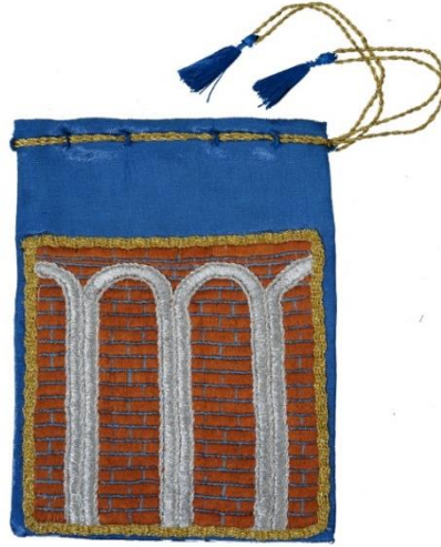
Görsel 23: Dara Antik Kenti Su Sarnıç Kesitli