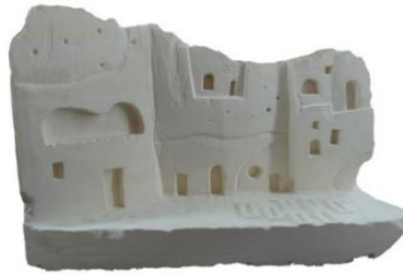
Görsel 22: Dara Antik Kenti Silüeti