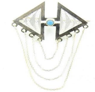
Görsel 11: Deve İzi Motifli Broş