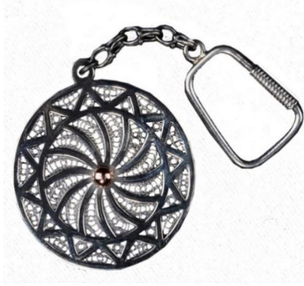
Görsel 25: Çarkıfelek Motifli Anahtarlık

Özgün motifler kuyumculuk teknolojisi- telkâri, el sanatları teknolojisi-nakış/el dokuma, inşaat teknolojisi-taş işleme, seramik ve cam teknolojisi-çinicilik moda tasarım teknolojisi-terzilik, mobilya ve iç mekân tasarımı-mobilya süsleme sanatları atölyelerinden çıkan ürünlere yansıtılmaktadır.