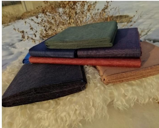
Görsel 9: Şal- Şepik Kumaşı.

Çalışma alanımız içerisine giren Siirt ve Şırnak ilinin kültür sosyolojisi açısından önemli yere sahip olan dokuma sanatını yine bu iki ilde üretilen şal-şepik kumaşı, Siirt battaniyesi, Siirt halısı ve Jirkan kilimi ile ön plana çıkarmak, tanıtımına katkı sağlamak üzere yürütülen projedir.