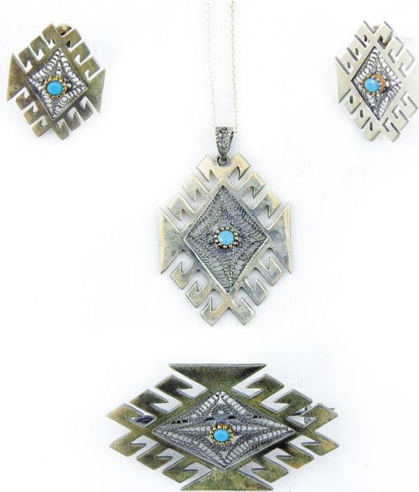
Görsel 15: Akrep Motifli Takı Seti