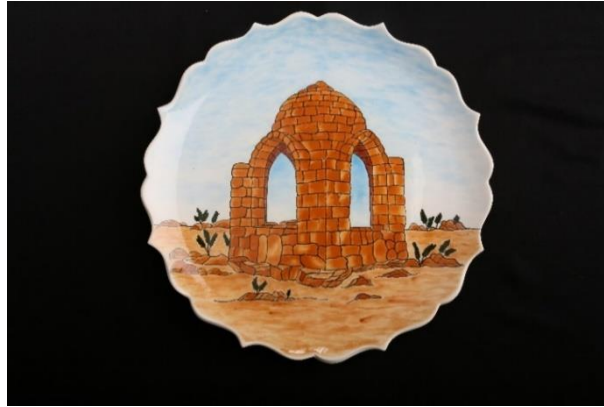
Görsel 21: Dara Antik Kenti Baldaken Türbeli Çini Tabak