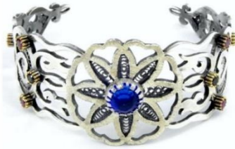
Görsel 27: Yıldız Motifli Bileklik