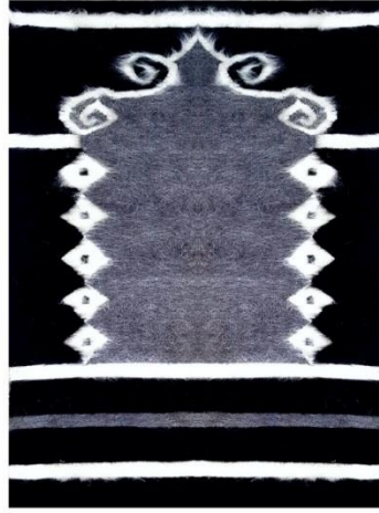
Görsel 14: Tarak ve Bülbül Motifli Seccade (Mardin Olgunlaşma Enstitüsü Arşivi)