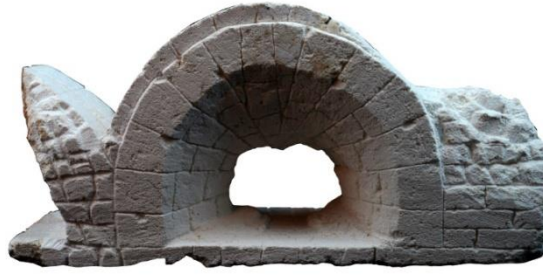
Görsel 20: Dara Antik Kenti Köprü Minyatürü