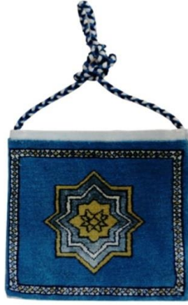
Görsel 5: Latifiye Cami Süslemelerinden Esinlenilerek Tasarlanan Dokuma Heybe