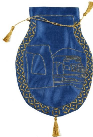
Görsel 24: Dara Antik Kent Siluetli Nakışlı Kесе