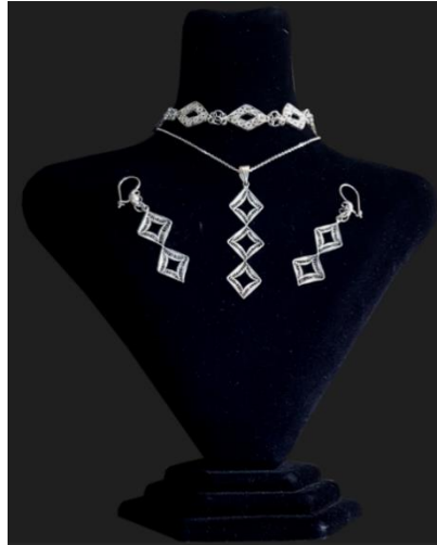
Görsel 4: Göz Motifli Gümüş Takı Seti

Mardin ve Siirt illeri tarihi dokularıyla ve ortak kültürel yapılarıyla öne çıkan illerimizdir. Özgün yapıda çok sayıda dini yapıya sahip olmaları ve bu yapılar üzerindeki motif ve süslemelerin farklı alanlarda kullanılması, bu sayede tarihi yapıların tanıtılması, zengin kültürel değerlerimizin yerel, ulusal ve uluslararası platformlarda bilinirliğini artırılması amacıyla tema olarak seçilmiştir. Bu kapsamda mevcut atölyelerde ürünler üretilip tanıtım pazarlama süreçleri yürütülmüştür.