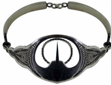
Görsel 18: Dara Antik Kenti Labarov Süslemeli Bilezik

Mardin ilinde yer alan Dara Antik Kenti tarihi dokusu ve kültürel yapısıyla öne çıkan ve askeri amaçlı kurulan garnizon şehridir. Özgün yapıya sahip olan ve kentin içinde yer alan kilise, saray, çarşı, zindan, tophane ve su bendi kalıntıları ve bu yapılar üzerindeki motif ve süslemelerin farklı alanlarda kullanılması, bu sayede tarihi yapıların tanıtılması, zengin kültürel değerlerimizin yerel, ulusal ve uluslararası platformlarda bilinirliğini artırılması amacıyla çalışılan projedir.