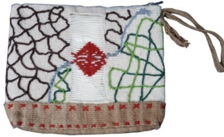
Görsel 26: Elibelinde Motifli Çanta