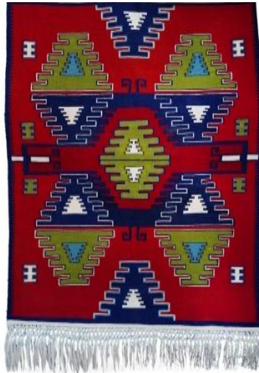
Görsel 12: Göz ve Elibelinde Motifli Runner