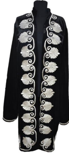
Görsel 3: Mezar Taşı Süslemeli Erkek Kaftan