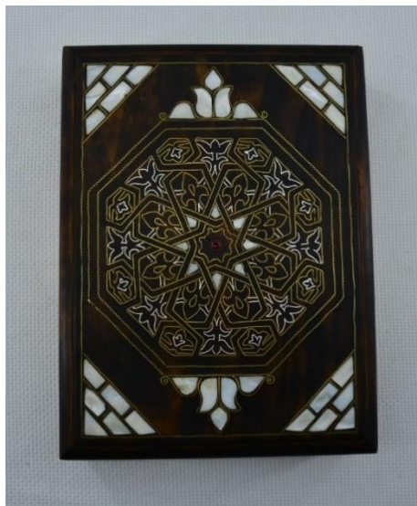
Görsel 7: Mardin Zinciriye Medresesi Dış Cephesinde Eyer Alan Rozet Süsleme Detayı ile Tasarlanan Sedef Plaket