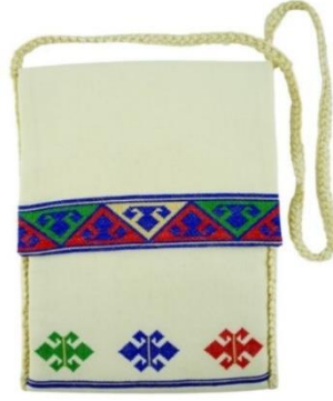
Görsel 10: Elibelinde Kilim Motifli Heybe