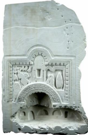
Görsel 19: Dara Antik Kenti Galeri Mezar Minyatür