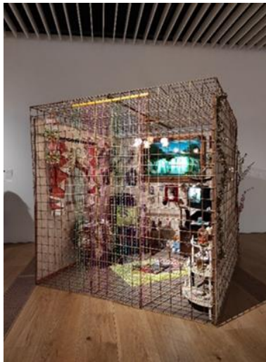
Görsel 9. Kezban Arca Batıbeki, Kafes Projeleri 2- Kitsch Oda Projesi, Nereye Kadar? , 2005, Yerleştirme, Elgiz Koleksiyonu, OMM.

Parlak renklerin ışıltılı, son derece göze battığı, abartının ve döneme ait lüksün revaçta olduğu bu oda, sergilendiği mekânda kapağı açık kalmış ya da içinde ne olduğu bilinen bir hediye kutusu gibi durmaktadır. İçerisindeki bin bir çeşit biblolar süslü bir hayale hizmet eder. Hacdan getirilmiş cami biçimli saate kurulmuş alarmın her an çalacak gibi olmasının telaşlı hissi, açık kalmış televizyonda röportaj verdiği görülen şarkıcı İbrahim Tatlıses'in dolu dolu aşk hayatı ve yıllanmış, utangaç posterlerle kaplanmış dolaplardan, sehpa üzerinde bekleyen fincanda bitmiş kahvenin soğumuş telvesi ile oluşturulan eserde, kabul edilebilir ki, pek çok dikkat çekici nesne bulunur. Eserde yer alan her bir nesne, ayrı ayrı bireyin odağına yerleşebilecek seviyededir.