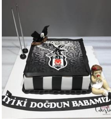
Görsel 1. Beşiktaş amblemlili pasta.

Bu sorunun cevabına yaklaşmak için Görsel 1 incelenebilir. Günlük yaşamdan alıntılanmış örnekte genel beğenin arzularına göre şekillenen kitsch özelliklerin bulunduğu anlaşılabilir; görselde bireyin futbola olan ilgisine daha sıcak bir ortam hazırlamak için taraftar duygularının yoğun şekilde verilmek istendiği, süslenmiş bir doğum günü pastası görülmektedir. Bir futbol maçı esnasında sahadaki oyuncunun forması üzerinde karşılaşılabilecek normal görülen bir amblemin, gıda üzerine işlenmesi alışılmadık bir uygulamadır. Ancak günümüzde bu tarz yöntemleştirilmiş talep arttırıcı uygulamalara sıklıkla rastlanabilir. Bu durumun altında yatan neden, buradaki gibi kitsch özelliklerin kullanımının kişilerin kendilerine popülerlik verdiği algısıdır. Böylelikle kitsch özellikler popüler olanı kullanarak dikkat çeker ve satışı hızlandırabilmek için tüketiciyi almaya sevk eder. Çünkü uygulamada hayranlığı arttıran ve bu hisleri besleyerek diri tutan bir amaç söz konusudur.