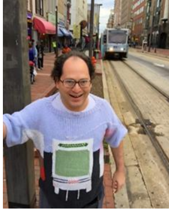
Görsel 4. Sam Barsky'nin eseriyle birlikte dış mekân pozu.

Çalışmalarında kitsch unsurları barındıran bir sanatçı olarak Sam Barsky örnek verilebilir. Dijital platformlar ve sosyal medya ağları gibi kitlelere hitap edebilmesiyle topluma ulaşılabilirlik kolaylığı olan alanlarda aktif kullanıcı profili çizen Barsky, gezgin rolünde çeşitli yöntemleri ele alarak üretim yapan bir sanatçıdır. Gittiği geziler sırasında karşılaştığı tarihi, doğal harikaları olan, güzel iç-dış mekanları ve görsel çekiciliği yüksek konumları üretimlerine tema edinir. Yöntem olarak örgüyü kullanır ve aslında eserleri giyilebilen üst giysilerdir. Bu anlamda çalışmaları yüzeyin farklılığını ve malzemenin alışıldık olmayan düzeydeki hizmete dayalı aykırı dilini de sunmaktadır. Gerçek mekanların rengi ile benzeştirmeye çalıştığı iplerin renkleri, salaş dokumaları, dokunan alanların gerçeğinin aksine daha yüzeysel ve kalıp formlar halinde görünmesi, referans alınan fotoğraf içindeki nesnelerin, kişilerin, yazıların vb. soyutlaştırılarak resimleştirilmesi Barsky'nin çalışmalarında öne çıkan görsel detaylardır.