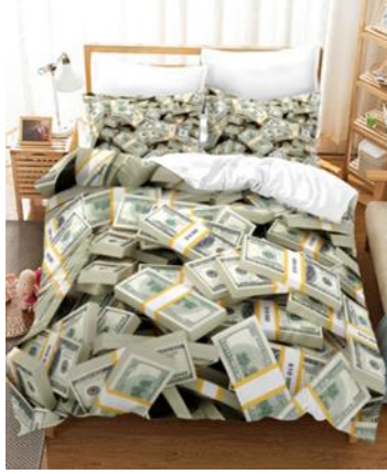
Görsel 2. Para görseli basılı nevresim takımı.

için kolaylaştırıcı olabilir. Çünkü kişiler hayalini kurdukları şeylere kitsch üretimler ile sahip olabilmektedir. Taklit yöntemleriyle beraber yapılan eserlerle donatılmış örtüler, süslü püslü saray özentisi mobilyalar, dolarlarla baskılı çarşaflar, fakirliğin yanındaki zenginlik özlemi, belki de kurulan birçok hayal kitsch temeli üzerinde yükselebilir (Şahin, 2020:9; Karagüzel, 2016:11).