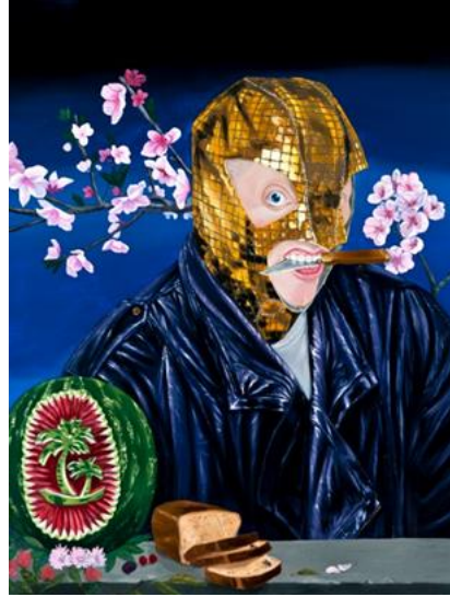
Görsel 12. Ali Elmacı, Beni Tanıdıkça Seveceksin, 2013, 130 x 100 cm, tuval üzerine yağlıboya.

Sanatın temel anlamı insanın akli ve duygularıyla ortaya koyduğu dışavurumsal anlatım yöntemlerinin tümünü kaplarken, sanatçıların bu yönde çıkardıkları üstün yaratıcılıklar ise çeşitliliğe ve sürekli hareket halindeki yeniliğe hizmet etmektedir.