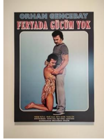
Görsel 11. Hasan Özgür Top, Feryada Gücüm Yok-Biz Birbirimizi Biliriz , 2012, 73 x 100 cm, OMM.

Filmde iki karşı cins arasında yaşanan bir aşk hikayesinin terkedilişini bağımlı bir tavırla yansıtan sanatçı, bireyin duygusal kırılmalarını sergilemektedir. Yine aynı zamanda erotizm duygusunu da bu süreçte bencilce ve gözü kör şekilde yalnızca kendi istekleri çevresinde yaşamak isteyen eser içindeki figür, kendisiyle olan diyalogun ve duygusal bağın tekrarına düşer. Sanatçının eserde arabesk müzik ve gündelik sokak kültürüne uzanan, kendinden öncekine yaptığı dijital müdahaleli işleri, çağdaş sanatta kitsch'in kullanıldığı çalışmalar arasında sayılabilir (Karagüzel, 2022:119).