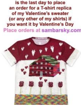
Görsel 5. Sam Barsky'nin instagram sayfasında satışa sunulan bir eseri.

bir internet sitesinde çalışmalarının fotoğraflarının basılı olduğu başka giysileri satışa sunar (Görsel 5). Böylece Barsky'nin çalışma disiplini incelendiğinde, bu eylemlerle bir nevi kendi çalışmalarının taklidini üreterek kitsch bir tavır takındığı kabul edilebilir.