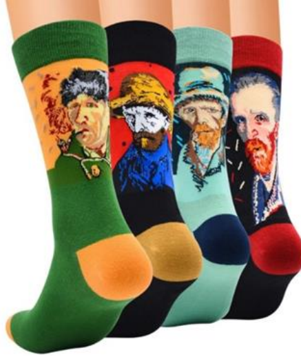
Görsel 3. Vincent Van Gogh otoportreli soket çoraplar.

Ancak sanat eserlerinin bu tarz malzemelere bazı talepleri karşılamak adına konu olması, bireylerin zihninde kitsch ve sanat arasındaki gelgitli çıkmazı yaratmaktadır. Kendi bağlamından uzaklaşan bir sanat eserinin ortaya çıkardığı karmaşa sebebiyle günümüzde “Sanat olanla olmayanın sınırının bulanıklaştığı, belirsizleştiği, sıklıkla dile getirilen bir iddiadır” (Kuspit, 2006:80). Bu bağlamda, basit bir görüntü bile bulunduğu alanda hemen kitsch yakıştırmaları alabilir ya da tam tersi kitsch bir görüntü sanat olarak algılanabilir. Bu sebeplerle kitsch, kitsch sanat, sanat gibi ayrımların doğru yapılmasında fayda vardır. Belirtilmelidir ki, tüketim uğruna günlük nesnelere kitsch özelliklerin kullanılması, özellikle tüketimin sağlanması amacıyla sıklıkla görülebilir. Fakat çağdaş sanat eserlerinde bilerek ve istenerek kullanılan kitsch özellikler sanatsal ve plastik bir amaca hizmet edebilir. Bu durumun farkına varabilmek adına sanat alanından örnekler bir sonraki bölümde ele alınmıştır.