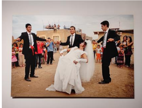
Görsel 7. Şükran Moral, Evli, Üç Erkekli , 2010, 80x120 cm, Pigment baskı, İdil Tabanca Koleksiyonu.

Yabancı sanatçıların eserlerinde görüldüğü gibi çağdaş sanat pratiklerinde sanatçılar tarafından yararlanılan belli başlı kitsch olgular Türk çağdaş sanatına da yansımıştır. Bu eserlerde yenilenmeye ihtiyaç duyan katı bir bakış açısının ve toplum tarafından benimsenmiş belli kült değerlerin sanatsal uygulamalar ile yeni kalıplara döküldüğü gözlemlenebilir. Özellikle çağdaş sanat alanı içindeki kültür ve gelenek odaklı bazı eserler bunlara örnek verilebilir. Görsel 7'de Türkiye'nin ilk performans sanatçılarından biri olan Şükran Moral'ın "Evli, Üç Erkekli" adlı performansına ait bir kare yer almaktadır. Eserde cinsiyetlere biçilen rollerin değiştirildiği görülmektedir. Tek bir gelin etrafındaki damatların bellerine sarmalanmış kırmızı, bekareti temsil eden kuşaklar geleneğin kodlarından olup, kuşakların kitsch bir tavrı sunduğu kabul edilebilir. Performansta kitsch kavramının cinsiyeti ön plana sürerek bireylere aktardığı tezatlık ve bununla beraber akışa dahil olan kavramsal şekillenme altında yatan kederci bazı göndermeler bulunmaktadır. Bunlar erken yaşta evlilik, çok eşlilik, kadına şiddet, erkeğe atfedilen zorlayıcı sorumluluklar gibi geniş ve toplumsal bir problem alanını kapsamaktadır. Bu konular performansta gerçekliğin zıttı bir atmosfer yaratılarak verilmiştir.