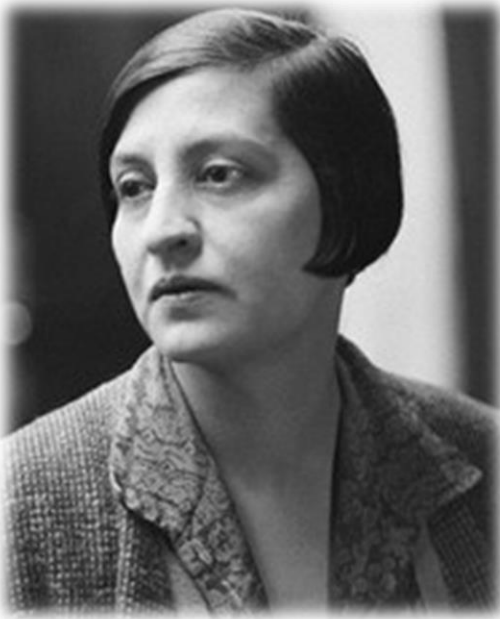
Halide Edib Adıvar

toplumların üyeleri veya toplulukları arasındaki güç denge(sizlik)lerini ortaya çıkarmaktadır. Patriyarkal toplum düzeninde erkeğin, heteroseksüelin, beyazın, üniversite veya lisansüstü eğitim almış bireylerin, herhangi bir sağlık sorunu olmayanların, toplumdaki hakim din ve mezhep inancına sahip olanların, iktidarın politikalarını destekleyenlerin, fiziksel olarak daha alımlı olanların, ekonomik bakımdan zengin olanların güç sahibi olarak görülmesi, bu niteliklere sahip olmayanların ezilen taraf olarak kategorize edilmesi, toplumların güç sahiplerinin üstünlüğünü sürdürülebilir kılmaya yönelik bir pratiktir. Burada ironik olan durum, güç sahibi olma durumunun yukarıdaki etmenler bakımından güçlü olanlar tarafından belirlenmesidir. Bireyin veya topluluğun salt bir özelliğinin genelleştirilerek onların genel kimliği gibi gösterilmesinden dolayı güç sahibi olmayan taraf olarak etiketlenen şahıslar veya topluluklar, toplumsal pratiklerin etkisi altında bu “zayıflıklarını” norm olarak algılar hale gelir.