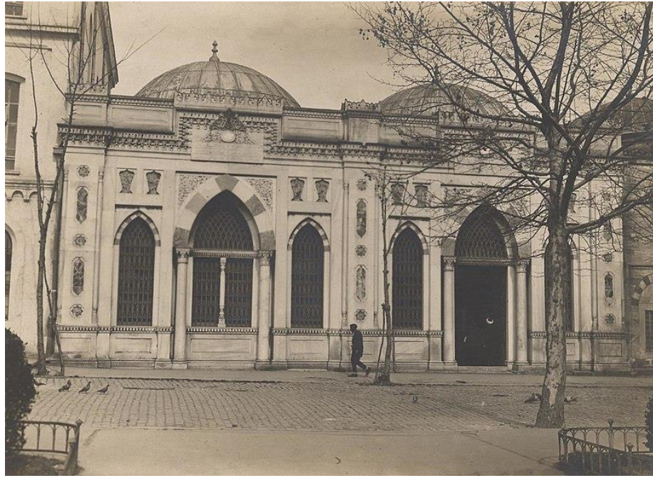
Görsel 2: Beyazıt Umumi Kütüphanesi

Kütüphane Beyazıt Camii'nden getirilen, etraftan toplanan, satın alınan ve bağış yoluyla gelen kitaplar ile açılmıştır. Devletçe halk hizmetine açılan ilk kütüphane olan Beyazıt Umumi Kütüphanesi 27 Eylül 1882'de hizmete girmiştir (Kütüphanenin Penceresinden, 1962). 1940'lı yıllarda Çocuk Kütüphanesi açılmakla birlikte fazla rağbet olmadığı için kapatılarak Cilthane açılmıştır (Gürlek, 2000). 1961 yılında Milli Eğitim Şûrası'nda alınan karar ile kütüphanenin adı "Beyazıt Umumi Kütüphanesi" olmuştur. Beyazıt Umumi Kütüphanesi'nin ilk müdürü Hoca Tahsin Efendi'dir (Dalkıran, 2024, s. 231). İsmail Saib Sencer, Tahsin Efendi'nin ölümünden sonra kütüphanenin hâfız-ı kütübü (müdür) olmuştur (TDV, 2024). İsmail Saib Sencer, 1921'de Darülfünun Edebiyat Fakültesi Arap Edebiyatı Müderrisi (profesörü) iken bu görevinden 1925'te