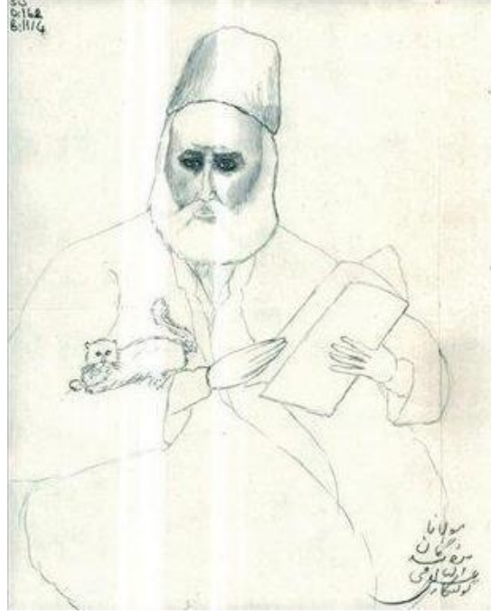
Görsel 3: İsmail Saib Sencer

İsmail Saib Sencer Arapça, Farsça, Fransızca ve Almanca'yı öğrenmiş, Grekçe ve Latinceyi anlamış ve ilmi yönden kendisini geliştirmek amacıyla Tıp, Eczacılık ve Hukuk eğitimleri almıştır. Binlerce kitabı tanıyan çok geniş bir hafızaya sahip olduğu için yerli ve yabancı alimlerce fihrist-i ulûm, ayaklı kütüphane, canlı bibliyografya, sanduka-i kemalat, kütüphanedeki kütüphane ve çağının Câhiz'i gibi sıfatlara layık görülmüştür (Refik, 2017). O, Beyazıt Devlet Kütüphanesi'ndeki yarım asırlık mesaisini hep okuyucu ve araştırmacılarına hasretmiş ve kütüphanede 24 saat kendisini görevli saymıştır (Duman, 1980, s. 146). Müdürlüğü zamanında Ankara'dan kütüphaneye gönderilen ödenekle zehir alınarak kütüphanedeki fareleri itlaf etmesi istenmiştir. İsmail Saib Sencer bu ödenek ile kedilerine taze ciğer aldığı için hakkında tahkikat açılmıştır (Gürlek, 2019). Kedileri sevdiği bilindiği için hastalıklı ve bakıma muhtaç kediler kütüphanenin bahçesine bırakılmış ve İsmail Saib Sencer bu kedileri her gün ciğer ve süt ile beslemiştir. Kütüphanede dolaşan kediler bazen kitap raflarından pat diye okuyucuların önüne düşmüştür (Somuncu Baba, 2021: 73). Dolayısıyla O'nun alimliği, kitap ve kedi sevgisi Beyazıt Umumi Kütüphanesi'ni cezbe-figen ve efsunkar bir mekana dönüştürmüştür (Ay, 2023, s. 9).