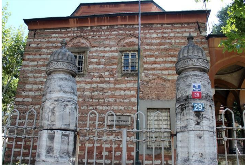
Görsel 1: Köprülü Kütüphanesi

Köprülü Mehmet Paşa tarafından yapımına başlanan Köprülü Kütüphanesi 1661 yılında Köprülü Mehmet Paşa'nın oğlu Fazıl Ahmed Paşa tarafından tamamlanmıştır (Kütüphanenin Penceresinden, 1962). 1678'de hizmete başlayan Kütüphane'de farklı hizmet başlıklarına yer verilmiştir. Kütüphane'nin açık olduğu günler üçe çıkartılmış, çalışma saatleri güneşin doğuşundan ikindiye kadar belirlenmiş, sadece kütüphaneye mahsus bir kadro oluşturulmuş ve bu kadroya devrine göre oldukça tatmin edici bir ücret ödenmiştir (Erünsal, 2016). Köprülü Kütüphanesi'nde klasik Osmanlı kütüphanelerinde bulunan minder, kilim, halı ve rahleler kaldırılmış ve masa, sandalye ve yeni kitap dolapları yerleştirilmiştir (Anameriç, 2006, s. 198). Kütüphanede kitapların dışarıya çıkarılmaması kuralı yerine güvenilir bir kefil veya rehin karşılığında kitapların ödünç verilmesi uygulamasına geçilmiş ve evlere okumak üzere ödünç