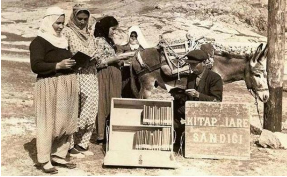
Görsel 4: Eşekli Kütüphane

Eşekli Kütüphane ile birlikte açılan kütüphanelerde farklı sosyal ve kültürel faaliyetler gerçekleştirilmiştir. “Voleybol sahalarının açılması, futbol takımlarının kurulması, dikiş ve halı dokuma kurslarının açılması ve kadınların ilgi alanına girebilecek moda, yemek ve çocuk bakımı ile ilgili dergilerin alınması” sonucunda kütüphanelerde hizmet odaklı bir yaklaşım ortaya çıkmıştır (İleri, 2019, s. 52-56). Kütüphanelerde çocuk, kadın ve gençlere özel faaliyetler gerçekleştirilmiş, dikiş ve halı dokuma kursları ile bölgenin sosyo-ekonomik açıdan gelişmesine katkı sağlanmıştır. Eğitimde fırsat eşitliğinin sağlanması ve köylerde bilgiye erişimin kolaylaştırılması hasebiyle Eşekli Kütüphane Hizmetkar Kütüphane kapsamındadır.