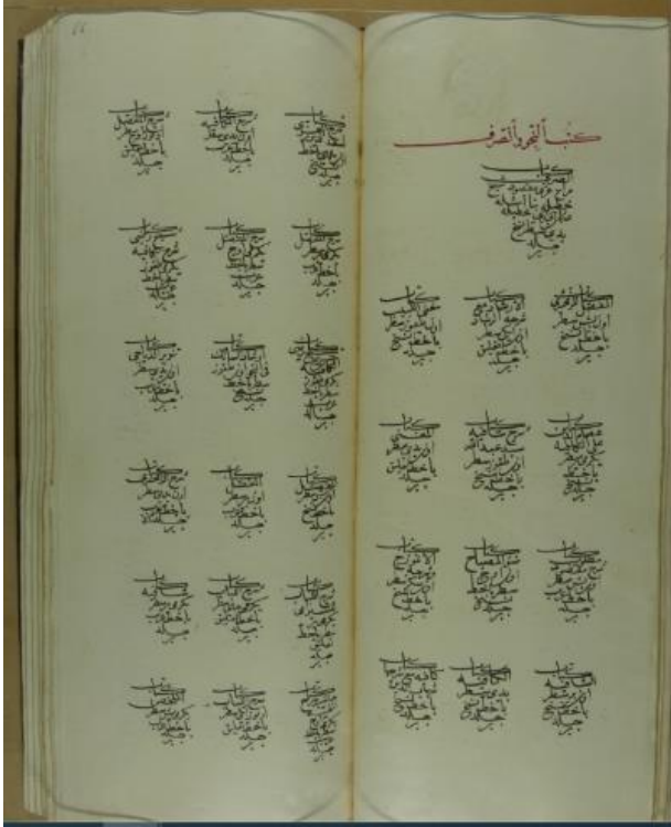
Ek:2 “Kütübü'n-Nahiv ve's-Sarf” başlığı altında listelenen eserlere dair katalogdan bir örnek [vr. 67b-68a]