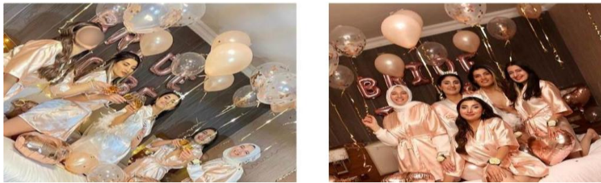
Fotoğraf-7: Bekârlığa veda partilerinde kadınların kullandığı kostümler.

Bekârlığa veda partilerinde gelin, nedimelerinin koluna bu geceden bir anı olması için birer bileklik takar, ayrıca bekâr olan arkadaşlarına partide takmaları için taç ve duvak hazırlatır. Teselli tacı ya da teselli duvağı denilen bu aksesuar, gelinin bekâr arkadaşlarının üzülmemesi ve temsilen gelin olması amacıyla yapılır. Bu partilerde gelin maskeleri, nedime aksesuarları, tüylü otrişler, hatıra çerçeveleri, gözlük gibi pek çok eşya, aksesuar da konsepti