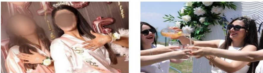
Görsel-11: Bekârlığa veda partisinde sabahlık ve balonla yapılan eğlenceler.

Türkiye’de damat ve arkadaşları arasında da bekârlığa veda partisi düzenlenmektedir ve bu eğlenceler genelde “bar, cafe, sauna, otel gibi yerlerde kutlanmaktadır. Bunların yanı sıra