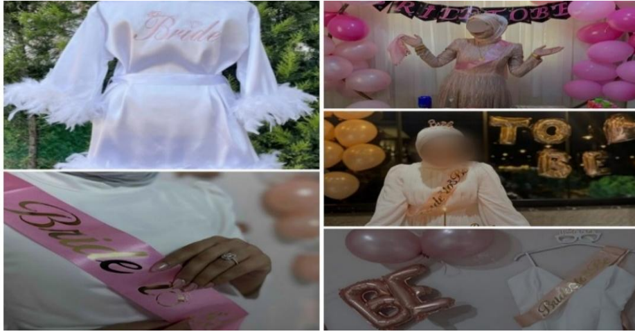
Fotoğraf-3: Gelin sabahlık ve partide kullanılan özel kıyafetler.

Türkiye’de yaklaşık yirmi yıl öncesine kadar şehir merkezlerinde kutlanan bekârlığa veda partileri, günümüzde artık hemen hemen her yerde yayılmaya ve moda haline gelmeye başlamıştır. “Taşrada geleneğe bağlı kına gecelerinin yanı sıra düğünden birkaç gün önce gelin ile nedimleri, topluma açık olmayan bir mekânda bekârlığa vadi partisi düzenler. Bu partilere gelin ve güveyin aileleri, yakın akrabaları katıl(a)maz ve sadece özel davetli kişiler bu eğlenceye iştirak eder” (KK-2). “Özel bir mekânda/ortamda kutlanan partilerde kostüm başta olmak üzere hemen hemen her şey modern ve modaya uygun bir tarzda dizayn edilir. Bekârlığa veda partilerinde gelin geleneksel kıyafetlerden bindallı yerine pijama, sabahlık giyerken” (KK-3) “damat, takım elbise yerine şort, tişört gibi günlük elbiseler giymektedir” (KK-8). Geleneksel kına gecelerindeki giyim tarzı ile modern bekârlığa veda partileri arasındaki giyim farkının oluşmasında modanın etkisi vardır. Gelinler genelde rahatlığı, özgürlüğü ifade eden sabahlık, pijama gibi elbiseleri tercih etmektedir. Bu sabahlık ve pijama artık normal bir kıyafet olmaktan çıkmış olup özgürlüğü, sınırsız eğlenceyi ifade eden sembole dönüşmüştür. Bunun nedeni modern partilerin giyim başta olmak üzere geleneksel eğlencelerin pek çok kalıbını, tarzını değiştirme gücüdür.