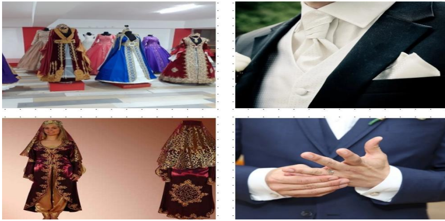
Fotoğraf-1: Gelinlerin giydiği bindallı ve erkeklerin giydiği damatlık.

Düğünden bir önceki akşam başlayan kına gecelerinde gelin ve damat bazı yöresel kıyafetler giyerler. Gelin bindallı giyerken güvey damatlık giyer, bu kıyafetlerde genelde kültürel kodlar, yöresel semboller yer almaktadır. Bölgeye göre gelinlerin bindallısındaki nakışlar ve renkler değişmektedir. Gelinlerin kına gecesinde giydiği kıyafetlerde kırmızı, lacivert, yeşil renkler ağırlıktadır, bu renkler bereketi, saflığı, mutluluğu ifade ettiği için tercih edilir. Gelin elbisesindeki çiçekli nakışlar hemen her bindallı da öne çıkmaktadır, çiçek ise hayatı, huzuru, temizliği belirten kültürel bir semboldür. Güveyin giydiği yöresel kıyafetlerde, damatlıklarda siyah, lacivert renkler ağırlıktadır. Söz konusu renkler ciddiyeti, ağırlığı, sorumluluk sahibi olmayı dolaylı yoldan dile getirir.