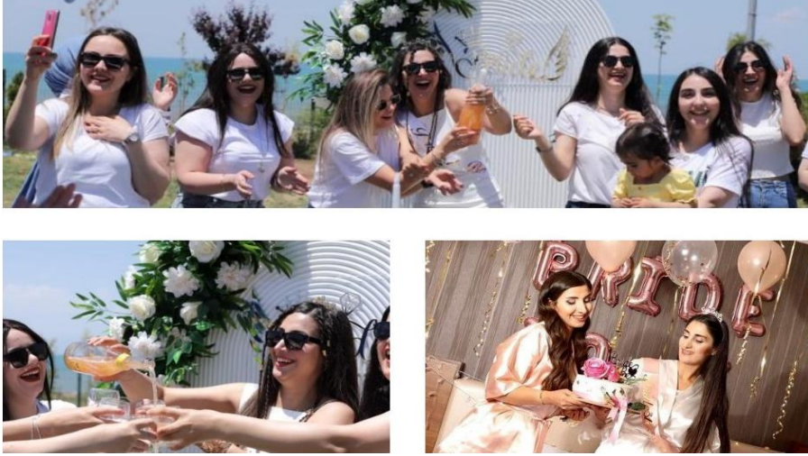
Fotoğraf-4: Alkollü/içecekli, pastalı yapılan bekârlığa veda partisi

Bekârlığa veda partilerinde toplumun, ailenin baskısından uzak sınırsız, yasaksız eğlencenin ön planda olduğu görülmektedir. Ayrıca partide insanları gevşetecek, rahatlatacak kola, soda, meyve suyu şerbet gibi alkolsüz içeceklerin yanında likör, bira gibi alkollü içecekler bulunmaktadır. Türkiye’de kutlanan bekârlığa veda partilerinde alkollü içecekler bazen dekor olarak kullanılmakta bazen de tüketilmektedir. Bu partilerde tüketilen yiyecekler ise tatlı ve atıştırmalık ağırlıktadır. Yurtdışındaki partilerde özel pastalar ve kekler hazırlanır ve görsel olarak genellikle penis ya da kadın organları şeklindedir (URL-1). Türkiye’de kutlanan bekârlığa veda partilerinde erkek-kadın organlarına benzetilen yiyecekler pek yer almamaktadır. Bunların yerine genelde özel olarak hazırlanan mezeler, pastalar, kekler vardır. Yurtdışında hazırlanan pastalar cinsellik teması üzerinde yoğunlaşırken Türkiye’de böyle bir durum söz konusu değildir.