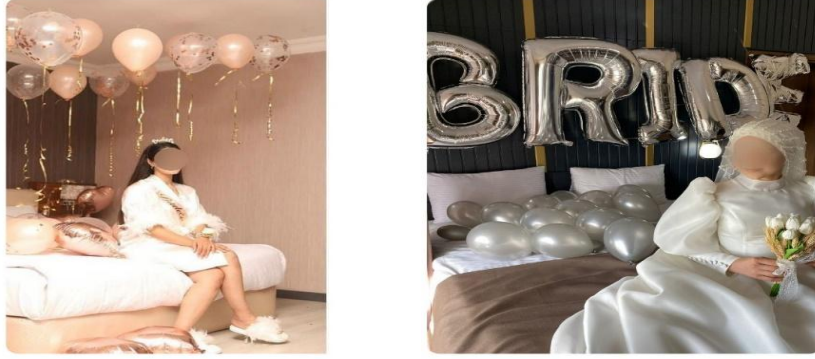
Fotoğraf-6: “Bride to be/gelin olacak” mottosu ve gelinin yatak odası.

Böylece gelin partinin genel atmosferine uyum sağlayarak rahatlar ve evlenmeden önceki son bekârlık anının heyecanını yakın dostlarıyla eğlenerek paylaşır.