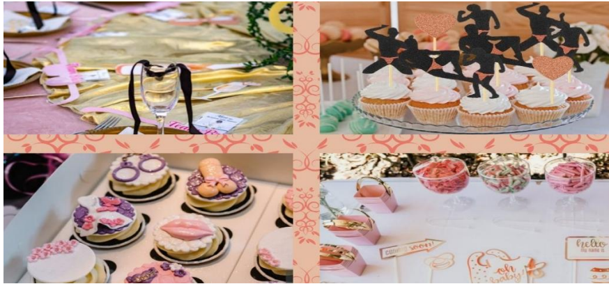
Fotoğraf-5: Kadın ve erkek uzuvlarına benzetilmiş pastalar, ekler vd.

Bekârlığa veda partilerinde toplumun, ailenin baskısından uzak sınırsız, yasaksız eğlencenin ön planda olduğu görülmektedir. Ayrıca partide insanları gevşetecek, rahatlatacak kola, soda, meyve suyu şerbet gibi alkolsüz içeceklerin yanında likör, bira gibi alkollü içecekler bulunmaktadır. Türkiye’de kutlanan bekârlığa veda partilerinde alkollü içecekler bazen dekor olarak kullanılmakta bazen de tüketilmektedir. Bu partilerde tüketilen yiyecekler ise tatlı ve atıştırmalık ağırlıktadır. Yurtdışındaki partilerde özel pastalar ve kekler hazırlanır ve görsel olarak genellikle penis ya da kadın organları şeklindedir (URL-1). Türkiye’de kutlanan bekârlığa veda partilerinde erkek-kadın organlarına benzetilen yiyecekler pek yer almamaktadır. Bunların yerine genelde özel olarak hazırlanan mezeler, pastalar, kekler vardır. Yurtdışında hazırlanan pastalar cinsellik teması üzerinde yoğunlaşırken Türkiye’de böyle bir durum söz konusu değildir.