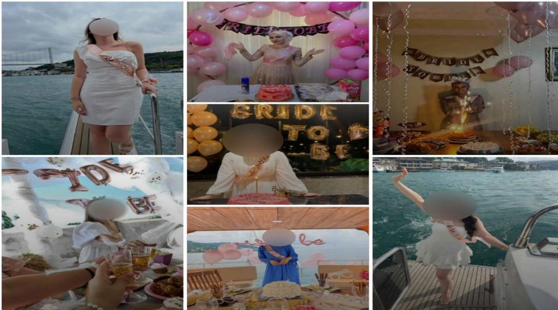
Fotoğraf-2: Farklı Konseptlerde ve ortamlarda bekârlığa veda partisi kutlamaları (evde, yatta, teknede) § .

Yüz yüze yaptığımız görüşmelerden hareketle, bekârlığa veda partisinin geleneksel kına gecelerinden farklılıkları şu şekilde sıralanabilir: “Bu partilere gelin ve damadın ailesi, akrabaları değil tam aksine yakın arkadaşları, akranları katılabilmektedir. Geleneksel kına geceleri genelde gelinin evinde, düğün salonunda düzenlenirken bekârlığa veda partisi otelde, barda, yatta, spa merkezinde, özel apart da ve hamam gibi özel mekânlarda yapılmaktadır” (KK-3). Bu partiler gelin ve damat adaylarına evlilikten önce serbestçe kendilerini ifade etme ve ebeveynlerinden bağımsız eğlenme, karar alma gibi bireysel yetenekler, sorumluluklar kazandırır.