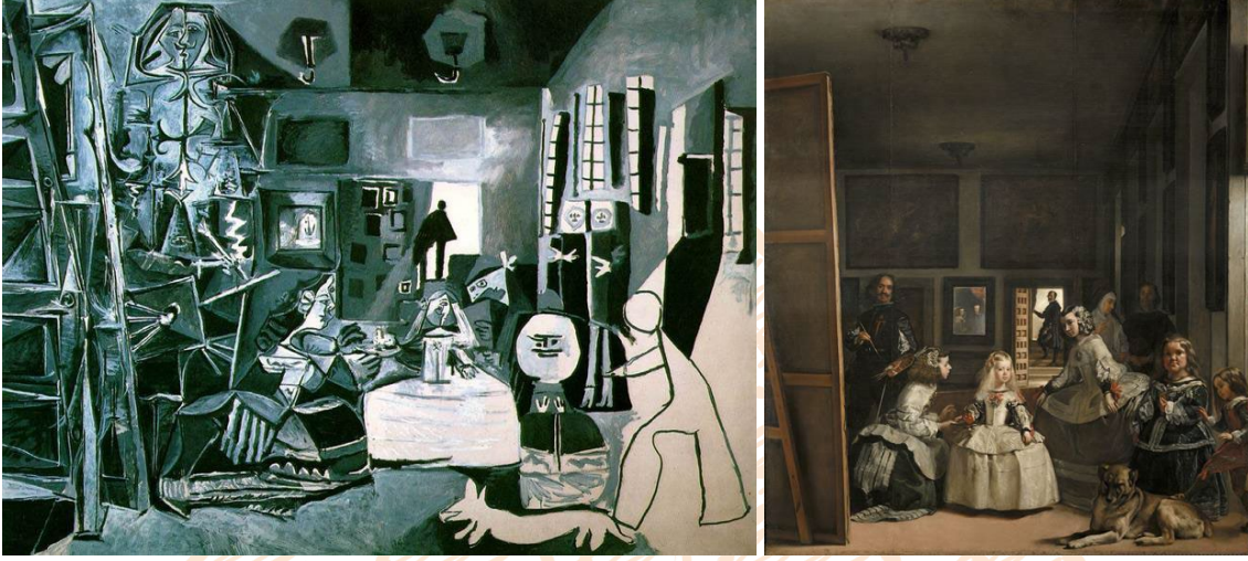
Görsel 11 (Soldaki). Pablo Picasso, "Les Menines (Velazquez)", 194x260 cm, 1957

Ünlü Kübizm sanatçısı Picasso'nun da başka eserleri yeniden üreterek kendine mal ettiği çalışmaları bulunmaktadır(Görsel 11). Picasso da Valezquez'in ünlü eseri olan "Les Menines"i(Görsel 12) yeniden üreterek temellük yapmıştır. Görüldüğü üzere sanatçı temellük ettiği eseri tamamen kendi tarzı ile ele almıştır.