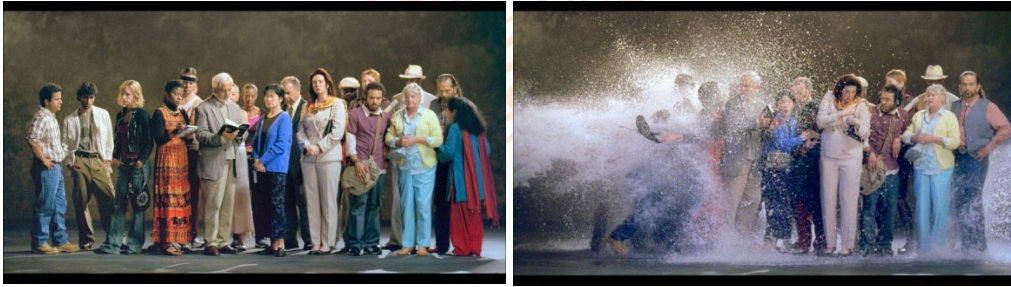
Görsel 13. Bill Viola, "Sal", 2004

Sanatçının neredeyse her eserinde su imgesini kullandığı göze çarpmaktadır. Sanatçının eserlerinde su imgesini sıkça kullanması, kendisinin 6 yaşındayken geçirdiği ölümcül boğulma tehlikesinin bir yansıması olarak düşünülmektedir.