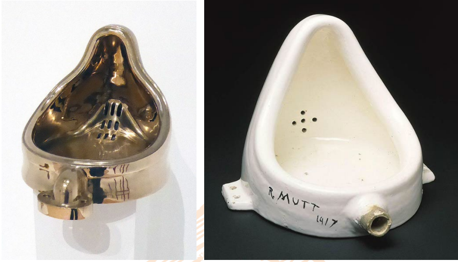
Görsel 3 (Soldaki). Sherrie Levine, “Çeşme/Madonna”, 1991, Bronz