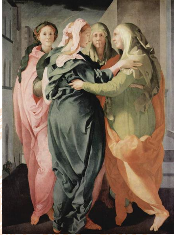
Görsel 15 (Soldaki). Bill Viola, “Selamlama”, 1995