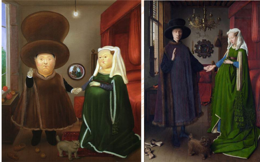
Görsel 9 (Soldaki). Fernando Botero, “Arnolfini Van Eyck’ten sonra (2)”, 1978

Botero’nun temellük ettiği tek eser Mona Lisa değildir. Botero figürleri şişmanlatarak birçok klasik sanat eseri yeniden üretmiş ve parodi içeren eserler oluşturmuştur. Örneğin “Arnolfini Van Eyck’ten sonra (2)” (Görsel 9) adlı eser, ünlü Rönesans sanatçısı Jan van Eyck’in en önemli eserlerinden olan “Arnolfini’nin Evliliği” adlı eserin temellük edildiği bir çalışmadır.