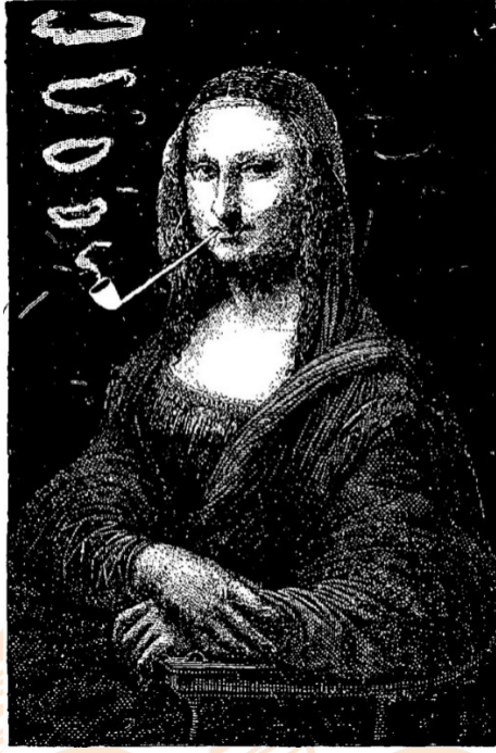
Görsel 7. Eugène Bataille, “Mona Lisa Pipo İiyor”,1883

Esere bakıldığında siyah zemin üzerine beyaz çizgi ve noktalarla betimlenmiş bir Mona Lisa figürü görülmektedir. Orijinalinden farklı olarak Mona Lisa'nın ağızına bir pipo yerleştirilmiştir. Ayrıca Pipodan yükselen duman halkaları da betimlenmiştir.