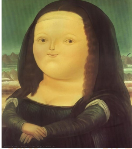
Görsel 8. Fernando Botero, “Mona Lisa (Leonardo Da Vinci’nin Ardından)”, 1978

Botero’nun temellük ettiği tek eser Mona Lisa değildir. Botero figürleri şişmanlatarak birçok klasik sanat eseri yeniden üretmiş ve parodi içeren eserler oluşturmuştur. Örneğin “Arnolfini Van Eyck’ten sonra (2)” (Görsel 9) adlı eser, ünlü Rönesans sanatçısı Jan van Eyck’in en önemli eserlerinden olan “Arnolfini’nin Evliliği” adlı eserin temellük edildiği bir çalışmadır.