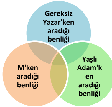
Şekil 1. Karakterin Benlik Durumu

Romanın yazılma amacını da oluşturan olay örgüsü belirli bir zaman, mekân içerisindeki kişi davranışlarının neden ve sonuçların yazarın muhayyilesinden damıtılarak kurgulanmış biçimdir. Romandaki belirsizlikleri arttırmaya çalışan Güray Süngü, okurun algılama sınırlarını zorlayan bir kurgu yaratmıştır. Kurgu dolayısıyla romanda neden sonuç ilişkilerini tespit etmek oldukça güç bir duruma gelmiştir. Klasik ve modern romanların aksine olay önemini kaybetmiş yerine oyun ve belirsizlik gelmiştir. Okuru romanın anlamlandırılmasında daha aktif bir konuma getiren bu anlayış her türlü mantık kurallarını yıkarak olayı, kişileri, zamanı ve mekânı kaygan bir zemin üzerine inşa etmiştir. Okur gerçek ile kurmaca arasına sıkışmıştır. Parodi, pastij, kolaj, üst kurmaca ile belirsizlik artmış olay örgüsü daha girift bir duruma dönüşmüştür (Evis, 2021). Düş kesigi romanı fantastik öğelerle bezenmiş gerçeğin düş ile iç içe geçtiği karmaşık bir olay örgüsüne sahiptir. Farklı zaman ve mekân algısına sahip olan olaylar kimi zaman tek bir çizgide ilerlemesine rağmen çoğunlukla iç içe geçmiş bir yapıdadır. Üç ana bölümde sırasıyla anlatılan olaylar "helezonik" bir şekilde olay örgüsünün yapılanmasını sağlamıştır. Bu nedenle roman kaygan bir zemine oturtulmuştur. Postmodern anlatılara özgü olan bu yapıyı aşağıdaki şekil ile anlatacağız: