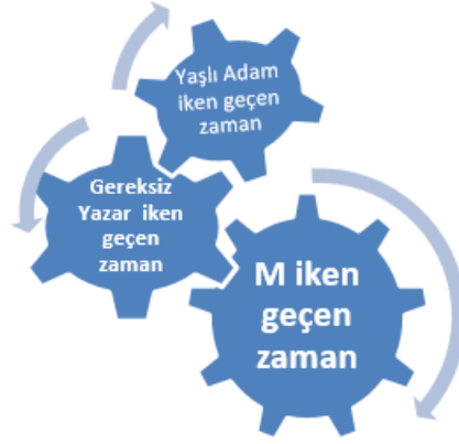
Şekil 3. Karakterin İçinde Bulunduğu Zaman

(s. 151) cümlesinde olduğu gibi zaman muğlaklığını sürekli korumaktadır. Zaman benliklerle beraber ilerler bir benlik ileri bir zamandayken diğer benlik geçmiş zamandadır. Ayrıca evde zaman daha ağır ilerlerken konakta daha hızlı ilerler. Romanda karakterin gençliğinin geçtiği dönemleri geriye dönüş tekniğiyle hatırladığı sırada, yazar çocukluk yıllarına kadar gider. Üç katmanlı zaman şeklini alan bu yapı postmodern romana özgü bir anlatım biçimidir. M yaşadığı zamanda diğer benliği Yaşlı Adam ile kendisi ile karşılaşır. Gelecekteki kendisi ile şimdiki zamanda karşılaşması romanda belirsizlikleri oluşturmakta bir araçtır. Bu belirsizlikler okuru da atkifleştirir (Güler, 2022: 147). Aynı anda birbiriyle çakışan zamanı saatin çarklarına benzeterek şekil 3 ile temsil etmek daha açıklayıcı olacaktır.