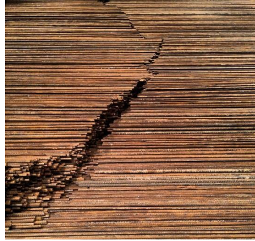
Görsel 6. Ayrıntı, (Erişim 09.09.2024, https://124.im/WcqdM )