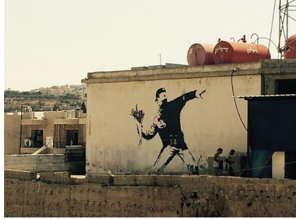
Görsel 2. Banksy, Duvar Resmi, Beytüllahim / Filistin, 2015, (Erişim 09.09.2024. https://124.im/bmd4 )