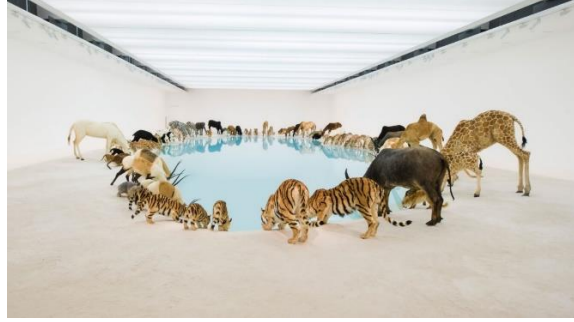
Görsel 18. Cai Guo-Qiang. Miras. 2013, (Hayvanların, suyun, kumun, damlama mekanizmasınının 99 gerçek boyutlu kopyası, değişken boyutlar). (Erişim 09.09.2024. https://124.im/bsxM )

manzaraya bakış açısını toptan değiştirmiş oluyor böylece. (Bu aynı zamanda bireylere, doğaya yaklaşımda alternatif bir bakış açısı sunmak anlamında da sanatçı ve eseri tarafından sunulmuş önerme ve gerekçedir.