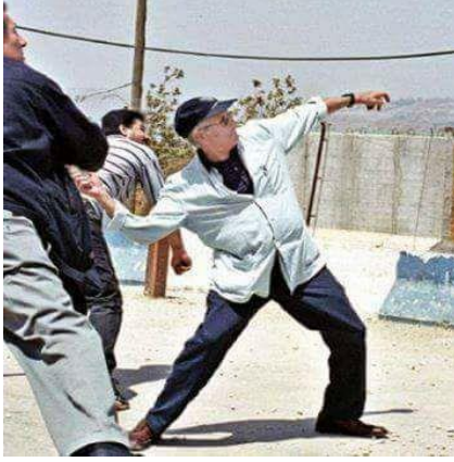
Görsel 1. Edward Said, Fotoğraf, 2000, (Erişim 09.09.2024. https://124.im/atIX )

Cinsler arasında yaşanan sorunların gündemde tutulması ya da gelenekselleşen yanlış bilgilerin düzeltilmesinde ısrarcı olan Cindy Sherman’ın, Judy Chicago’nun, Robert Mapplethorpe, vb. gibi sanatçıların yapıtlarına duyulan ilgi, siyasi, ekolojik ve kimlik sorunlarını işleyen yapıtlardan daha az değildir.