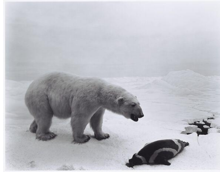
Görsel 19. Hiroshi Sugimoto. Kutup ayısı. 1976. (Jelatin gümüş baskı). (Erişim 09.09.2024. https://124.im/vh9peO )

Bir yerde olmak, bir manzarada olmak, orası ile kurulan bağlantı ya da ilişkilerle alakalı olarak değerlendirilebilir.