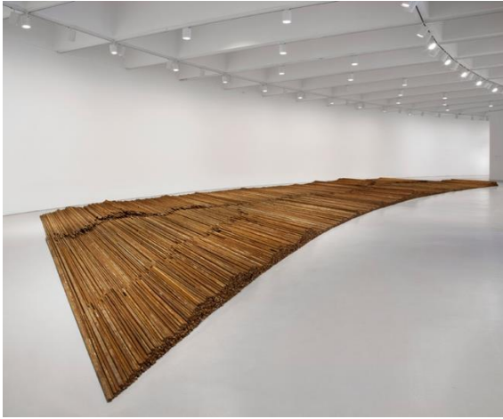
Görsel 5. Ai Weiwei, Düz, Yerleştirme, 2012, (Erişim (10.09.2024) https://124.im/FsC6qkc )

Çağdaş sanatı yakından izleye herkes, Banksy benzeri yaklaşımla, ama kimliğini ve muhalif duruşunu gizlemeden sanat yapan Ai Weiwei'yi iyi bilir. 12 Mayıs 2008 yılında Çin'in Sichuan şehrinde tüm zamanların en ölümcül depremlerinden biri yaşandı. Bölge yerle bir oldu ve yaklaşık 90.000 kişi hayatını kaybetti. Sichuan'daki pek çok binanın, özellikle de okulların altyapısının zayıf olması nedeniyle kaydedilen ölümlerin 5000'den fazlası ise çocuktü. 7000'den fazla okulun yıkılmasına neden olarak, yapıların inşasında yer alan hükümet yetkilileri ve inşaat şirketlerinin yolsuzluk yaptığına dair bir dizi raporlar ortaya çıkınca Ai Weiwei sorumlu bir yurttaş olarak devreye girdi. Yıkılan okul binaların inşaatında kullanılan demirleri toplayarak elle tek tek düzleştirdi ve Dünyanın önemli sanat mekânlarında sergiledi. Ai Weiwei'nin doksan ton demirden oluşan 'Düz' / Straight' isimli eseri, depremlere neden olan jeolojik fay hatlarını temsil edecek şekilde kırık dalgalanmalar halinde yerleştirildi. Böylece, depremde yaşanan duygusal ve dramatik anı sonsuza dek ölümsüzleştirmiş oldu (Görsel5, 6).