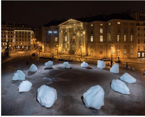
Görsel 9. Olafur Eliasson, Buz Gözlemi (2014, 2015, 2018, https://124.im/jy3s )

Robert Moskowitz önlem alınmazsa buzullar eriyecek, yaşam alanları sular altında kalacak söyleminin artık bir anlamının kalmadığını, buzulların erimesi sonucunda doğabilecek felaketin önlenmesinde artık çok geç kalındığını kutuplarda kalmış son küçük bir buzulla anlatıyor. Olan olmuştur. Yer ve gök gri ve siyahın tonlarına bürünmüştür (Görsel 8).