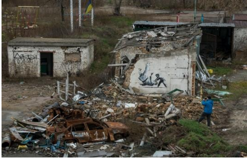
Görsel 3. Banksy, Duvar Resmi. Borodyanka / Ukrayna, 2022, (Erişim 09.09.2024. https://124.im/AQ15j )