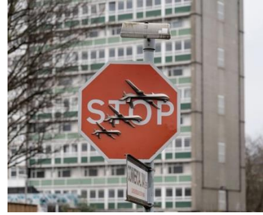
Görsel 4. Banksy, Gazze için Ateşkes Çağrısı, Londra, 2023, (Erişim 09.09.2024. https://124.im/yu79Fld )

Savaş karşıtı, hayvan hakları savunucusu ve aynı zamanda çevreci mesajlar veren Banksy, bu makalede tanımlanmaya çalışılan günümüz sanatçı kimliğine bire bir uyan bir sanatçıdır. Açık kimliği belli olmayan Banksy, siyasi ve toplumsal içerikli konuları, Dünyanın neresinde olursa olsun, sorunlu bölgelerindeki duvarlara, yollara, köprülere basit bir resim tekniğini kullanarak hicivli bir dil kullanan aktivist bir dünya insanı olduğunu ortaya koyar. Haziran 2000 yılında, 20. Yüzyılın önemli entelektüellerinden Edward Said’in Güney Lübnan’da bulunduğu esnada intifada eylemleri nedeni ile İsrail askerlerine fırlattığı taş Dünyada büyük yankı uyandırdı. Taş fırlatma görüntüsü gazetelerde günlerce yayınlandı. Banksy’nin 2012 yılında Filistin şehri olan Beytüllahim’in sokak duvarlarından birine yaptığı resmine ilham kaynağı olan bu fotoğraf, Filistin’de yaşanan savaşın en ikonik sembollerinden birine dönüşmüş durumdadır (Görsel 1, 2). Benzer bir şekilde Banksy, Ukrayna Savaşını başlatan bugünkü Rusya liderinin Judo, tekvando ve karateye ilgisi olduğu bilinir. Savaş nedeni ile yıkılmış Borodyanka şehir duvarlarından birine Ukraynalı küçük bir çocuğun siyah kuşak sahibi dövüşçüyü alaşağı ederek dünyanın tüm savaş karşıtı insanların yüreğine su serpmiş oldu. (Görsel 3). İnsanlık dramına dönüşen başka bir savaş da Gazze’de devam ediyor. Londra’nın güney kesiminde “STOP” yazan trafik levhasına yaptığı