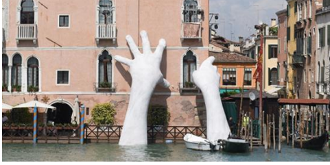
Görsel 7. Lorenzo Quinn, Destek, 2017, (Erişim 09.09.2024. https://124.im/qnEOiB )

ve Robert Smithson'un Utah Tuz Gölü'nde ürettiği "Spiral Jetty / Sarmal Dalgakıran (1970) eserleri bugünün sanatında nasıl bir söylem ve biçim dilinin kullanılacağını habercisi gibiydiler. Yarım yüzyılı aşkın süre öncesinde ortaya çıkan bu düşünce bugün güncelliğini hala korumaktadır. Bir farkla, doğanın eşsizliği ya da üstünlüğünden değil, doğanın karşı karşıya kaldığı felaketlere karşı bir farkındalık yaratmak için.