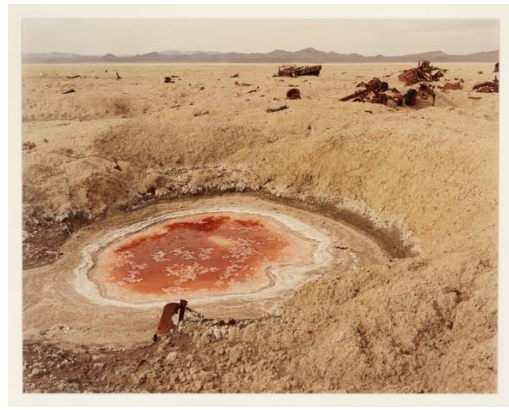
Görsel 10. Richard Misrach, Bomba Krateri ve Yıkılan Konvoy, 1986, (Erişim 09.09.2024. https://124.im/MACnqIN )

Metropollerde yaşayan insanlar, buzulların erimesinin yaratacağı felaketlerin henüz farkında değil. Ne çevreci söylemler, ne aktivist eylemler ne de bilimsel çalışmalar erimeyi durdurdu. Halkı ve devletleri iklim krizinde daha etkili çözümler üretmeleri için geriye sanatçıların ironi yüklü imgeler yoluyla anlatım dili kalıyor. Doğal olayları yapay yollarla yeniden yaratmasıyla tanınan sanatçı Olafur Eliasson, Grönland adasından taşıdığı 12 buz küresini Paris'in orta yerine taşıdığı anda amacı, iklim krizi nedeni ile hızlı eriyen buzullara kent halkının çıplak gözle tanık olmasını sağlayarak ekolojik farkındalık yaratmaktı. (Görsel 9)