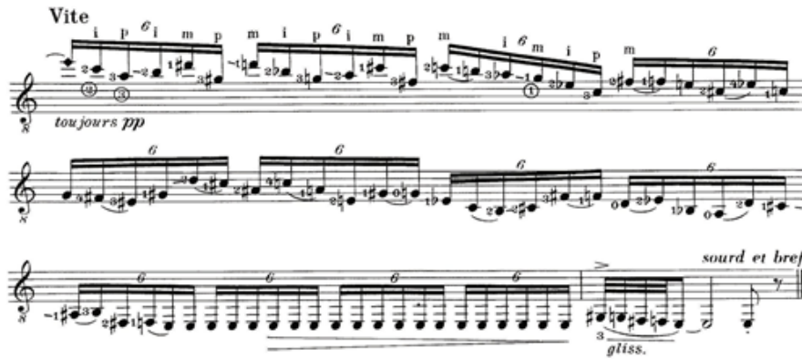
Şekil 8. Plainte final bölümü (Scheit, 1959, s. 7)

Şekil 8'de gösterilen final bölümünde besteci Prelude bölümünün bitişinde kullandığı gibi (Şekil 5) 12 ton tekniğini uygulamıştır.