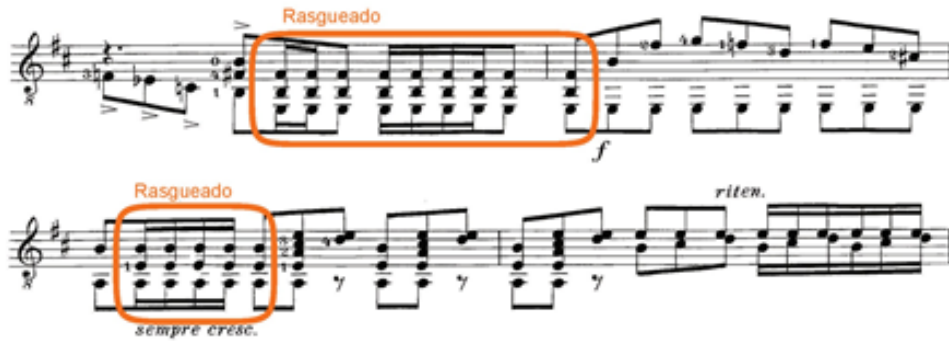
Şekil 4. Prelude, 35-38. ölçüler (Scheit, 1959, s. 4)

Şekil 4'de gösterilen 16'lık değerde, vurgulu çalınması istenen akorları hızlı bir şekilde icra edebilmek için rasgueado tekniğini kullanmak hem etkiyi güçlendirecek hem de daha rahat çalınmasını sağlayacaktır.