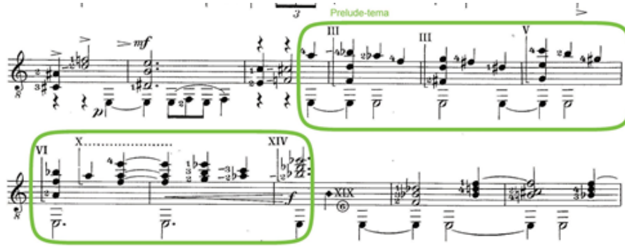
Şekil 13. Comme une Gigue, 50-60. ölçüler (Scheit, 1959, s.9)

Gelişme bölümünün ardından eser tekrar A tempoya dönmekte ve 18 ölçü boyunca giriş bölümünü aynen tekrar etmektedir. 18 ölçülük tekrarın ardından ani bir şekilde bestecinin plus lent tres declame (ağır şekilde, çok güçlü bağırır gibi) olarak belirttiği 6/8'lik final bölümü gelmekte ve eser Prelude bölümünün finalindeki yapıya benzer bir şekilde son bulmaktadır.