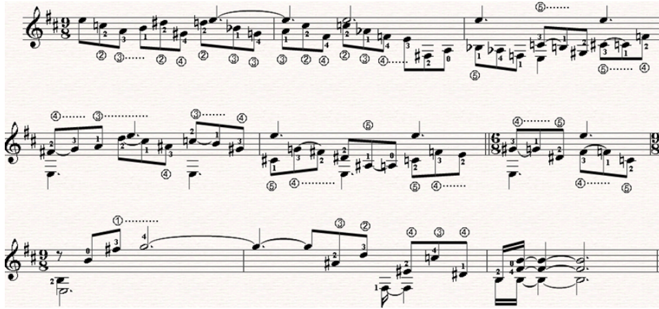
Şekil 5. Prelude, final bölümü

Prelude'de icracıları teknik açıdan en çok zorlayacak bölüm şüphesiz eserin son ölçüleridir (Şekil 5). Bu bölüm oldukça hızlı ve karmaşık melodik yapılar içerdiğinden, iki el içinde detaylı bir parmak numaralandırması yapılmalıdır. Hem müzikal anlamda bütünlüğü sağlamak hem de icracıya daha rahat çalabilme imkânı sağlamak için Şekil 5'de paralel hareketlere olanak sağlayan bir parmak numaralandırması yapılmıştır.