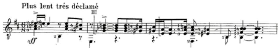
Şekil 15. Comme une Gigue final bölümü (Scheit, 1959, s. 10)

Comme une Gigue bölümünün finali, besteci tarafından "plus lent tres declame"(ağır şekilde ve çok güçlü bağırır gibi) olarak belirtilmiştir (Şekil 15). Oldukça kuvvetli bir şekilde çalınması gereken bu ölçülerin icrası sırasında tellerin aşırı kuvvetle çekilmesi sonucu seslerin çatlamamasına dikkat edilmeli, kullanılan enstrümanın ses kapasitesi dikkate alınmalıdır.