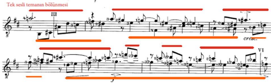
Şekil 14. Comme une Gigue, 17-24. ölçüler (Scheit, 1959, s. 8)

Comme une Gigue, hızlı tempo içerisinde seslendirilmesi istenen karmaşık çoksesli cümleleri ve pozisyon atlamaları ile eserin diğer bölümlerine nazaran teknik anlamda daha fazla ustalık gerektirmektedir. Örneğin temanın bölündüğü 17. ölçüde başlayan ve 8 ölçü boyunca devam eden çoksesli yapıda iki melodinin de aynı anda devam ederken hiçbir sesin zamanından önce kesilmemesi gerekmektedir (Şekil 14). Bu yüzden partiler mutlaka ayrı çalışılmalı ve birleştirilmelidir. Şekil 14'de çift sesli hale gelen tema kırmızı ve turuncu çizgilerle belirtilmiştir.