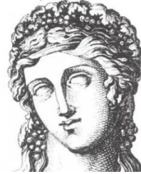
Fotoğraf 31a: (Restore edilmiş Roma fresk tasviri Dionysos ve Ariadne (MS 1-79) (URL-3), Fotoğraf 31,b: Ariadne'nin başı, (URL-4)