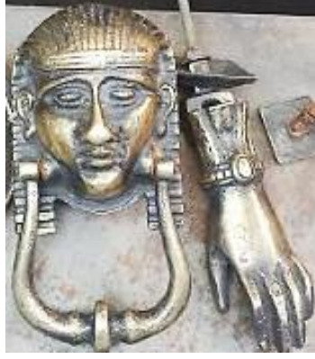
Fotoğraf 43: Gaziantep bakırcılar çarşısından el ve nemes başlıklı aynalı tokmak örneği