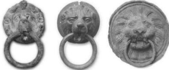
Fotoğraf 1a,b,c: İstanbul Arkeoloji Müzesi'nden Geç Roma Dönemi'ne ait aslan başı şeklinde aynalık örnekleri (Karahan ve Dökmeci, 2010:22)

Mimariden, sikkeye kadar çok farklı alanlarda yaygın bir şekilde kendisine yer verilen aslanın, bir kapının tokmak ya da halkasında kullanılmış erken örneğine ise M.Ö. 1.yüzyılda İtalya'daki Boscoreal'de bir evin duvar resminde rastlanılmıştır (Çal ve Çal, 2008: 6). Burada, göbek bölümü aslan başı şeklinde olan bir halka bulunmaktadır (Çal ve Çal, 2008: 6). Batı dünyasında aslanın kapı tokmağı olarak kullanıldığına yönelik erken döneme ait başka bir örnek ise British Müzesi'nde bulunan 5. yüzyıla ait fildişinden yapılmış bir eserde, Hz. İsa'nın boş mezarını bekleyen askerlerin yer aldığı açık mezar kapısının üzerindeki aslan başlı tokmaktır (Köşklü, 2012:124). Anadolu'da aslana farklı anlamlar yüklenmiş olarak çok farklı alanlarda karşımıza çıkan erken örnekleri, Neolitik Döneme kadar uzanmasına karşın, bir tokmağın ya da halkanın aynalığı olarak kullanılmış erken örneklerine ise İstanbul ve Konya Arkeoloji müzelerinde rastlanılmaktadır. Roma (Fot.1a,b,c) ve Bizans (Fot.2a) dönemlerine tarihlendirilen 3 aslan şeklinde aynalıkları olan bu örnekler, ele alınan örneklerden farklı tipte olsalar bile, ilk örneklerin temsilcileri olmalarından dolayı dikkat çekmektedirler. Geç Roma Dönemi'ne tarihlendirilen bu örneklerle, yakın benzerlik gösteren bir tokmağa, Girne'deki bir otelde de rastlanılmıştır (Fot.3).