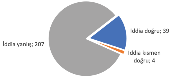
Şekil 2. İddia Kontrolü Yapılan İçeriklerin Doğruluk Oranları

Anadolu Ajansı Teyit Hattı her bir doğrulama içeriğinin sonunda, iddianın doğru veya yanlış olduğuna dair bir teyit sonucu paylaşmaktadır. Buna göre doğruluk kontrolü yapılan 250 içeriğin 39 tanesi doğru, 211 tanesi ise yanlış olarak belirlenmiştir. Öte yandan yanlış olduğu belirtilen 211 içerikten 4 tanesi çeşitli doğru iddialar da barındırdığı için bu çalışmada "kısmen doğru" olarak tanımlanmıştır. Dolayısıyla Anadolu Ajansı Teyit Hattı'nda incelenen 250 iddianın 39 tanesi doğru, 4 tanesi kısmen doğru ve 207 tanesi yanlış iddialardan oluşmaktadır.