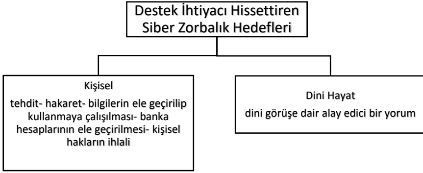
Şekil 3: Destek İhtiyacı Hissettiren Siber Zorbalık Hedefleri

Katılımcılara siber zorbalığa maruz kaldıklarında dinden nasıl destek aldıkları soruldu. Çalışma grubunun dinden; “dua”, “ibadet”, “Kur’an-ı Kerim’i okumak”, “Kur’an-ı Kerim’in Türkçe mealine bakarak teselli aramak”, “Allah’a sığınmak”, “beddua etmek”, “şükür”, “tövbe” gibi yöntemlerle yardım aldıkları görülmektedir. Din, insan hayatında çok fonksiyonel bir vazifeye sahiptir. Hayatın anlamının aranması, depresyon, kaygı ve stresle başa çıkma gibi zorlukların üstesinden gelmeye kadar dinin işlevsel bir yönü vardır. İbadet ve dua gibi dinsel faaliyetler bu konuda başat sığınma referansları olarak karşımıza çıkmaktadır 27 . Katılımcı grubun yükseköğretim kurumlarında din eğitimi alan bireyler olduğu göz önüne alındığında Kur’an-ı Kerim’in anlamıyla teselli bulma çabası daha anlaşılır bir hal almaktadır. Beddua ederek pasif savunma ya da sığınma modunun yanı sıra saldırıya saldırıyla karşılık verme isteği ise bu çalışmanın öne çıkan bir sonucu olarak nitelenebilir. Neticte olarak din problemleri internet kullanımından 28 sosyal medya bağımlılığına