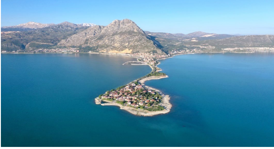
Şekil 1. Eğirdir'in ada kısmından bir fotoğraf

Korkmaz & Başkalkan (2011) tarafından Eğirdir bölgesi üzerine yapılan araştırmada, bölgenin turizm potansiyeli bağlamında yatak kapasitesinin az olduğu ve mevcut tesislerin nitelik açısından yetersiz olduğu belirtilmiştir. Aynı eksiklik, İnandır, Uslu & Çaprak, (2019) tarafından da belirtilmiştir. Hâlihazırda, Eğirdir'de toplam 4 tane turizm işletme belgeli ve 3 tane belediye belgeli otel mevcuttur (Eğirdir Kaymakamlığı, t.y.).