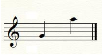
Abdal Havası Zeybeği Ses Genişliği