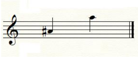
İki Parmak Zeybeği Ses Genişliği