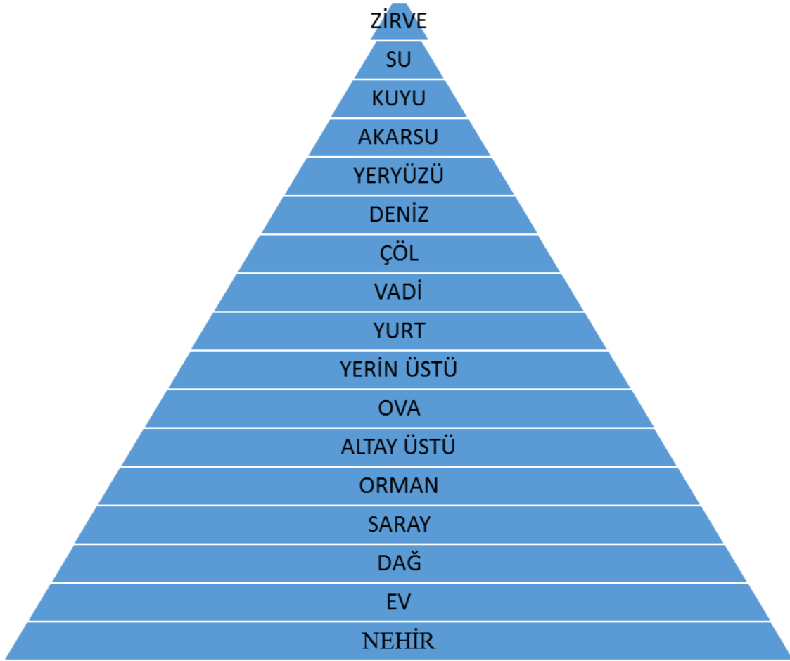
Şekil 2: Ösküs Uul Destanında Yer Alan Gerçek Mekânların Destandaki Kullanım Sıklığı.