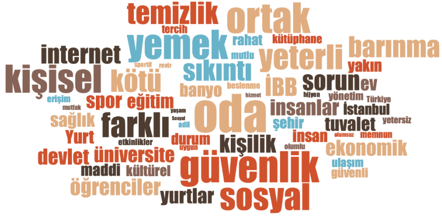
Görsel 2. En sık tekrarlanan ilk 60 kelimenin dağılımı

punto ile gösterilen kodlar katılımcıların daha sık tekrarladığı kelimeleri belirtirken, küçük punto ile gösterilen kodlar katılımcıların daha az kullandığı kelimeleri göstermektedir. Buna göre araştırmada katılımcıların sıklıkla oda, güvenlik, ortak, yemek, kişisel, sosyal, temizlik gibi kelimeleri sıklıkla kullanarak görüşlerini dile getirdikleri görülmektedir.