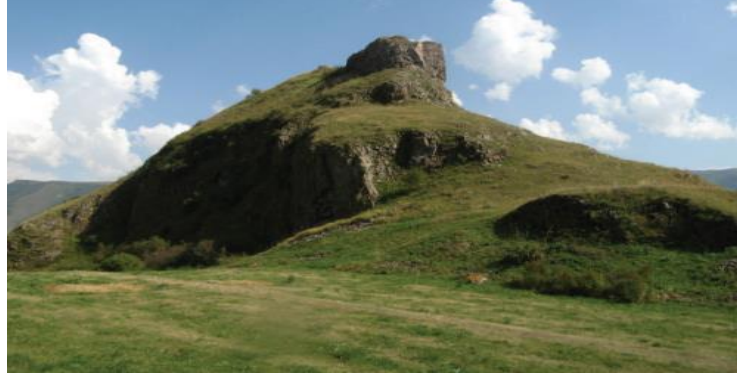
K'veli Köyü ve K'veli Kalesi'nin Güneybatı'dan görünümü: Kupatadze, a.g.m., s. 420.

Kale, Orta Çağ'da Güney Gürcistan'ın sur sisteminin bir parçasıydı ve stratejik bakımından önemli bir konumdaydı. 9-11. yüzyıllarda K'ueli (Gürcüce ყუელი) soylularının ikametgâhı olarak P'ots'kh'ov/Posof (Gürcüce ფოცხოვი)'un siyasi merkezi görevinde yerini korumuştur. Yani Kale, Orta Çağ'da Arsian ve Erusheti sırtlarıyla (Gürcüce არსიანისა და ერუშეთის ქედები) sınırlanan Saeristavo (Gürcüce საერისთავო) bölgesinin merkezi konumundaydı. Ayrıca Ts'urts'k'abi (Gürcüce წურწყაბი/Aşıkzülali), Vakhla (Gürcüce ვახლა), Saikhve (Gürcüce საიხვე), Agara (Gürcüce აგარა), K'veli (Gürcüce ყველი) yerleşim yerlerinin bulunduğu K'veli Vadisi (Gürcüce ყველის ხეობა)'nden geçen ana yolu kontrol ediyordu. Kale, Samtskhe (ფოცხოვის ხეობა/Potskhovis Kheoba)-Şavşat-Klarjet-Tao'yu birbirine bağlayan yolun merkezi üzerinde yer almaktaydı ve Kartli'den Şavşat'a giden en kısa geçiş buradaydı. 8