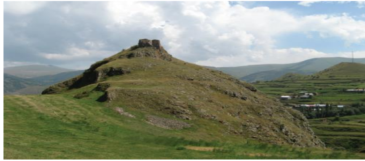
K'veli Köyü ve K'veli Kalesi'nin Batı'dan görünümü: Kupatadze, a.g.m., s. 420.

K'veli Kalesi, Çıldır ilçe merkezinin 19 km güneybatısında yer alan Kolköy'ün doğusundaki sarp tepe üzerinde yer almaktadır ve bu mevki aynı zamanda Kaleönü Köyü'nün de batısındadır. 6 Daha ayrıntılı biçimde ele alınacak olursa K'veli Kalesi, kalıntıların günümüz Ardahan'ın idari merkezi Posof'a 24 km uzaklıkta, Aşıkzülali (Tarihi adı Ts'urts'k'abi/Gürcüce წურწყაბი) köyünün batısında, 80 hanelik Kolköy (Tarihsel adı K'veli/ Gürcüce ყველი) köyüne 2 km uzaklıkta, P'ots'khovis ts'k'ali (Gürcüce ფოცხოვის წყლი, Türkçe Posof Çayı) Nehri'nin sol yakasındaki tepede yer almaktadır. Orta Çağ'da Gürcü yazılı kaynaklarında sıklıkla bahsedilen Kale, K'ala-Boin (Gürcüce ყალა-ბოინი) bölgesinde değil, Kolköy köyü yakınlarında bulunmaktadır. Kale, doğu/batı yönündeki dikdörtgen tepenin orta kesiminde bir burun üzerine inşa edilmiştir. Planı net bir şekilde bilinmese de öneminden dolayı Kale'nin büyük boyutta olduğu tahmin edilmektedir ve mevcut kalıntılara dayanılarak yeniden inşa edilen Kale'ye kuzey, güney ve doğu tarafından olmak üzere 3 taraftan ulaşım sağlanmamaktadır. Vadiden Kale'ye erişim ise batı taraftan sağlanmaktadır. Keskin doğal kaya oluşumları Kale'nin bütün çevresinin duvarlarla güçlendirilmesi ihtiyacını ortadan kaldırmıştır. 7