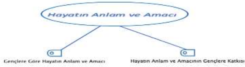
Şekil 1. Hayatın Anlam ve Amacı Temalar Gösterimi