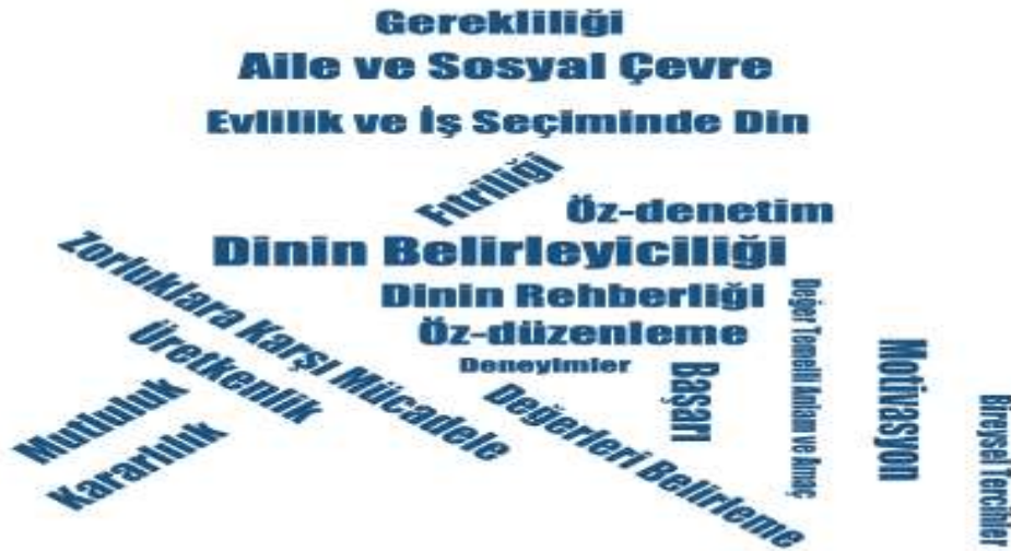
Şekil 6. Kod Bulutu

Bu kategoride katılımcıların çoğunluğu hayatı anlam ve amaç ekseninde yaşamının kişinin mutlu ve huzurlu olmasında önemli katkısı olduğunu belirtmişlerdir.