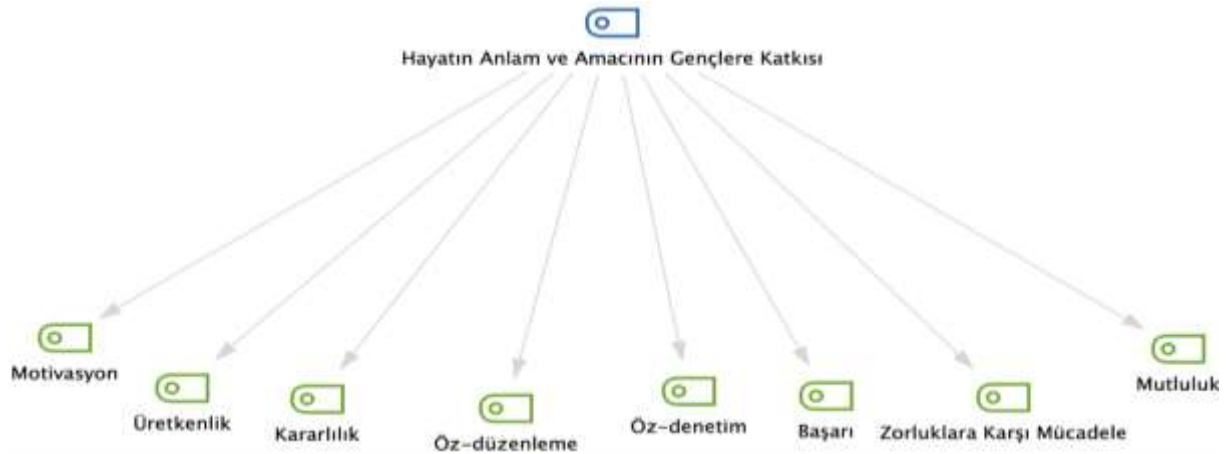
Şekil 5: Hayatın Anlam ve Amacının Gençlere Katkısı Temasına Ait Hiyerarşik Kod Alt Kod Bölümler Modeli

Çalışmanın ikinci teması “Hayatın Anlam ve Amacının gençlere Katkısı” olarak belirlenmiştir. Bu tema motivasyon, üretkenlik, kararlılık, özdenetim, öz-düzenleme, başarı, zorluklara karşı mücadele ve mutluluk olmak üzere sekiz alt temadan oluşmaktadır.