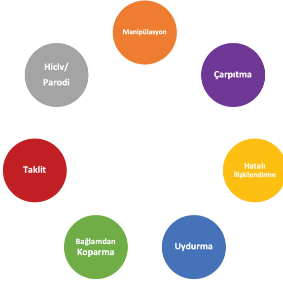
Şekil 1. Sıklıkla Başvurulan Dezenformasyon Türleri (Wardle ve Derakhshan, 2017)