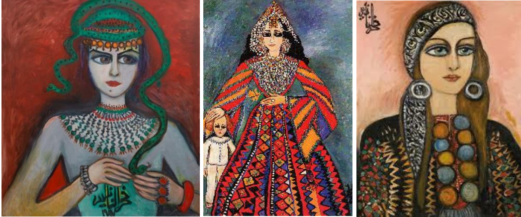
Görsel 11. Yılanlı Kadın , 130 x 120, Tuval Üzerine Yağlıboya, 1985

Fahrelnisa, portrelerinin bir kısmında bazı sembolleri kullanmıştır. Bunlar arasında en önemlisi Doğu ve Bizans'ı temsil eden öğelerdir. Bizans resminde özellikle aydınlığı da temsil etmesi açısından sıklıkla kullanılan sarı renk Fahrelnisa'nın resminde de sıklıkla kullanılmıştır. Fahrelnisa doğu ve Bizans birlikteliğini, geleneksel motiflerle ustaca bir araya getirmiştir. Takı ve kıyafetlerdeki süsleyici unsurlar, yılan gibi sembolik tasvirler son dönem portrelerinin dikkat çekici unsurlarıdır (Görsel 11, Görsel 12 ve Görsel 13).