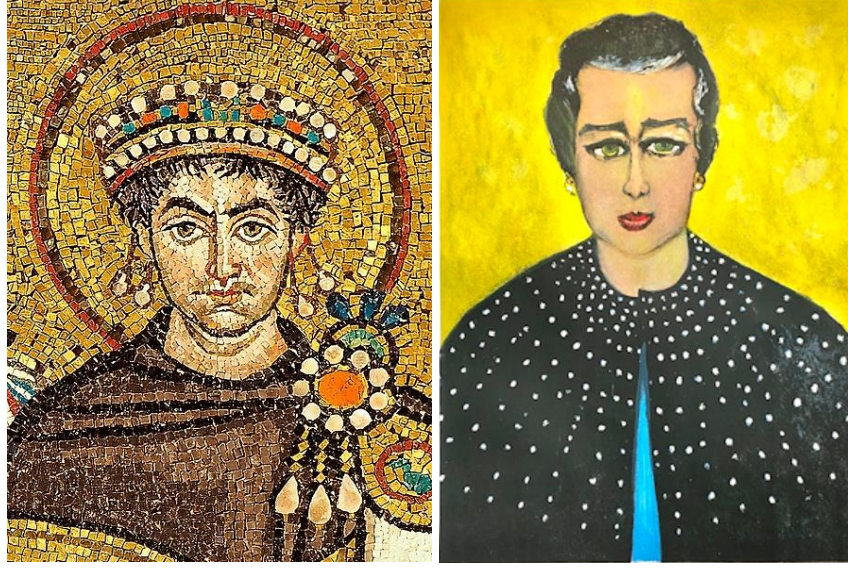
Görsel 7. Justinianus Mozaïği, Ravenna Kilisesi, İtalya, 6. yy.