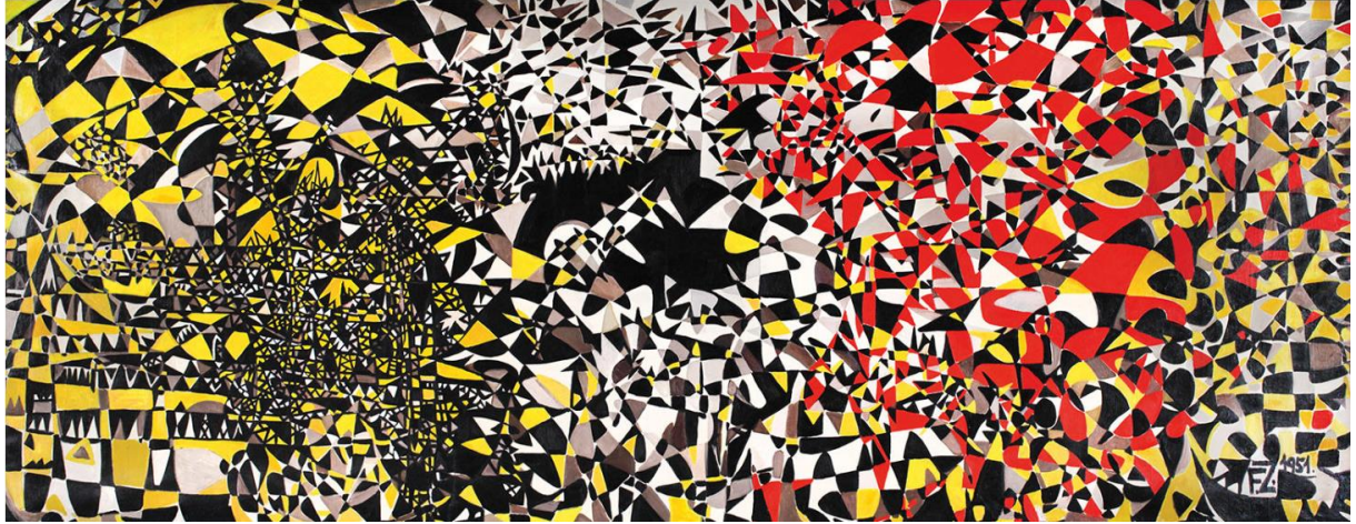
Görsel 2. Cehennemim, Tuval Üzerine Yağlıboya, 205 x 528, 1951