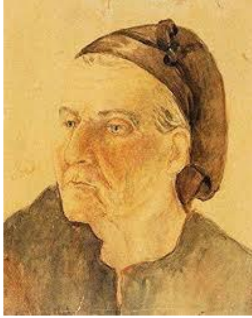
Görsel 3. Fahrelnisa Zeid'in Büyükannesinin portresi, Tuval Üzerine Yağlıboya, 25x21, 1915

(Kaynak: Laïdi-Hanieh, A. (2017). Fahrelnisa Zeid- İç Dünyaların Ressamı . İstanbul: Res Yayınları)