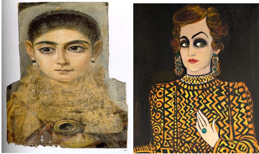
Görsel 5. Fayyum Portrelerinden Bir Örnek, M.S. 1. ve 3. yy. 'lar

Mısırlılar gibi ölülerini mumyalamaya başladı. Ardından gelen Romalılar ise mumyalamanın yanı sıra ölülerin yüzlerine kendilerinin iki boyutlu masklarını yerleştirmişlerdir (Ekici, 2013, s. 29). Bu medeniyetten kalan ve günümüze gelmiş en eski yağlıboya portreleri Dört İncil yazılırken yapılmış Fayyum Portreleri' dir. Geçen yüzyılda Mısır'daki Fayyum Eyaletinde bulunduğundan bunlara bu isim verilmiştir. Mumya portreleri, Mısır'ın her yerinde özellikle Fayyum Vahası' nda bulunan yerleşimlerde bilhassa Antinoeopolis'te bulunmuştur. Bu portreler 1. yy. ve 3. yy.'dan kalma portrelerdir (Berger, 2018, s. 30-31). Nekropollerde (mezarlıkların ve toplu mezar yerlerinin bulunduğu alan) bulunan bu eserler mumyaların iştirilmek suretiyle yapılan eserlerdir. Yaklaşık 1000 adet olan bu portreler ahşap panolar halinde ölen kişinin başına iştirilmiştir (Borg, 2019, s. 1) (Görsel 5). Fayyum Portreleri ile Fahrelnisa'nın son dönem portreleri arasında biçimsel benzerlikler olduğundan söz edilebilir (Görsel 5 ve Görsel 6). Öyle ki bu portreler, gözlerin tüm portredeki oranı ile burun ve dudakların şekli bakımından benzerlikler taşımaktadırlar.