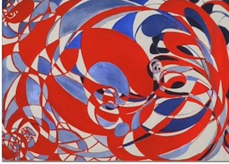
Görsel 1. Soyut Kompozisyon, Tuval Üzerine Yağlıboya, 130x182cm, 1960.