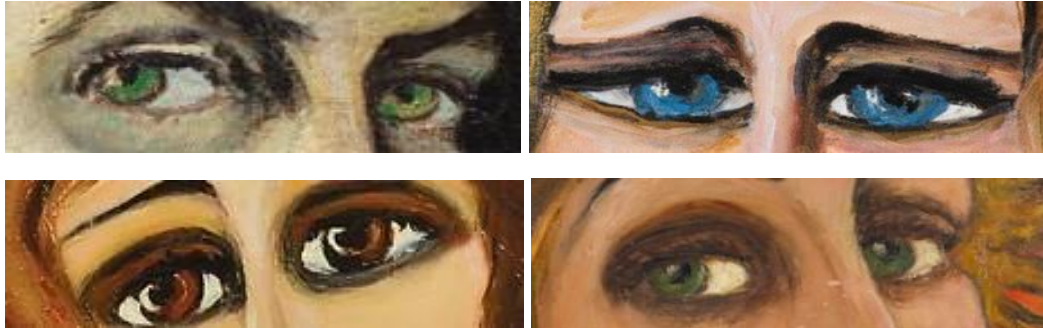
Görsel 9. Fahrelnisa Zeid'in Portrelerinden Göz Örnekleri

Yukarıda solda resimde Justinianus'un mozaikten portresi dururken sağda ise Fahrelnisa Zeid'in Rosa Larock'un Portresi isimli çalışması durmaktadır (Görsel 7 ve Görsel 8). Resimlere yine dikkatli bakılacak olursa; portre resimde olması gereken ölçülerden farklı bir ölçü görülebilir. Özellikle gözlere odaklı; başka bir deyişle gözlerin stilize edilip büyükçe çizildiği aynı zamanda göz yuvarlaklarında hüznün temsili bulunmaktadır. Dudakların ise resimlerde benzer şekillerde çizildiği görülmektedir. Çoğu kez çok da büyük olmayan ve sadece temsili olsun diye çizildiğini düşündüren; içeriye büzülmüş dudaklar bakımından da yine soldaki Justinianus resmi ile benzerlikler taşımaktadır (Görsel 9 ve Görsel 10).