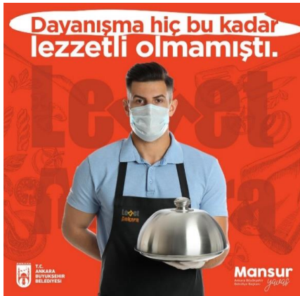
Şekil 1. Lezzet Ankara'nın Sosyal Medya Hesaplarından Paylaşılan Görsel (Kaynak: Lezzet Ankara Sosyal Medya Hesabı)