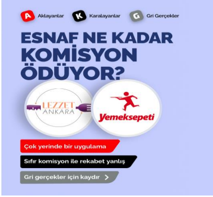
Şekil 2. Lezzet Ankara'nın Kamuoyunda Neden Olduğu Tartışma Aksları

Söz konusu tartışmalar ilk olarak, Yavaş ve Aydın arasındaki polemği andıran biçimde, kamu ve özel sektör arasındaki rekabet vurgusu üzerine kurulmuş; Lezzet Ankara ve Yemeksepeti arasındaki rekabet vurgusu, bu tartışmaların temelini oluşturmuştur (Aşık, 2021; Gritv.net, 2021; Sosyal-ParaAnaliz, 2021).