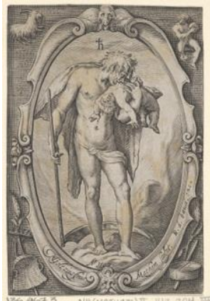
Kaynak: (Görsel 4, Jacob Matham- “Satürn” Gravürü, (1597), Tabaka 4 1/4 x 2 7/8 inç. (10,8 x 7,3 cm), www.metmuseum.org , 2024).