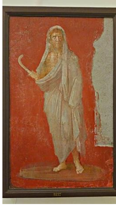
Kaynak: (Görsel 1, “Saturn” Freski, Napot Arkeoloji Müzesi, Envanter Numarası 8837, www.pompeiiinpictures.com , 2024).