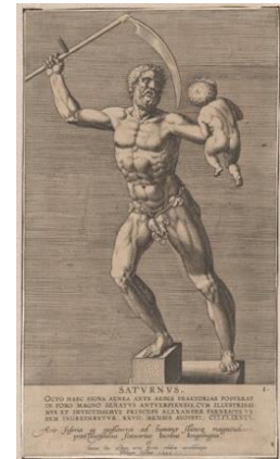
Kaynak: (Görsel 5, Philips Galle – “Satürn” Gravürü, (1586), Tabaka (Kesilmiş): 11 3/16 x 6 5/16 inç. (28,4 x 16 cm), metmuseum.org , 2024).