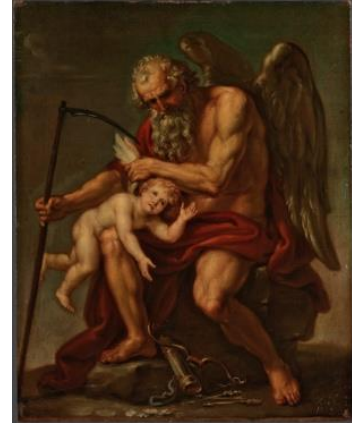
Kaynak: (Görsel 2, Ivan Akimov- Aşk Tanrısının Kanatlarını Tırpanla Kesen Satürn, (1802), 44,5 x 35,5 Yağlı Boya Tuval, Moskova Devlet Tretyakov Galerisi, https://my.tretyakov.ru/app/masterpiece/10456 , Envanter numarası 78, 2024).