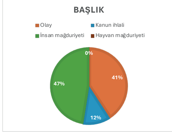
Grafik 1: Haber başlıklarının kategorilere dağılımı

Haberde başlığın sınırlı alanından sonra ilk açılımı yapan unsur spottur. Çok genel yaniyla haberi bir-iki cümlede özetleyen veya haberdeki en dikkat çekici unsuru aktaran, gövdeye göre yazı puntosu daha büyük tutulan bu kısım da başlıktan sonra haberi okumaya devam eden okuyucuyu karşılayan ikinci basamaktır. Burada içerikle ilgili haber başlığının taşıdığı mesajın daha fazlası vardır. Spot, haber içeriğiyle ilgili başlıkta oluşmaya başlayan okuyucu tutumunun biraz daha belirginleştiği kısımdır. Araştırmada örnekleme giren 120 haberin 79 tanesinde spot kullanıldığı tespit edilmiştir. Tablo 1 ve Grafik 2'de göze çarpan ilk sonuç, spotların hiçbirinde hayvan mağdu- riyetine ve Hayvanları Koruma Kanunu'ndaki maddelerin yerine getirilmediğine ilişkin bir içeriğin bulunmadığıdır. %46,8 oranında insan mağduriyetine flaş tutan spotların kalanısa olayı aktaran cümlelerden ibaret kalmıştır. Ha- ber spotlarında olayı aktarmayı en fazla %35,4 ile T24 internet sitesi tercih etmiştir. İnsan mağduriyetin ön plana çıkardığı spotlar ise her üç yayında da birbirine yakın sayıdadır.