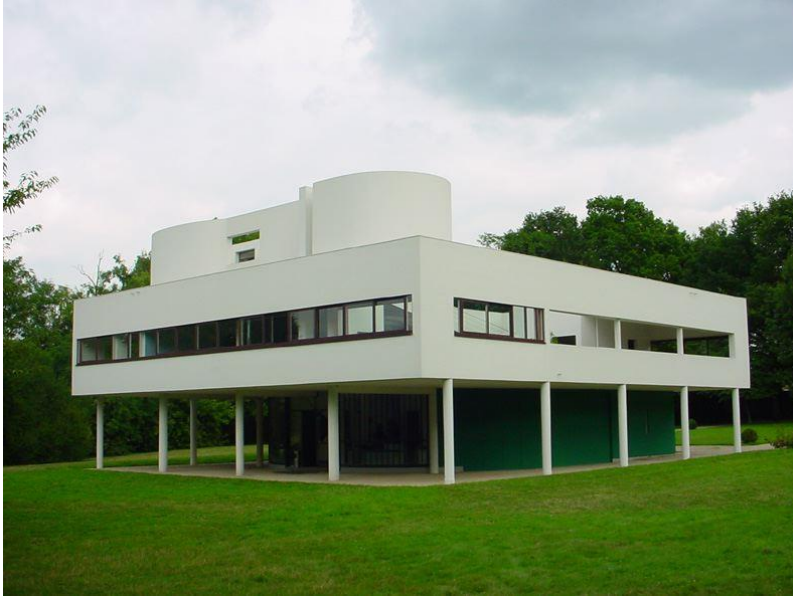
Şekil 1. Villa Savoye (Wikipedia, 2001)

detaylı ele alınacağı üzere, Roark'ın tasarımları düz çatıları, sade ve yalın cepheleri, katmanlı dikdörtgen formları ile modern mimarlığın temel ilkelerini yansıtır biçimdedir (Şekil 2).