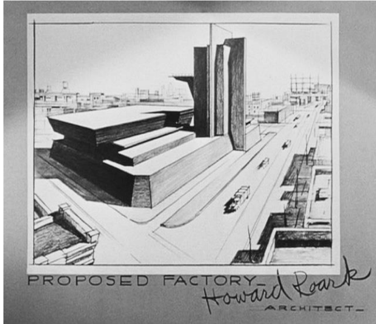
Şekil 2. Roark'ın bir fabrika yapısı için önerdiği modernist bir tasarım (The Fountainhead filminden mimarın çizimlerinin gösterildiği sahne)