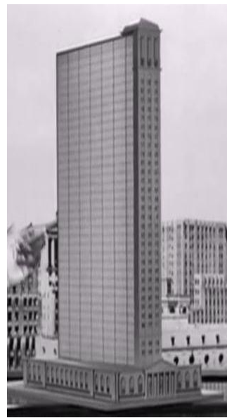
Şekil 5. Banka yöneticileri tarafından yeni ekler eklenen maket (The Fountainhead filminden mimarın çizimlerinin gösterildiği sahne)