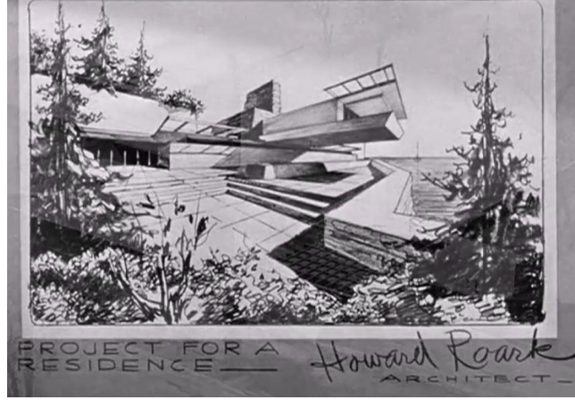
Şekil 3: Filmde, Howard Roark'ın bir rezidans projesi için çizimi (The Fountainhead filminden mimarın çizimlerinin gösterildiği sahne)

one (Form ve işlev birdir)' ifadesinin bir benzeridir. Mesleki anlayışını bu temele dayandıran Howard Roark, modern duruşu sadece mimari üzerinden değil ideolojik bir duruş olarak da sergiler. Toplum tarafından dışlanmasına sebep olduğu halde, yapılarını estetik kaygılara ve dönemin toplumsal beğenilerine göre değil, yapının işlevine uygun bir sadelik içinde tasarlar ve gelen eleştirilere rağmen, kendi inandığı biçimde yapılar yapmaya devam eder. Böylece Howard Roark, modern mimarlığın yenilikçi ve kararlı duruşunu simgeler.