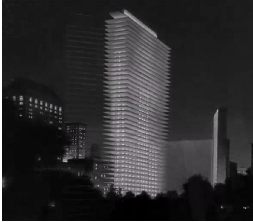
Şekil 6. Enright Evi. (The Fountainhead filminden mimar Howard Roark'ın özgün bir tasarımının gösterildiği sahne)

Bu sırada The Banner gazetesinin, yeni bir gündem oluşturması yani kitleleri arkasına alıp bir saldırıya geçmesi gerekmektedir. Saldırı başlatacak bir konu bulmakta zorlanan gazete yöneticileri için Roark'ın yeni tasarımı, onlara istediklerini verir. Roark'ın orijinal, kendine özgü ve eşi benzeri olmayan tasarımı üzerine derhal bir protesto başlatırlar. Protestonun sebepleri, bu tasarımın, yeni yapısal yöntemler kullanılarak oluşturulması, kamuyu tehdit etmektedir ve 'süper lüks' olan bu konut projesi için harcanan kaynaklar heba edilmektedir. Varoşlarda oturacak ev bulamayan insanlar için bu bina adeta israflığın, bencilliğin bir sembolüdür. Yapının mimarı, halkı değil, kendini düşünür ve bu yüzden ona savaş açmak her kentlinin sorumluluğudur. The Banner bu söylemler ile halkı galeyana getirip istediğini almıştır. Yapının açılışı için verilen kutlamada, davetlilerin her biri aslında yapıyı beğenir ama dile getirirken asla böyle bir yerde yaşamayı tercih etmeyeceklerini, Roark'ın meslektaşları ise, yapıda beğendikleri unsurlar olduğunu ve bunları 'uyarlayarak' kullanabileceklerini söylerler. Bu protestodan etkilenmeyen Roark için ise, önemli olan tasarımın kendi çizdiği şekilde hayata geçmiş olmasıdır.