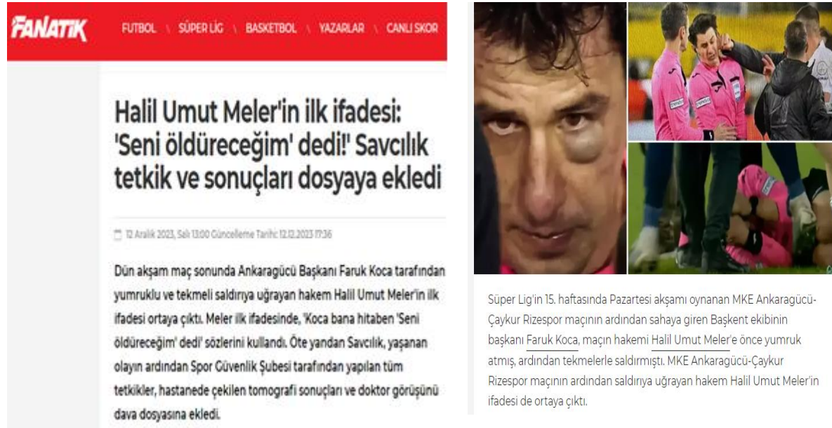
Görsel 1: Fanatik Gazetesi'nden seçilen haber 1

Haberin ilk önce başlığı ele alındığında, iki nokta üst üste, ünlem ve tırnak işareti ve benzeri noktalama işaretlerinin kullanıldığı görülmektedir. Bu işaretler genellikle başlığı daha ilgi çekici hale getirmek için kullanılmaktadır.