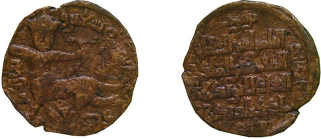
Resim 1: Mardin Müzesi 5309 Envanter numaralı Centaur/kentarus figürlü sikke.