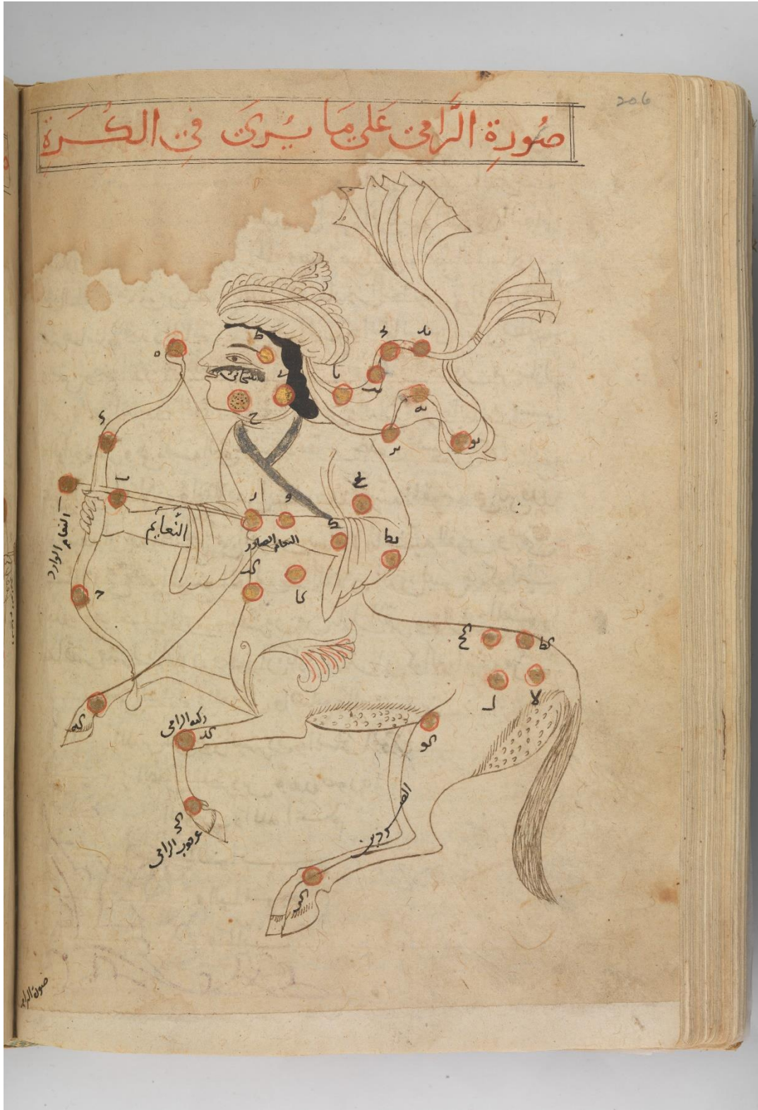
Resim 5 : Es Sufi'nin Sabit Yıldızları adlı yazma eserinde yer alan centaur/kentaruslar. Erişim Tarihi: 15.11.2024.