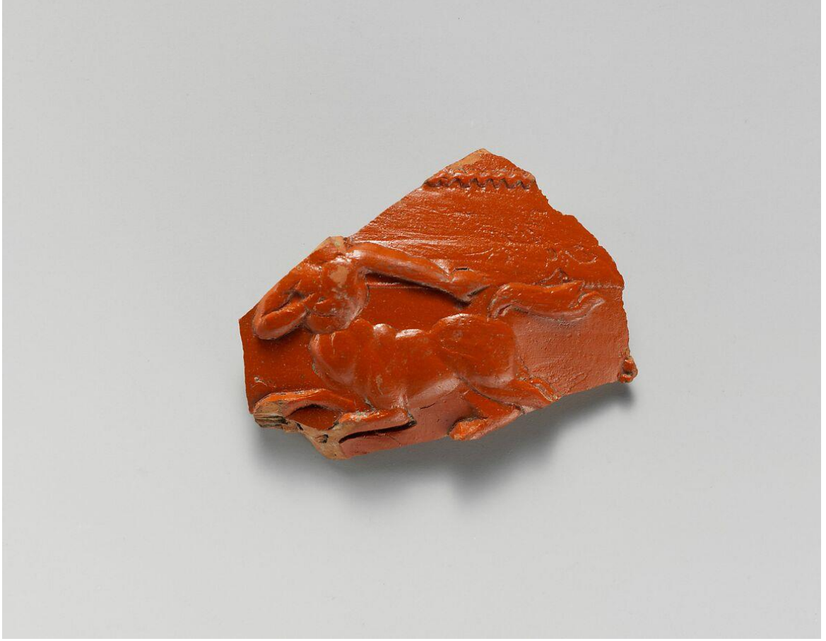
Resim 3: Roma döneminde Pişmiş Toprak üzerine kalıp olarak uygulanan (terracotta) centayur/kentarus figürü. ( https://www.metmuseum.org/art/collection/search/250470 ) Erişim Tarihi: 15.11.2024.