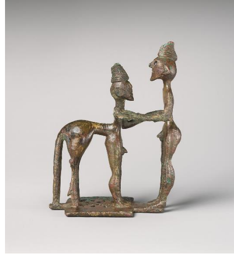
Resim 2: Antik Yunan döneminde seramik üzerine uygulama ve madeni eser olarak üretilen centaur/kentarus figürleri. ( https://www.metmuseum.org/art/collection/search/253582 ) Erişim Tarihi: 15.11.2024.