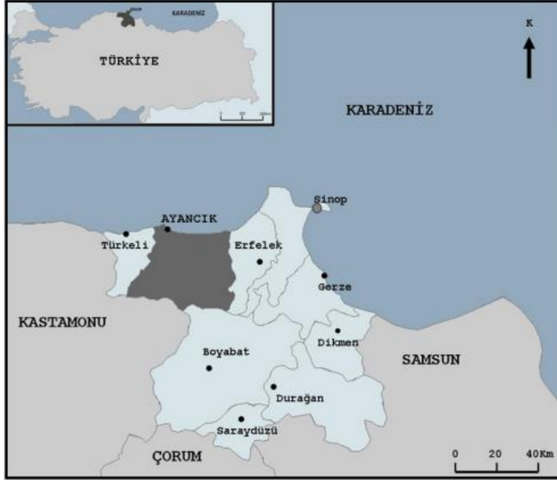
Şekil 1. Ayancık Haritası

Sinop ili sınırlarında Ayancık Çayı Havzasında yer alan Ayancık, konum olarak 41^{\circ} 35' - 41^{\circ} 65' kuzey paralelleri ile 34^{\circ} 20' - 34^{\circ} 45' doğu meridyenlerine denk gelmektedir (Esen, 2022: 235). Sinop şehir merkezine 55 kilometre uzaklıkta bulunan İlçenin, Karadeniz'e kıyısı bulunmaktadır. Erfelek, Türkeli ve Boyabat ilçeleri ile sınırları bulunan Ayancık, güneyde aynı zamanda Kastamonu ile komşudur ( http://www.ayancik.gov.tr/cografı-yapısı ).