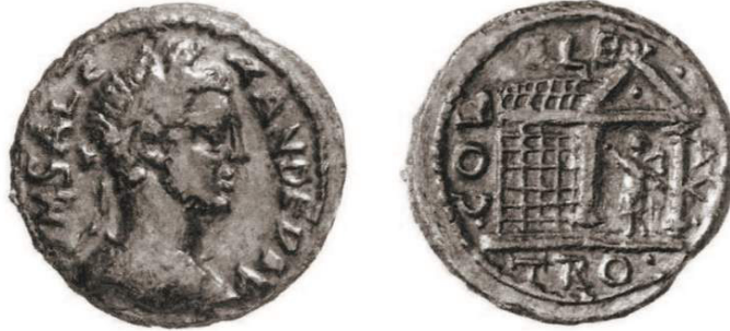
Resim 3b. Alexandria Troas Sikkesi, AE, MS 222-235 (İmp. Severus Alexander).