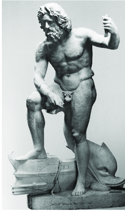
Resim 5. Lateran Poseidon, Vatican Müzesi, MS 160 (Katsonopoulos 2017, 23, Fig. 5).