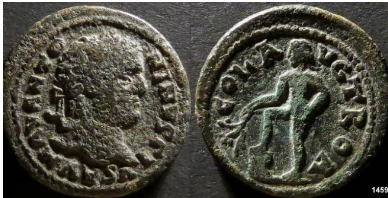
Resim 4. Alexandria Troas Sikkesi, AE, (İmp. Caracalla). ( https://www.wildwinds.com/coins/ric/caracalla/_alexandriaTroas_Lindgren_A334A.jpg )