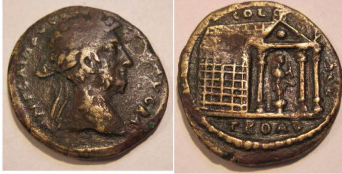
Resim 3a. Alexandria Troas Sikkesi, AE, MS 184-192 (İmp. Commodus).