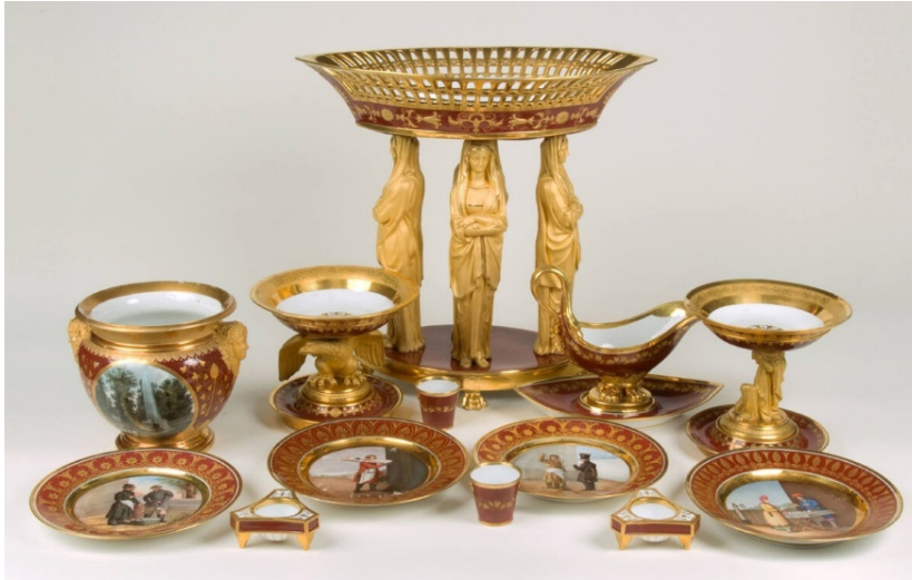
Görsel 6. Guryev Servis takımı, 1809-1816, Sır üstüne yıldız boyama, İmparatorluk Porselen Fabrikası.