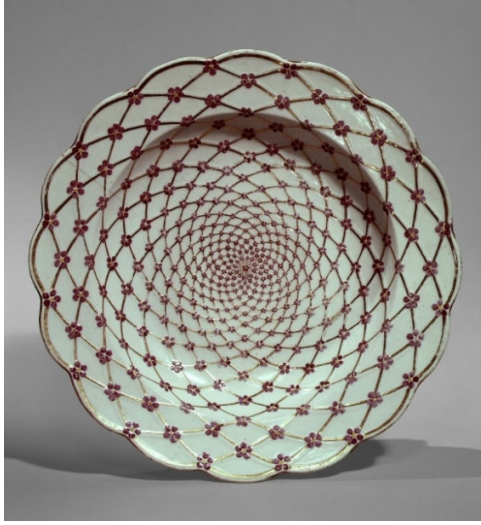
Görsel 3. İlk Tatlı servisi, 1755-1760, İmparatorluk Porselen Fabrikası, 25,7 cm, Metropolitan Museum.