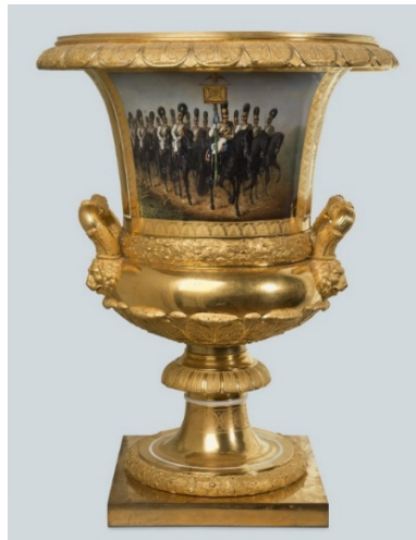
Görsel 5. Askeri Sahne Dekorlu Vazo, 1830, İmparatorluk Porselen Fabrikası, Yak. 75 cm, St. Petersburg, Rusya.

Saray vazolarının üretimi I. Nicolas döneminde gelişim gösterirken takı kutuları, paskalya yumurtaları gibi porselen eşyalar diplomatik hediyeler olarak kullanılmakta ve Avrupa'nın kraliyet evlerine gönderilmektedir. Klasik dönemde özellikle dikkat çeken anıtsal krater vazoları önemli bir yere sahiptir. Vazoların ön yüzünde saray askerleri tasvir edilmekte ve arka planda Rusya ve hediye edilen ülkenin armaları yer almaktadır. Ulusal kazanımları ve sarayı tasvir eden dekoratif boyamalar, kışlık saraydaki olağanüstü lüks yaşamı ve 1812 yılındaki vatanseverlik savaşındaki cesareti simgeler. Söz konusu vazo koleksiyonu Feberge Müzesi'nin özel bölümünde sergilenmektedir. Askeri sahneler İmparatorluk porselen fabrikası kurulduğu zamandan 20. Yüzyıla kadar varlığını hep göstermiştir (Görsel 5). 1830 yılında I. Nicolas tarafından Fransa'nın Rusya Büyük elçisi olan Mortemart Dükü Casimir-Louis-Victorien de Rochechouart'a askeri konulu dekorlar ile boyanmış vazolardan biri hediye verilmiştir ( www.fabergemuseum.ru ).