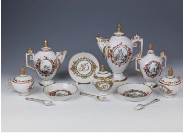
Görsel 1. Porselen Çay Servis takımı, 1768, 18,6x19,6x11,6 cm; 5,2x5 cm, İmparatorluk Porselen Fabrikası, St. Petersburg, Rusya.

Avrupa pazarında, rokokonun büyüleyici dünyasıyla iç içe geçen porselen sanatı, Fransız aristokrasinin zevkli eğlenceleri, lüks süslemeleri ile önemli bir yer edinmiştir (Halıcı ve Yurttaş, 2022). Yemek servis takımlarındaki gibi; kullanılan altın yıldızlı dekorlar ince çizgiler halinde zarif bir biçimde uygulanmıştır (Görsel 1).