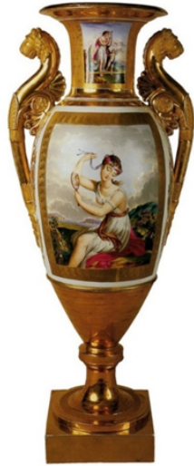
Görsel 4. Vazo, 1829, Franz Gardner Fabrikası, Yükseklik: 74,5 cm; çap: 31.5cm; genişlik: 23,8 cm, Mitolojik kompozisyonlar, Aynalı Venüs ve Yanan Alevli İlham Perisi Erato ve Aşk Tanrısı.

Vazolar, I. Nicolas saltanatı zamanından itibaren fabrikada özel bir öneme sahiptir. Klasik dönemde altın en sevilen eşya haline gelmiştir. Vazo üzerindeki resimlerde mitolojik hikayeler, manzaralar, gündelik yaşam kesitleri ve savaş sahneleri minyatür biçimde bezemeler belirgin bir şekilde yer almaktadır ( www.ipm-jsc.com ).