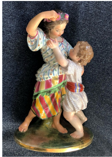
Görsel 8. August Spiess, Elmalı Çocuklar , İmparatorluk Porselen Fabrikası.

Paskalya yumurtalarının ardından August Spiess'in ürettiği figüratif heykeller, 1849'dan itibaren önem kazanmaya başlamıştır (Görsel 8). Porselen sır üstü ve sır altı boyamalarında yeni yöntemler keşfeden Spiess, farklı ideolojik yaklaşımların hem geleneksel kültürü yansıttığını hem de sanatın estetik kaygılarını ortaya çıkardığını göstermiştir. Altın çağ olarak adlandırılan Neoklasik dönem, Rusya'da gelenekten koparak daha entelektüel aydın bir toplumun varlığını göstermektedir. Sanat artık sadece zanaat olarak değil, gündelik yaşamı farklı bir bakış açısıyla zenginleştirmesine olanak tanımıştır. Romantizmin etkisiyle sanata yönelim ve mekânsal dağılımı güçlü bir efsane yaratma arayışına dönüşmüştür.