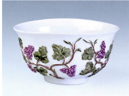
Görsel 2. Dmitry İvanovich Vinogradov, Kase, 1749.

1710'da Meissen ve 1718'de Viyana'da kurulan ilk Avrupa porselen fabrikaları, Çin porselenini taklit ederek üretimlerine başlamıştır. Rus Çarı Büyük Petro, Avrupa ziyaretleri sırasında Avrupa'daki gelişmelerden etkilenerek Rusya'da bir porselen fabrikası kurma arzusu taşımış ve yurt dışından getirttiği hammaddelerle üretime geçmiştir ( www.hermitagemuseum.org ). Porselen fabrikası kurma hayalini henüz gerçekleştirilmeden vefat eden Büyük Petro, kızı İmparatoriçe Elizabeth 1744 yılında, Neva Nehri kıyısında bir porselen fabrikası kurulması için Baron Cherkasov'u görevlendirir. Stockholm'den Rus Porselenlerine katkıda bulunması için Christoph Conrad Hunger'ı St. Petersburg'a davet eder. Hunger, uzunca bir süre fabrikada çalışmasına rağmen deneylerden olumlu sonuçlar alamaz ( www.ipm-jsc.com ).