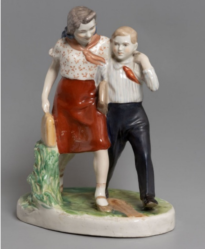
Görsel 12. Kazimir Rizhov, Okul yolunda , 1936-45, yükseklik 23,5 cm, tabanı 19,3x12 cm.

1930'larda el sanatları ve sanat endüstrisi hızla gelişmiştir. Rusya'da sanatçılar için deneysel sanat laboratuvarları ve geleneksel sanatın korunmasına katkıda bulunan kurumlar, aynı zamanda devlete hizmet veren yerlerdir. Üretilen eserler dünya çapındaki önemli sergilerde yer alarak sanatçılara prestij kazandırmıştır. 1930'ların ikinci yarısından itibaren Sovyet porselenleri, kendine özgü modern tasarımlar çizip ve sonrasında modellemiştir. 20. yüzyıldaki porselenler, geleneksel birikimle birlikte çeşitli yaratıcı dekorlarında günlük yaşamdan esintiler taşımaktaydı (Görsel 12). 1930 yılından sonra standardizasyon süreçlerine rağmen dekor ve tekniklerde belli bir düzen oluşmaya başlamıştır. Sovyet döneminin eserlerinde sanatçının bireysel yaratıcılığı ön plandaydı (Коновалова, т.у., s. 257).