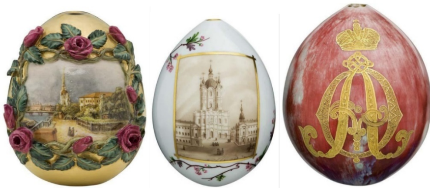
Görsel 7. Paskalya yumurtaları, 1840-1917, St. Petersburg, Feberge Museum.