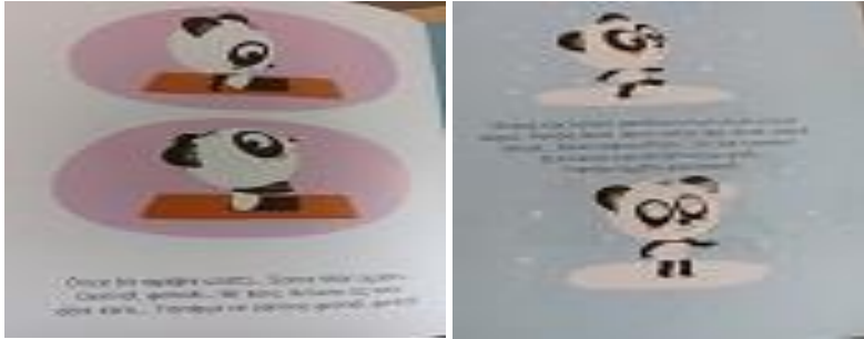
Resim 9. K8 Kodlu Kitaptan Örnek Resimler (Kaynak: Nelman, L. & Manes, T. (2020). Panda Huzurlu ve Mutlu, 1001 Çiçek Yayınevi).

cümleleriyle öykünün kahramanı panda yaptığı fiziksel aktivitelerle duygu durumunun olumlu yönde etkilendiğini bize anlatmaktadır.