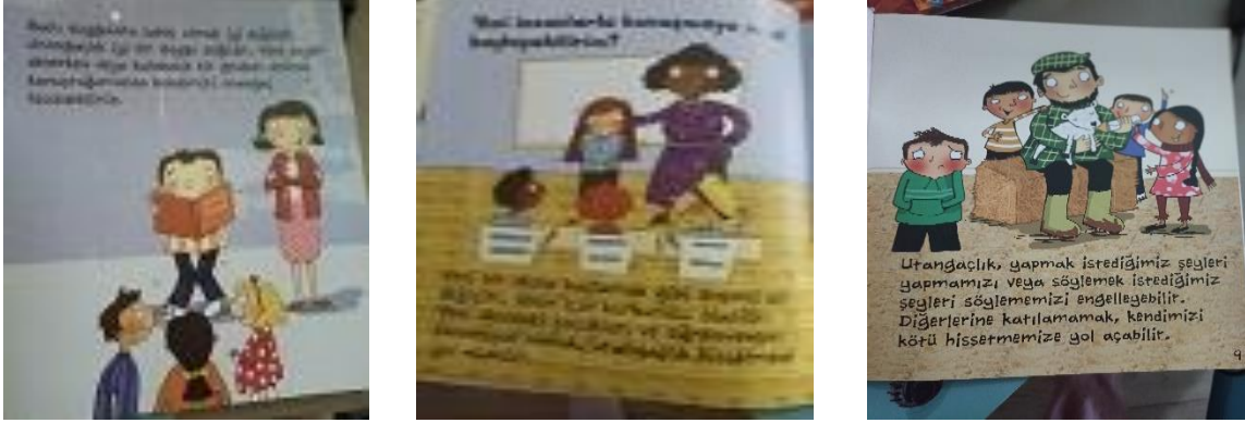
Resim 1. K12 Kodlu Kitaptan Örnek Resimler (Kaynak: Thomas, I. (2017). Utangaç, 1001 Çiçek Yayınevi).

cümlelerle öyküdeki karakteri kıskançlık duygusunu nedenleriyle tasvir edilmektedir. Bu durum bu duygunun anlaşıldığını bize göstermektedir.