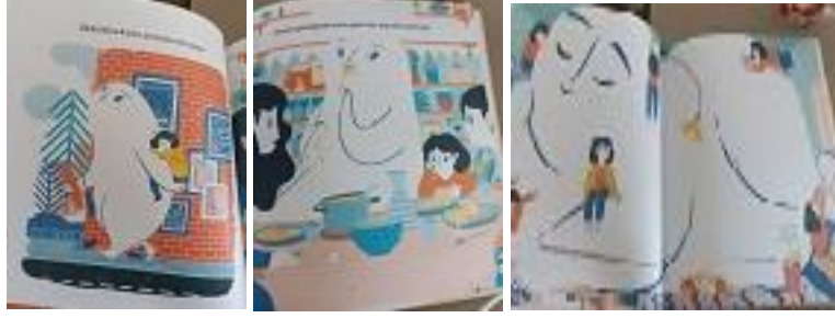
Resim 5. K7 Kodlu Kitaptan Örnek Resimler (Kaynak: Sanna, F. (2018). Arkadaşım Korku, Taze Kitap).

K7’de kitabın kahramanı korku duygusunu somutlaştırarak gözle görülür bir varlığa dönüştürmüştür ve öykü boyunca kendisine eşlik eder. Çocuğun korkularının şiddetine göre kimi zaman büyür kimi zaman küçülür.