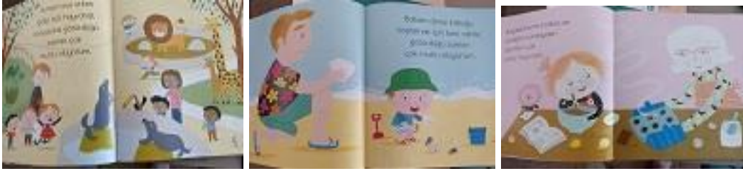
Resim 3. K5 Kodlu Kitaptan Örnek Resimler (Kaynak: Grimault, H. (2020). Mutluyum, 1001 Çiçek Yayınevi).

K13’de ‘Mutluyken güler zıplar oyunlar oynarsın onu herkesle paylaşmak istersin. Hüznünlüysen yalnız kalmak ister bir köşeye çekilirsin bir şey yapmak gelmez içinden Öfkeliysen haksızlığa uğradığını düşünür hıncını başkasında çıkarmak istersin. Korktuğunda küçülür silikleşirsin senden beklenen hiçbir şeyi başaramayacağını sanırsın’ cümlelerinde duygu durumlarının kendisinde yarattığı etkilere ilişkin konuşulduğu görülmektedir.