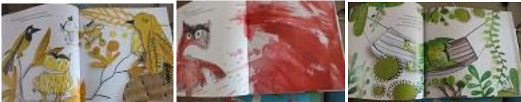
Resim 4. K13 Kodlu Kitaptan Örnek Resimler (Kaynak: Llenas, A. (2019). Renk Canavarı, Nesin Yayınevi).

K5 geçen görsellerde görüldüğü üzere öykünün kahramanı kendisini mutlu eden durumlardan bahsederken (annesiyle hayvanat bahçesine gitmekten, babasıyla kumsalda oynamaktan büyükannesiyle kek yapmaktan) yüz ifadesinden mutlu olduğu açıkça görülmektedir.