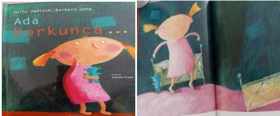
Resim 11. K1 Kodlu Kitaptan Örnek Resimler (Kaynak: Janisch, H. (2021). Ada Korkunca, Yapı Kredi Yayınları).

K2’de ise ‘Sabah olduğunda artık üzgün hissetmiyorsan merak etme. İkiniz içinde yeni bir gün başlar.’ cümleleri üzüntü duygusunun değiştiğinin açıkça göstermektedir.