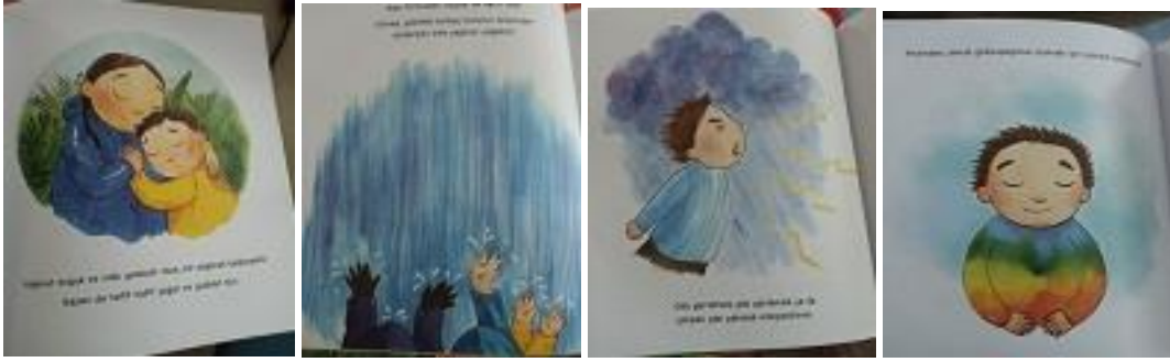
Resim 6. K9 Kodlu Kitaptan Örnek Resimler.

K7’de kitabın kahramanı korku duygusunu somutlaştırarak gözle görülür bir varlığa dönüştürmüştür ve öykü boyunca kendisine eşlik eder. Çocuğun korkularının şiddetine göre kimi zaman büyür kimi zaman küçülür.