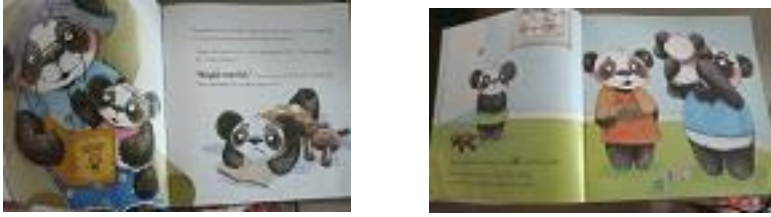
Resim 2. K6 Kodlu Kitaptan Örnek Resimler (Kaynak: Gassman, J. (2019). Kardeşini Kıskanan Nena, 1001 Çiçek Yayınevi).

K12'de görülen görsellerde çocukların topluluk karşısında konuşma yaparken veya yeni bir ortama girdiklerinde utanma duygusunu açıkça yaşadıkları yüz ifadelerinde (yüzde kızarma ve tedirginlik) ve vücutlarının duruşunda (elleri saklama, içe kapalı duruş) açıkça görülmektedir.