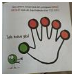
Resim 10. K15 Kodlu Kitaptan Örnek Resim (Kaynak: Alber, D. (2021). Öfkeli Nokta, Beta Kız).

K8'de yer alan görsellerde öykünün kahramanı panda kendisini rahatlatmak için çeşitli egzersizler ve nefes aktiviteleri yapmaktadır.