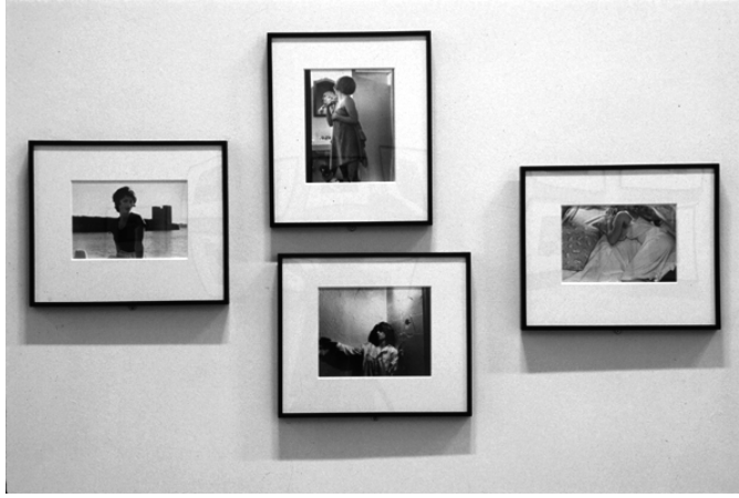
Görsel 2. Cindy Sherman, Başlıksız Film Kareleri (Untitled Film Stills) , 1977-1980, 25,4x20,3 cm, Jelatin üzerine gümüş baskı