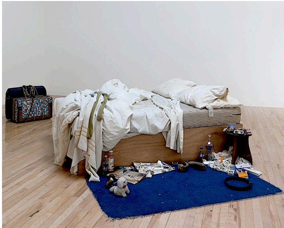
Görsel 3. Tracey Emin, Yatak (My Bed) , 1998, Enstalasyon. Kutu çerçeve, şilte, çarşaf, yastıklar ve çeşitli nesnelere, genel teşhir boyutları değişkendir, TATE

Tracey Emin'in çalışmalarında kişisel deneyimlerin ve bedenin yoğun bir şekilde sanata dönüştürülmesi, sanatçının içsel dünyasını dışa vurmasına olanak tanırken, Lorna Simpson'un çalışmaları; kimlik, ırk ve toplumsal eşitsizlik temalarını