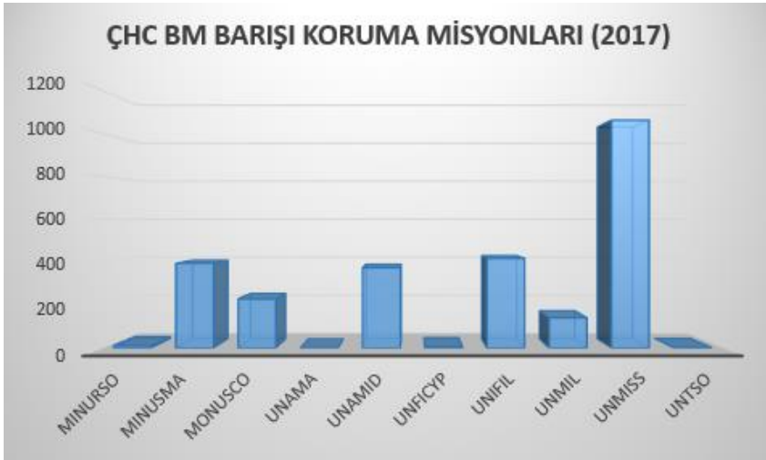
Tablo-2: ÇHC 2017 yılı itibarıyla BM Barışı Koruma Misyonlarına Katılım Durumu

barışı koruma misyonlarına Çin tarafından görevlendirilen personel miktarları görülmektedir. Tabloda dikkati çeken en önemli husus Çin askeri birliklerinin Güney Sudan'daki misyona (UNMISS) vermiş olduğu yoğun destek olmaktadır. Söz konusu barışı koruma misyonlarının büyük çoğunluğu Afrika Kıtası'nda yer almakta ve bu durum Çin-Afrika ilişkisinin boyutunu gözler önüne sermektedir. Tablo-2'de genel hatlarıyla verilen Çin'in katıldığı barışı koruma harekâtlarına ayrıntılı biçimde göz atmak bu ülkenin BM barışı koruma operasyonlarına yaptığı katkıyı anlamak bakımından yerinde olacaktır.