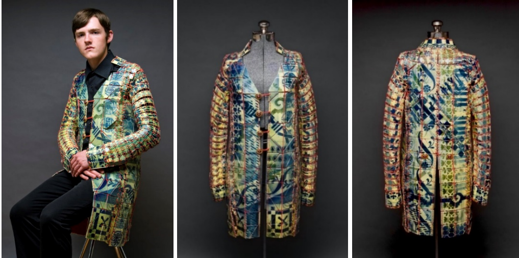
Görsel 1. Shae Bishop, "Palto (Coat)", Porselen, sıraltı, sır, altın cila, pamuk ip, kanvas, 97 x 46 x 23 cm, 2011 Fotograf: Jim Walker ( http 6).

2012 yılında tamamladığı lisans eğitimi sırasında medyaların kültürel tarihleri, kalıp oluşturma sistemleri ve bedenle etkileşimleri arasındaki bağlantılar, sanatçıyı seramik parçalardan yapılmış bir dizi giyilebilir giysi heykeli yapmaya yöneltmiştir. Seramik ile tekstil arasındaki ilişkileri sorguladığı "kırmızı iplikle birbirine dikilmiş yeşil seramik karolardan oluşan 2011 tarihli palto, Bishop'un yaptığı ilk seramik giysidir" ( http 4). Shae Bishop Palto (Coat) adlı eseriyle 2012 yılının Eylül ayında yayınlanan Ceramic Montly'nin Öne Çıkan Sanatçıları (Featured Artists) arasına girmiş; eserinde yapmaya çalıştıklarını röportajında şöyle aktarmıştır: Sırlı parçalardan oluşan giysilerimin, kumaş gibi esnemesi, dalgalanması ve hareket ettiğinde ses çıkarmasını ve izleyiciyi hayrete düşürmesini istiyorum ( http 5) (Görsel 1).