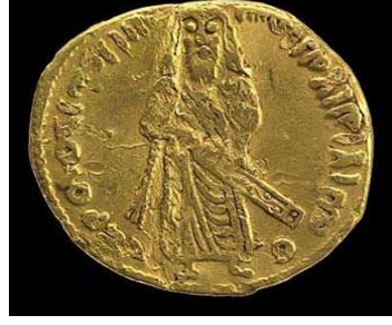
Fotoğraf 5. Halife Abdülmelik bin Mervan'ın sikkesi https://www.metmuseum.org/exhibitions/listings/2012/byzantium-and-islam/blog/characters/posts/abd-al-malik