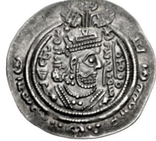
Fotoğraf 7. Halife Abdülmelik bin Mervan'ın sikke. https://www.coinarchives.com/w/results.php?search=umayyad