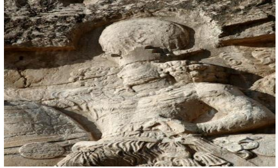
Fotoğraf 11. I. Şapur'a ait kaya kabartması, İran Nakş-ı Rüstem http://www.livius.org/pictures/iran/naqs-e-rustam/naqs-e-rustam-relief-of-shapur-i/naqs-e-rustam-relief-of-shapur-i-shapur/