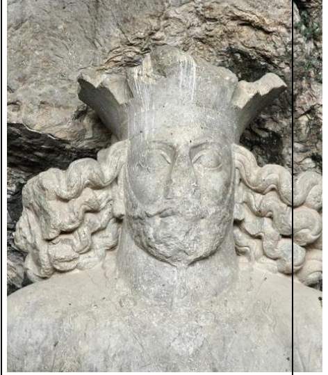
Fotoğraf 13. Sasani kralı I. Şapur, kaya kabartması İran Bişabur