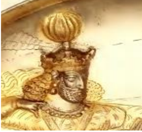
Fotoğraf 8. Sasani Kralı II. Şapur'un tacını gösteren gümüş tabak, Freer Gallery of Art (Gunter 1992: 107)