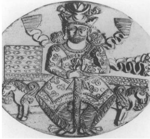
Fotoğraf 10. Sasani kralı I. Hüsrev'e ait madalyon. Paris Bibliotheque Nationale, (Baer 1999: 33, fig. 2)