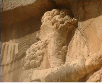
Fotoğraf 14. Sasani kralı Ahuramazda kaya kabartması, İran Bişabur http://www.livius.org/articles/dynasty/sasanians/sasanian-crowns/