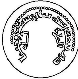
Çizim 1. Sikkenin ön yüzündeki kufi yazıt ve geometrik tasarım.