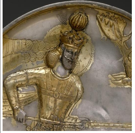
Fotoğraf 9. Sasani Kralı I. Yazdigerd'in tacını gösteren gümüş tabak https://www.metmuseum.org/art/collection/search/326007