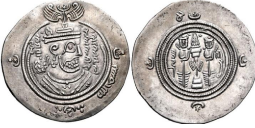
Fotoğraf 4. Emevi halifesi Muaviye'nin sikkesi https://www.coinarchives.com/w/results.php?search=umayyad