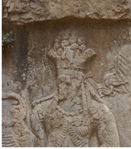
Fotoğraf 12. Sasani kralı Anahita (?)kaya kabartması İran, Nakş-ı Rüstem http://www.livius.org/articles/dynasty/sasanians/sasanian-crowns/