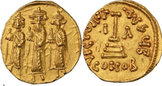
Fotoğraf 6. Halife Abdülmelik bin Mervan'ın Bizans taklidi sikkesi. https://www.coinarchives.com/w/results.php?search=umayyad