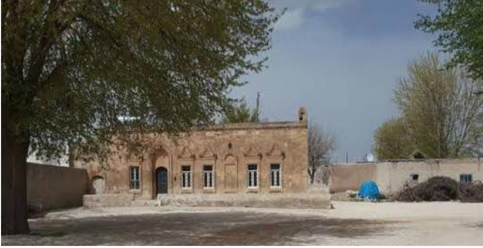
Resim 4: Millisaray Köyü Köy Odası 5

Kökenleri Osmanlı'ya dayanan köy odaları diğer bir ifadeyle köy misafirhaneleri vakıf yoluyla kurulmuştur. Osmanlı köy hayatının bir parçası olan odalar, kökenlerini Ahi geleneğinden almaktadır. İbn Batuta'nın seyahatnamesinde ve başka kaynaklarda görüldüğü üzere ahi kültürünün güçlü olduğu bölgelerde bu odalar bulunmaktadır. Ayrıca yemek ve konaklama hizmetleri sunması, içinde toplantıların yapılması gibi bazı temel özellikleri ahi zaviyelerine olan benzerliğini göstermektedir. Çağatay, Ahiliğe dair yaptığı bir çalışmada köylerdeki birçok ahi zaviyesinin konuk odası olarak kullanıldığını söylemektedir. 6 Tire'deki Ahi Alihan Zaviyesinin Osmanlı'nın son dönemlerine ait bir kayıтта "Ahi Alihan merhûmun binâ ve inşa kirdesi olan ve âyende ve revendenin it'âm-ı ta'âmına mahsus odanın"