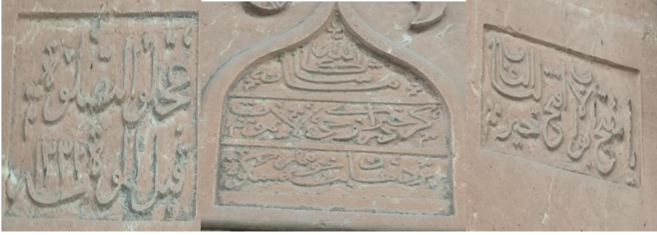
Resim 1: Kitabenin sağ kısmı Resim 2: Kitabenin orta kısmı Resim 3: Kitabenin sol kısmı