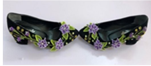
Fotoğraf 14: Mor Renkli Motifli Kısa Topuklu Ayakkabı