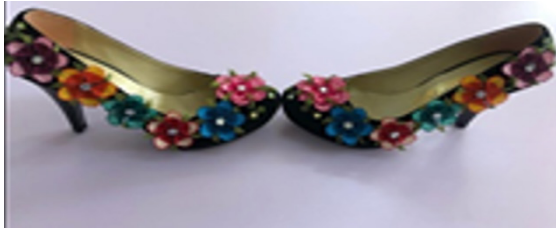
Fotoğraf 13: Renkli Çiçek Motifli Ayakkabı

Toplum merkezli yaklaşım açısından zanaatkar satın alınan ayakkabıyı süslerken kullandığı motifleri doğadan esinlenerek ürettiğini ve renkleri seçerek tasarladığını açıklamıştır.