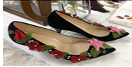
Fotoğraf 6: Pembe Çiçek Motifli İğne Oyalı Ayakkabı