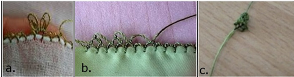
Fotoğraf 2. a. Sinek Kanadı Tekniği b. Sıçan Dişi Tekniği c. Kök Tekniği.

Kök; İplik işaret parmağı üzerine dolanır. Birleşim noktasına zürafa tekniği ile düğüm atılır. Yapılacak çiçek kaç yapraklı olursa o kadar zürafa yapılır. Döne döne etrafına zürafa yapılır (Fotoğraf 2.c).