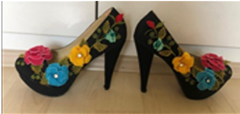
Fotoğraf 7: Renkli Gül Motifli İğne Oyalı Ayakkabı

Toplum merkezli yaklaşım açısından kullandığı motifleri doğadan esinlenerek seçtiğini ve motiflere uygun renkleri belirlediğini açıklamıştır. Kullandığı gül motiflerini aslına benzer şekilde uyguladığını belirtmiştir.