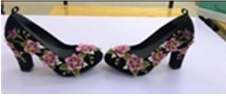
Fotoğraf 9: Mor Renkli Çiçek Motifli Ayakkabı

Toplum merkezli yaklaşım açısından kullandığı motifleri doğadan esinlenerek üretirken iğne oyali çiçek motiflerinde ışık gölge uyumunu düşünerek ton geçişleri yaptığını belirtmiştir.