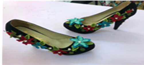
Fotoğraf 8: Kırmızı ve Mavi Çiçeklerden Oluşan İğne Oyalı Motifli Ayakkabı