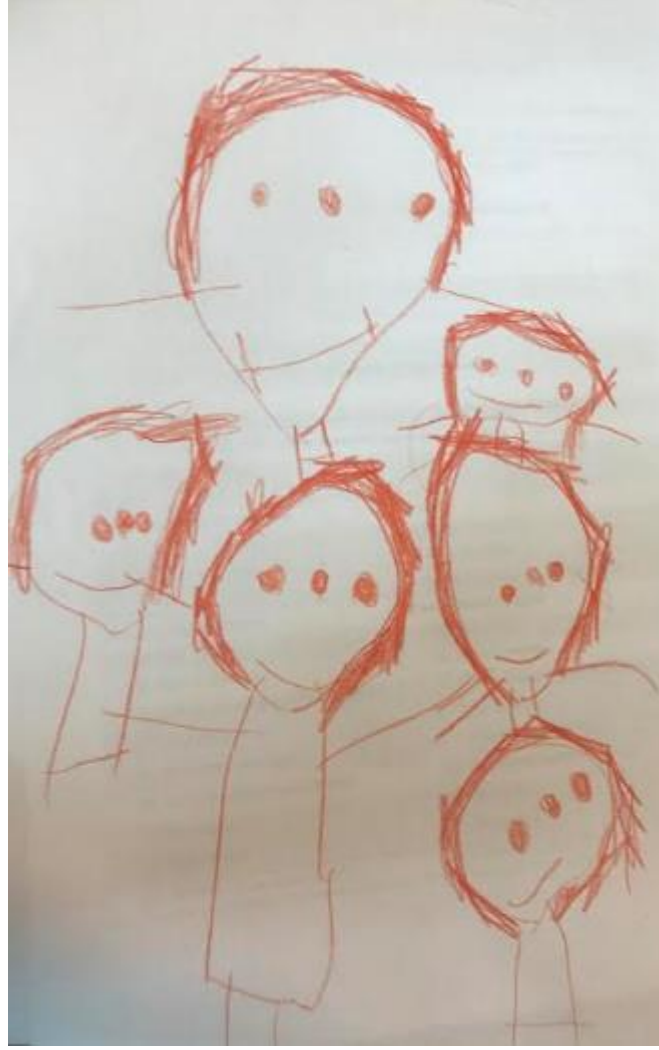
Resim 5. (Kod 298): "Hastanede hemşire ve doktorlar. Hemşireler kız, büyük çizdiğim erkek olan da doktor"