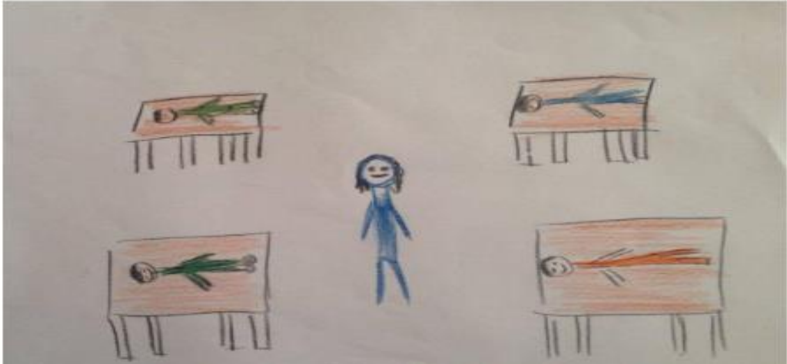
Resim 2. (Kod 229) "Hemşireler bizi her sabah ziyaret ediyor, durumumuzu değerlendiriyor. Hep yanımızdalar bizi yalnız bırakmıyorlar."