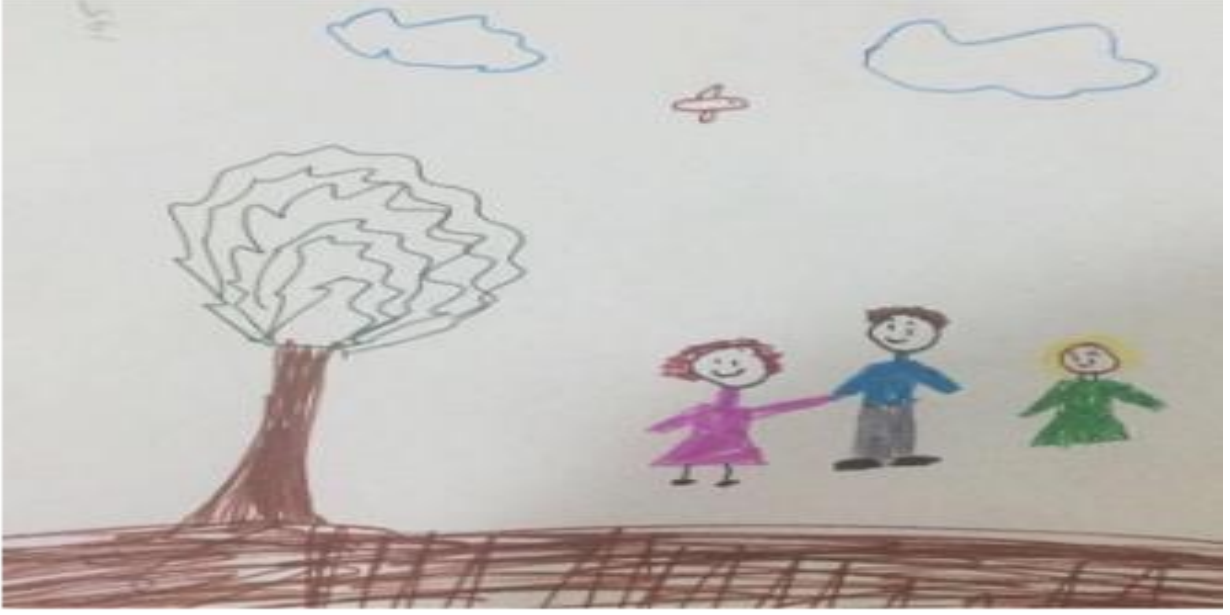
Resim 3. (Kod 195) "Hastaneye babamla gelmek istiyorum, ama serviste babaların kalması yasak. Serviste bizimle ilgilenen sarı saçlı çok sinirli bir hemşire var."