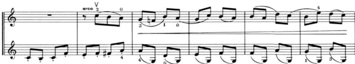
Nota 28. Grotesk Marş, B Bölmesi, Tema II, Ölçü: 33-38.

Tema I'i izleyen 34. Ölçüden itibaren Tema II bu defa 1. Keman partisinde sergilenir (Nota 28.)