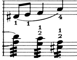
Nota 16. Kujawiak, 1. Keman Partisinde 1. Parmakta kaydırma tekniği, Ölçü: 7.

Kujawiak sol el teknikleri bakımından incelendiğinde ise pozisyon değiştirme (I-V), çift ses çalma, parmak kaydırma (Nota 16.) ve flajole çalma (Nota 17.) tekniklerini içerdiği anlaşılmaktadır.