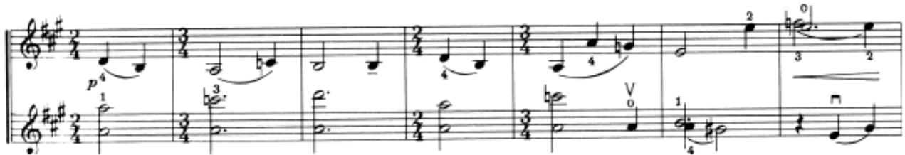
Nota 1. Prelüd, B Bölmesi, Ölçü: 13-19.