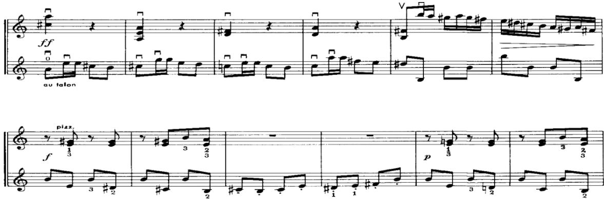
Nota 27. Grotesk Marş, B Bölmesi, Tema I Devamı, Ölçü: 21-32.

B bölümünde 2. kemanda başlayan Tema I, yine 2. keman partisinde 34. ölçüye kadar devam etmektedir. Tema iki partide de birçok değiştirici işaret olmasına rağmen temelde La minör tondadır (Nota 27).