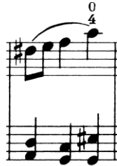
Nota 17. Kujawiak, 1. Keman Partisinde flajole çalma tekniği, Ölçü: 31.