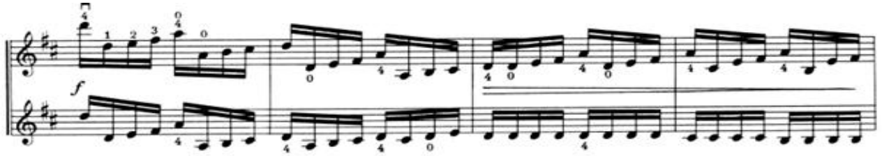
Nota 5. Birinci Krakowiak, Sağ el tekniklerinden detaşe çalma tekniği, Ölçü: 9.-12.

Birinci Krakowiak, sağ el teknikleri bakımından incelendiğinde; detaşe çalma (Nota 5.), bağlı çalma, staccato çalma ve bağlı staccato çalma gibi keman eğimi başlangıcında önemli kabul edilen temel yay tekniklerini içerdiği anlaşılmaktadır. Sol el teknikleri bakımından ise pozisyon değiştirme (I-IV), çift ses çalma, flajole çalma, ayrıca Nota 6.'da gösterildiği üzere süsleme tekniklerinden mordan ve kısa basamak çalma tekniklerini içerdiği dikkat çekmektedir.