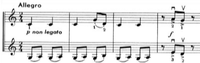
Nota 30. Grotesk Marş, 4. Ölçüde Martele Çalma Tekniği, Ölçü:1-4.

Halk Müziği Temaları Üzerine Düetler kitabının son düeti olan Grotesk Marş birçok farklı sağ ve sol el tekniğini içermektedir ve önceki düetlerde yer alan tüm tekniklerin bir özeti gibidir. Grotesk Marş sağ el teknikleri bakımından detaşe çalma, yayın dibinde/ topuk kısmında (au talon) detaşe çalma, bağlı çalma, staccato çalma, bağlı staccato çalma, akor çalma, pizzicato çalmanın yanı sıra martele çalma (Nota 30.) tekniğini de içermektedir. Özellikle düetin başında yazılı olan ve genelde yaylı çalgılar için kullanılan non legato ibaresi ile düetin genel olarak bağlı olmayan bir karakterde çalınması belirtilmektedir. Non legato yay tekniği detaşe tekniğine çok benzerdir ama yayın durdurularak her nota arasında küçük boşluklarla çalınması beklenmektedir. Detaşe tekniğinden farkı, detaşe tekniğinde notaların tam süre değeri ile çalınmasıdır.