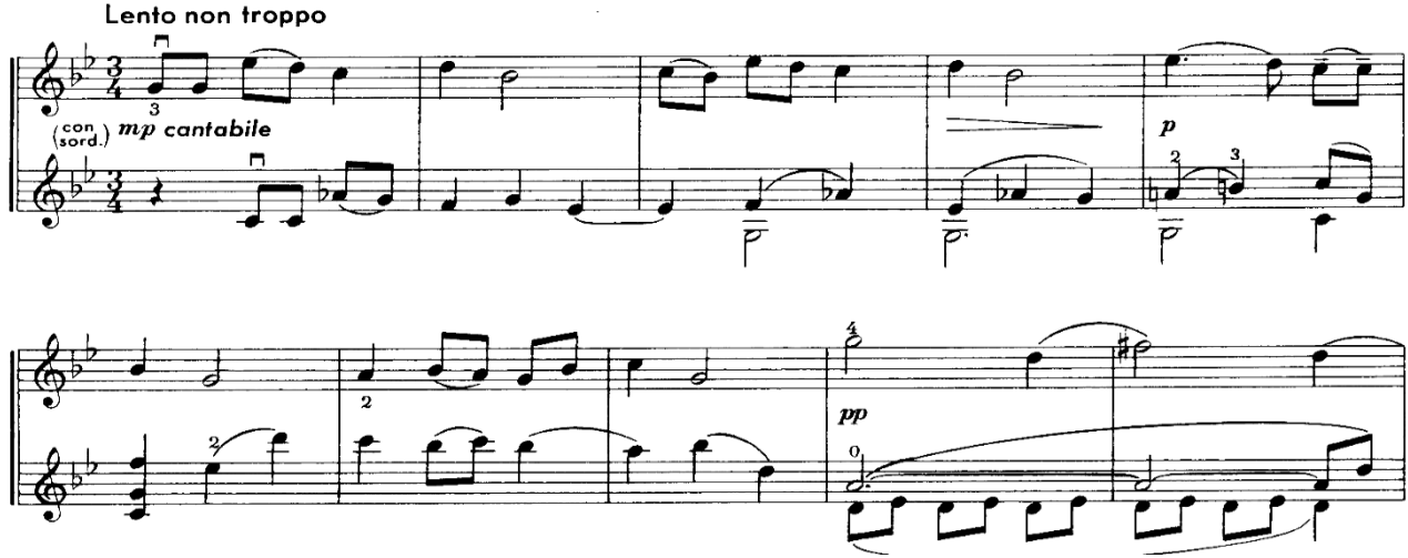
Nota 7. Noktürn, Ana Tema, Ölçü: 1-8.

Kitabın üçüncü düeti olan Noktürn'un genel olarak romantik dönem şarkı formunda bestelenmiş noktürnlerden farklı olarak serbest formda bestelendiği görülmektedir. Ana tema, köprü görevi gören ve melodik yapıda olmayıp tonal arayış içinde olan bir bölüm sonrasında yine ana temaya dönmüştür.