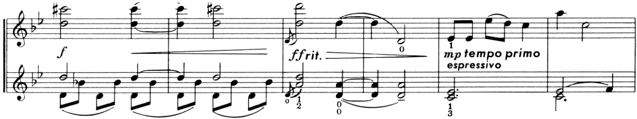
Nota 10. Noktürn, pozisyon değiştirme (I-III), çift ses çalma ve kısa basamak tekniği, Ölçü: 16-21.

Sol el teknikleri bakımından ise pozisyon değiştirme (I-III), çift ses çalma ve kısa basamak çalma (Nota 10.) tekniklerini içerdiği dikkat çekmektedir.