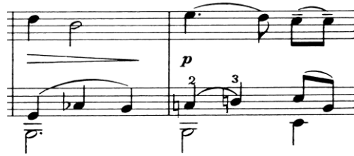
Nota 9. Noktürn, 5. Ölçü 1. Keman Partisinde Portato Tekniği, Ölçü: 4-5.

Noktürn sağ teknikleri açısından incelendiğinde; detaşe çalma, legato çalma ve portato çalma (Nota 9.) tekniklerini içerdiği anlaşılmaktadır.