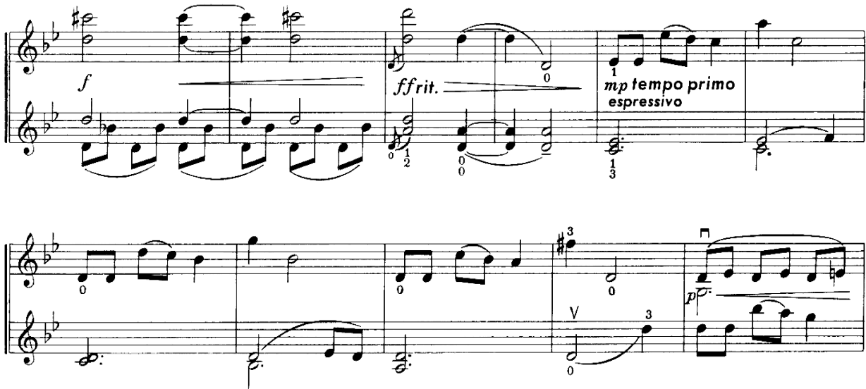
Nota 8. Noktürn, Ana Tema Tekrarı, Ölçü: 16-26.

Düetin tonu Sol minör olmasına rağmen 2. keman partisinde tekrarlayan la bemol ile ana tema Mi bemol Majör tonda sergilenmiştir ve 8 ölçü boyunca devam etmektedir (Nota 7. ve Nota 8.)