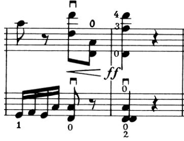
Nota 21. İkinci Krakowiak, Akor çalma tekniği, Ölçü: 46-47.

İkinci Krakowiak sağ el teknikleri bakımından incelendiğinde detaşe çalma, legato çalma, staccato çalma, portato çalma, pizzicato çalma ve öncesinde incelenen düetlerden farklı olarak akor çalma (Nota 21.) tekniklerini içermektedir.