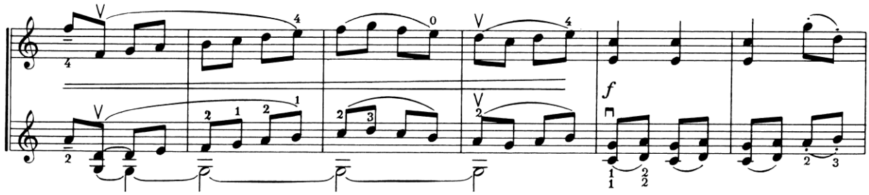
Nota 29. Grotesk Marş, B Bölmesi, Tema II Devamı ve A Bölmesine Dönüş, Ölçü: 39-44.