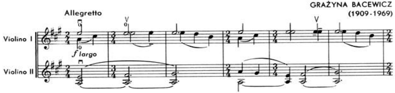
Nota 2. Prelüde, Çift ses çalma ve Legato çalma Tekniği, Ölçü:1-6.

Prelüd'ün sağ el teknikleri bakımından legato çalma ve yayı bölümlleme tekniklerini içerdiği görülmektedir. Sol el teknikleri bakımından incelendiğinde ise; çift ses çalma, pozisyon değiştirme (I-IV) ve parmak kaydırma tekniklerinin kullanıldığı anlaşılmaktadır. Düetin iki partide de büyük ölçüde çift sestem olduğu dikkat çekmektedir. Özellikle 4. parmağın telde basılı bir şekilde sesi tutmasının amaçlandığı unison seslerden oluşan çift sesler de bulunmaktadır.