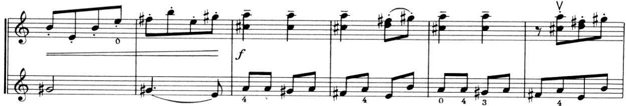
Nota 26. Grotesk Marş, B Bölmesi, Tema I, Ölçü: 15-20.

Düette melodik ve tonal anlamda değişim ve gelişimlerin bulunduğu B bölümü ilgi çekicidir. B bölümünde 2 farklı tema bulunmaktadır. Öncelikle 2. keman partisinde sonrasında ise 1. Keman partisinde sergilenen iki farklı tematik yapı görülmektedir. Aşağıda Nota 26'da 2. keman partisinde 17. ölçüde başlayan Tema I gösterilmiştir.