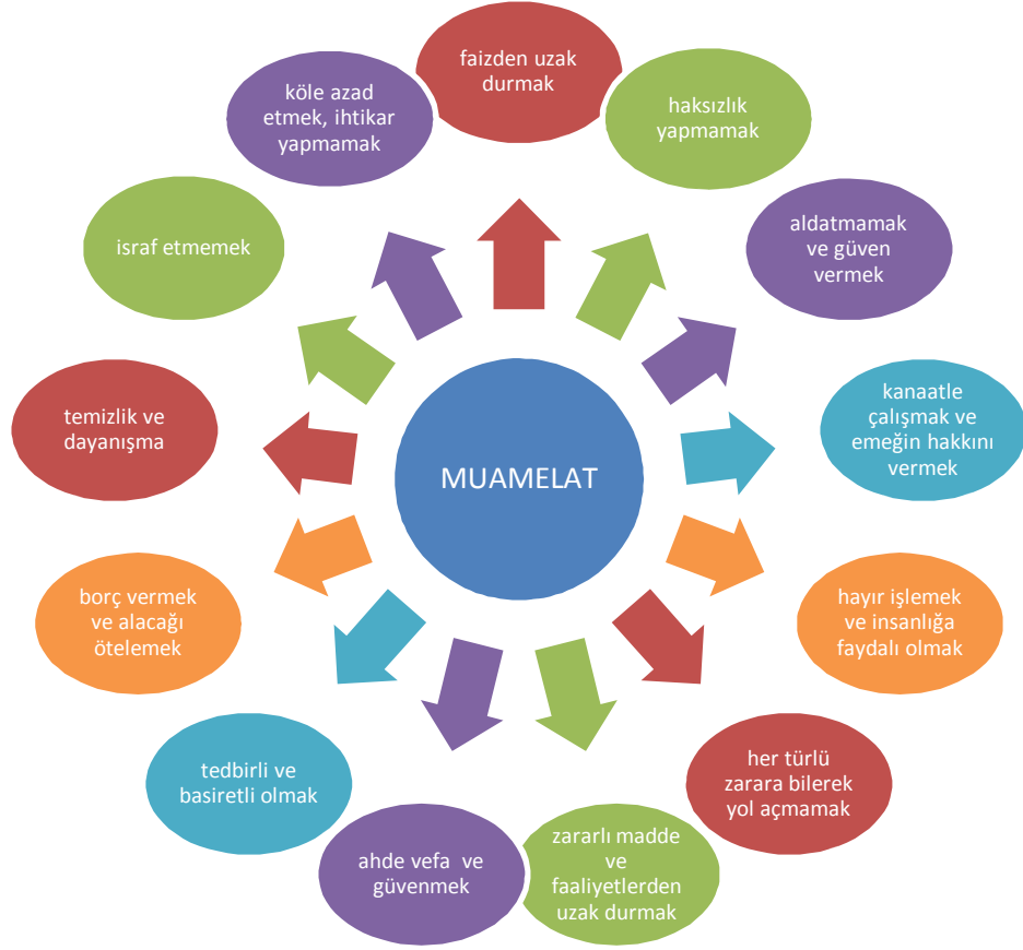
Şekil 2. İslam Hukukunun Muamelat Kısımındaki İlke ve Esaslar

Kaynak: Araştırmacının kendi çalışmasıdır.