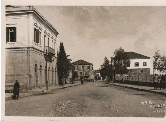
Ek II: Ak kahve (Sağdaki Taş Bina) 1940'lar