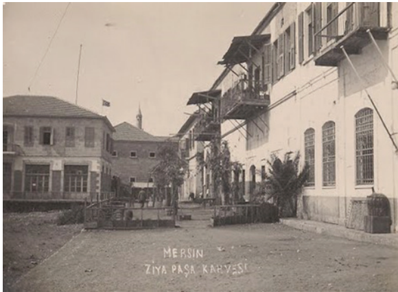
Ek IV: Ziya Paşa Kahvesi