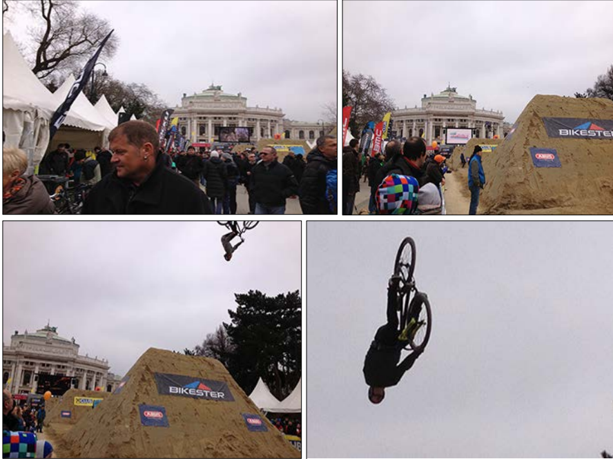
Resim 9. Meydanı tarifleyen yapılardan Tiyatro binası ve etkinlik

Burada, görsellerle örneklenen bisiklet festivali etkinliği, hem cesur mekansal tezadı (ve "ödünç olma" durumunu) hem de Meydan'ın herkesçe erişilebilir olma niteliğini en sarıh şekilde temsil edenlerden biridir. Bu etkinlikle birlikte, modern kentlerde giderek büyüyen çevre-dostu bir bilinçlenmenin önemli simgelerinden sayılabilecek bisiklet kültürü, Meydan'daki geçici mekansal biçimlenme ve pratikler aracılığıyla kentliye ulaşmaktadır. Meydanın ödünç ve akışkan kentsel mekan kimliği, durağan ve ağır neo-klasik mimari biçimlenmesinin önüne geçmekte ve kentlinin erişimine istisnasız açık olduğunun altı çizilmektedir. Bu durum, belediye, parlamento, üniversite ve tiyatro yapılarınca tariflenen otoriter mimari üslubun, toplumda karşılık bulan bir (sportif/çevreci) gerçekliğe dilsel bir çevirisi şeklinde tanımlanabilir. Gündelik dile çeviri olarak da kavramsallaşabilecek bu deneyim başka gerçeklikleri dolayısıyla farklı toplumsal ifadeleri içermektedir (Resim 9).