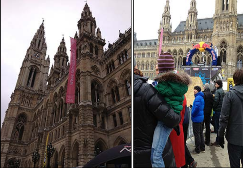
Resim 6 Viyana Belediye Binası ve Belediye Meydanı

bir “ödünç mekan” olarak, kentin farklı kesimlerinin mekansal pratiklerine dahil olup, gündelik yaşamlarına sızmaktadır (Resim 6).