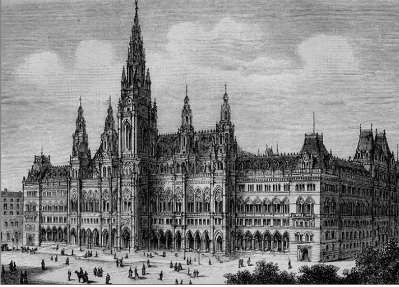
Resim 2. Belediye Binası'nın Ring Caddesi yönünden 1885 tarihli gravürü

Yüzyıl Viyana'sının önde gelen mimarlarından olup, Viyana Güzel Sanatlar Akademisi'nde ders veren Friedrich von Schmidt, çoğu kilise yapıları olmak üzere bu Ortaçağ esintili üslubu yansıtan eserler yaratmış ve 'Viyana Gotikcisi' (Sisa, 2002) olarak ünlenmiştir (Resim 2).