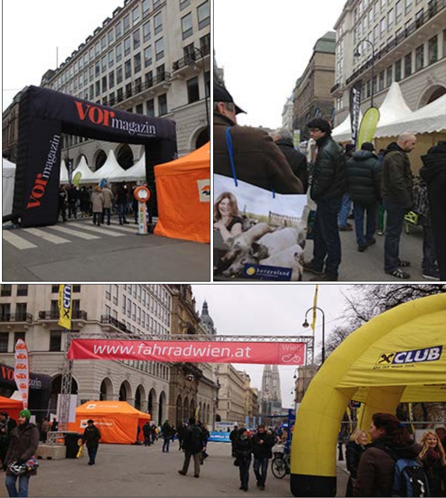
Resim 8 Viyana Belediye Meydanı'na çıkan sokaklar

Gratz'ın, 1600 yılından itibaren kentin farklı bölgelerinde yapılan geleneksel Noel Pazarı (Christkindlemarkt) etkinliğini Belediye Meydanı'na taşıma kararı olarak anılmaktadır ( www.wien.gv.at ).