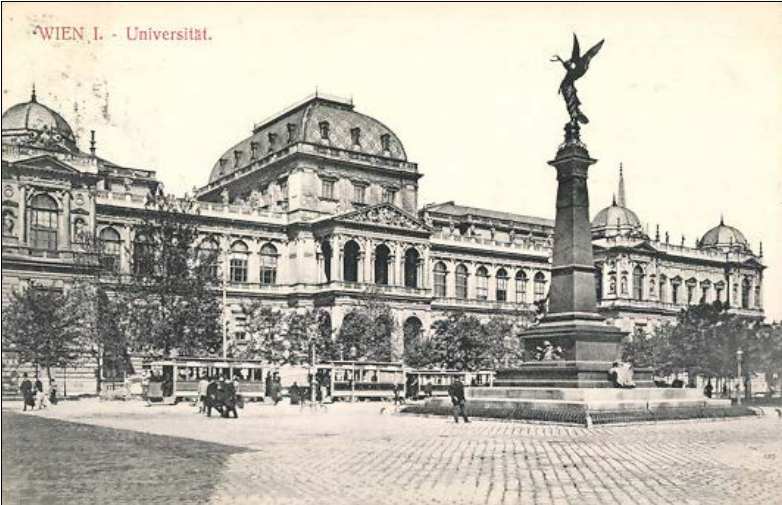
Resim 4 Viyana Üniversitesi Binası