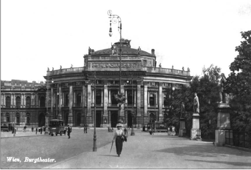
Resim 5 'İnşasından kısa bir süre sonra Tiyatro Binası', https://commons.wikimedia.org/wiki/File:Wiener_Burgtheater_alt.jpg , adresinden 19 Mart 2017 tarihinde erişildi.

Bu yapılardan beslenen kalıcı bir anıtsallığa sırtını yaslayan ve Ring Caddesi ile yapı arasında konumlanan Belediye Meydanı, bugün benimsenen yerel siyasetin getirisi olarak, modern gündelik yaşamın mekânsal temsili gibidir. Bu siyaset bir yandan kentin ekonomisine katkıyı gözetiyor olsa da 4 (Iglar, 2013), denilebilir ki, yerli ve yabancı ziyaretçi akınının hiç kesilmediği bir dünya kenti için bu bir öncelik değildir. Belediye, parlamento ve üniversite yapılarının oluşturduğu ağır mimari dilli kurumsal dokunun içinde, Belediye Meydanı'nın herkesçe erişilebilirlik gündeliklik temsili incelemeye değer bir tezat sunmaktadır. Meydan, kurumsal olanla kentli arasındaki soyut mesafeyi yok etmekte ve kentliyle güçlü bir sosyal bağ kurmaktadır. Bu bağı kurabilmesinin ve kentsel kültürün etkin bir bileşeni olarak sürdürülebilir kılmasının altında yatan, Meydan'ın kendisini kültürel, sanatsal, toplumsal ve sportif aktivitelere sınırsızca açmış olmasıdır. Viyana Belediye Meydanı, durağan bir kentsel nesne olmak yerine,