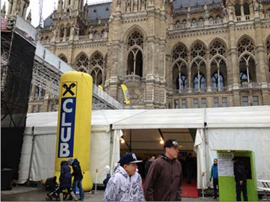
Resim 10 Belediye Binası ve geçici etkinlik mekanları

şüm halindeki toplumsal süreçlere ayak uyduran Viyana Belediye Meydanı, geçici kentsel ilhamlar aracılığıyla kalıcı kentsel bağlar kurmaktadır. Kozu, artık, mekanın, bir nesnel 'öz' olarak, modernitenin çoklu ve çeşitli yönelimlere sahip 'öznelere' sunulamayacağını bilmektir. Modern kentsel kültür içinde, kamusal mekan yansız bir 'ortamdır', bir 'aracıdır' (Lefebvre, 1974/2014, s. 407-408); bir sonuç, içine hapsedildiği tarihsel bir kategori, soyut, siyasal, sosyal bir statü argümanı değildir.