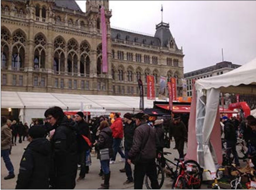
Resim 1. ‘Olasılıklar ortamı’ olarak Viyana Belediye Meydanı

Bu görüşten yola çıkarak denilebilir ki, oturmuş genel bir kural olmasa da, yazının başlığının da işaret ettiği üzere, “ödünç mekan” kavramı yönetsel olarak irdelenmeye değer bir altlık sunmaktadır. Lefebvre (1974/2014, s. 207)’in aktarımıyla toplumsal / kamusal mekan, ‘her zaman ve eş zamanlı olarak’, hem ‘edimsel (verili)’ hem ‘potansiyel (olasılıklar ortamı)’ değil midir? İşte “ödünç mekan” kavramı, kamusal mekanı bir ‘olasılıklar ortamına’ dönüştürme mekanizması olarak, bu yazının amaçladığı çözümlemeyi mümkün kılan bir kuramsal çerçeve tesis etmektedir.