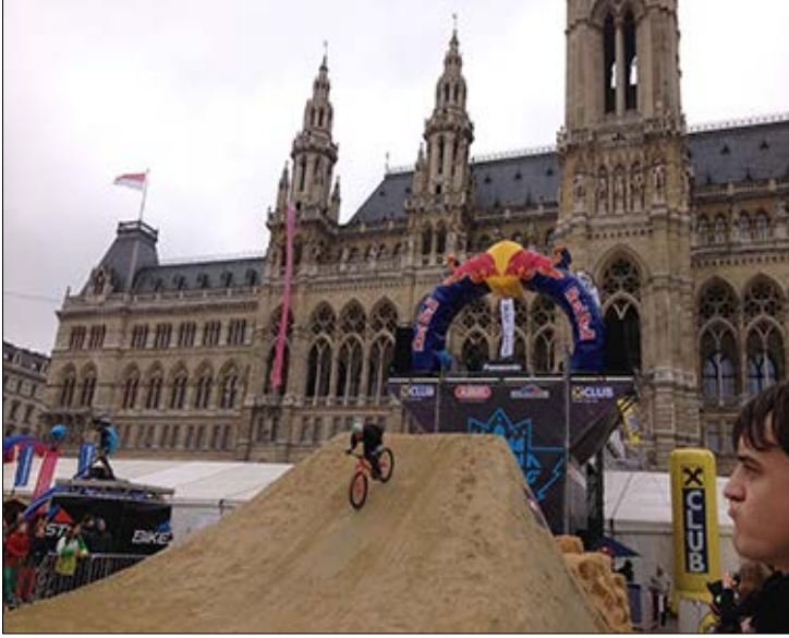
Resim 7 Etkinlik için Meydan'da oluşturulan ortam

Başkent Viyana ilk bakışta bütünlüklü bir ön resim sunmakla birlikte, her göç alan büyük kent gibi heterojen bir toplumsal yapıya sahiptir ( Migration und Integration , 2016). 5 Bir Asi Şehir olarak nitelenemese de yaklaşık yüzde otuzunu yabancı kökenli vatandaşların oluşturduğu 1.840.226 nüfuslu bu kentte ortak, erişilebilir ve sürdürülebilir bir kentsel kültür oluşturmak için sağlam gerekçeler bulunmaktadır. Kamusal açık alanlar bu ortak kültürü tesis etmek, etnik ve sosyal farklılıklara sahip grupları / bireyleri buluşturmak ve adil bir kentsel paylaşım sağlamak için anlamlı zeminlerdir. Kültürel ve sanatsal organizasyonlara olduğu kadar bisiklet festivali gibi sıradışı etkinliklere de sıklıkla evsahipliği yapan Viyana Belediye Meydanı, kentin bu bağlamda öne çıkan kamusal mekanıdır (Resim 7).