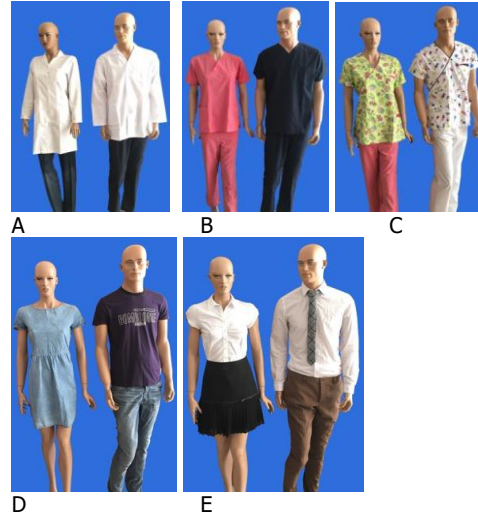
Resim 1a: Beyaz önlük, b: Renkli alt-üst önlük c: Pediatrik önlük, d: Günlük kıyafet e: Resmi kıyafet

Pedodonti Anabilim Dalı'na 2016 Mayıs-Temmuz ayları arasında başvuran 5-12 yaş aralığındaki daha önce dental tecrübesi olan veya olmayan ve anket çalışmasına katılmayı kabul eden tüm çocuklar üzerinde gerçekleştirildi. Çalışmaya 251 kız 211 erkek olmak üzere toplam 462 çocuk katıldı. Çalışmaya başlamadan önce çocuklara ve velilerine çalışma hakkında bilgi verilerek onamları istendi. Velisi ve kendisi çalışmaya katılmayı kabul eden çocuklara beyaz önlüklü (Resim 1a), renkli alt-üst takımlı (Resim 1b), pediatrik önlüklü (Resim 1c), günlük kıyafetli (Resim 1d) ve resmi kıyafetli (Resim 1e) erkek ve kız manken fotoğrafları gösterildi. Çocuklara tüm fotoğraflara baktıktan sonra diş hekimlerinin hangi kıyafeti giymesini tercih ettikleri soruldu. Sonrasında yardımcı ekipman olan bone (Resim 2a-b-c) ve maskelerin (Resim 3a-b) farklı renk ve desenlerdeki örnekleri gösterildi. Öncelikle bunları tercih edip etmedikleri, daha sonra da doktorlarının kullanımı için hangisini tercih ettikleri soruldu. Son olarak hastalara beyaz, mor, pembe ve mavi renklerdeki eldiven fotoğrafları (Resim 4a,b,c,d), sunularak hastanın tercihi kayıt edildi. Kayıt edilen tüm sonuçlar çalışmanın istatistiksel analizinin yapılması için listelendi. Elde edilen veriler SPSS 22 (SPSS Inc, Chicago, IL, ABD) paket programı aracılığı ile analiz edildi. Değişkenler arası değerlendirmeler ki-kare analizi ile gerçekleştirildi.