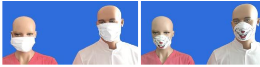
Resim 3a: Beyaz maske, b: Desenli maske