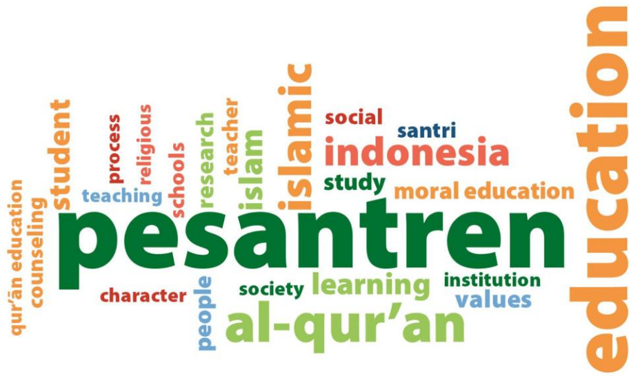
Şekil 1. Kelime Bulutu

Analiz edilen makalelerin çoğunluğu (altı makaleden beşi) İngilizce olduğu için, kelime bulutu ağırlıklı olarak İngilizce terimleri yansıtmaktadır. Ancak, bir makalenin Türkçe olması, bu makaleye ait anahtar terimlerin de analize dahil edilmesini gerektirmiştir. Analizin tutarlılığını ve bütünlüğünü sağlamak amacıyla, Türkçe kelimeler İngilizce karşılıklarına çevrilmiştir. Bu yaklaşım, kelime bulutunun tüm makalelerdeki genel tematik örüntüleri doğru bir şekilde yansıtmayı sağlayarak, dil engelleri olmaksızın bütüncül ve karşılaştırmalı bir tartışma yürütülmesine olanak tanımaktadır. Örneğin, “öğrenci” kelimesi “ student ”, “İslami” kelimesi “ Islamic ”, “eğitim” kelimesi ise “ education ” vb. olarak çevrilmiştir.