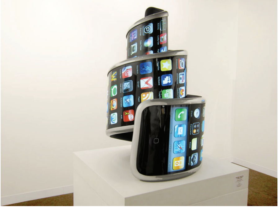
Resim 3. Aristarkh Chernyshev & Alexei Shulgin, “3G International”, LED, fiberglass, duratrans, plastik, elektronikler, XL Galeri, Moskova, 2010.

Aristarkh Chernyshev ve Alexei Shulgin “3G International” adlı çalışması, günümüz kitle iletişim araçlarından cep telefonunu farklı boyutta ele alan bir düzenlemedir. Bu çalışma, hem yeni medya sanatını hem de enstalasyon sanatını içinde barındıran bir örnektir.