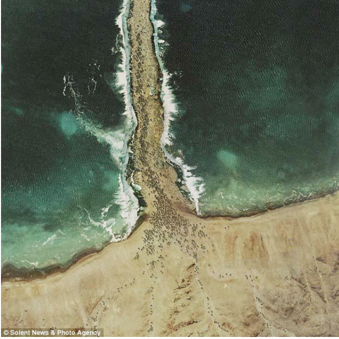
Resim 4. James Dive, “Dalga Yaratma”, Pulse Contemporary Art Fair, Mia-mi, 2007.

James Dive’in çalışması, Yeni Medya Sanatı’nda tarihsel bir olgunun görselleştirmesine (burada niyet tarihsel olguyu görselleştirmek değil, göstergeyi araçsallaştırarak tekniğe ilişkin bir sorun yaratmaktır) dair bir örnektir. Dive yapıtını, Google Earth tarayıcısı ile İncil’de gerçekleşen olayların yerlerini bularak, manipüle ederek gerçekleştirmiştir. Bu çalışma, peygamber Musa’nın denizi ortadan ikiye yararak insanları kurtardığı mucizeyi görselleştirir; fakat burada bu görseli ilginç kılan, görsel üzerinde uygulanmış çeşitli manipülasyon teknikleri değil, tekniğin -bu bağlamda Google Earth ve foto manipülasyon yöntemleriyle- onu kullanan sanatçıyı bir nevi Tanrı’ya dönüştürmesidir. Çalışmada ironik olarak deniz, sanatçısı tarafından dijital ortamda yarılmış olarak gösterilmiştir. Bu görüntü, Google Earth ve Photoshop programlarıyla oluşturulmuştur. Neden bu şekilde oluşturulmuştur? Çünkü yeni medya sanatının açığa çıkarması gereken bir şey vardır. James Dive’in açığa çıkarmaya çalıştığı şey; Musa’ya veya İsa’ya dair değil, bu sahneleri görselleştirirken kendisine tanrı rolünü atfeden tekniğe dair bir hakikattir (“Yeni medya sanatı”, t.y.).