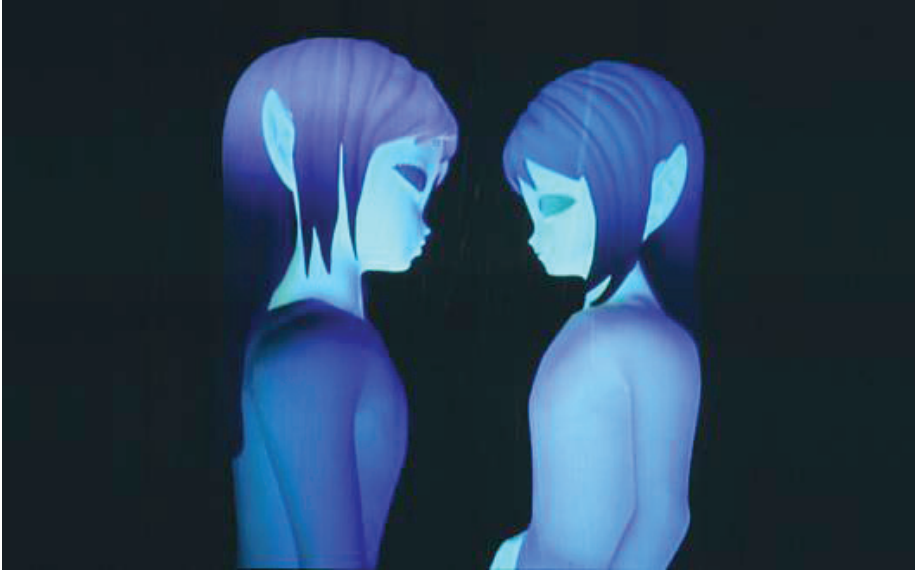
Resim 2. Dominique Gonzales, “Ann Lee Güvenlik Bölgesi’nde”, DVD, 3’33”, Kuzey Miami, Çağdaş sanat müzesi ve Tate Galeri için Amerikan fonu ile borç verildi. Carlos ve Rosa de la Cruz nezaketiyle uzun dönem borç verildi. 2000.