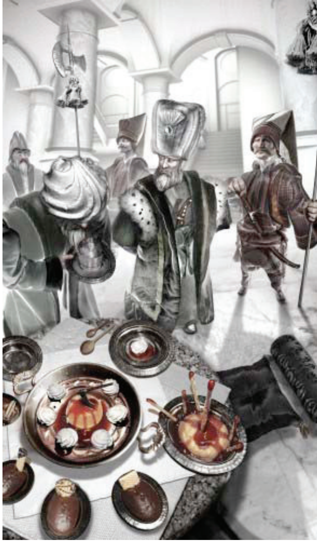
Resim 5. Ansen Atilla , “Öğle yemeğinde tuzlama”, 186 x 110 cm, C-Print, 2011.

Bazen Yeni Medya çalışmalarında; teknik ve malzeme, içerik ve bağlamdan ayrıştırılmıştır. Bu bağlamda, örneğin Ansen Atilla'nın dijital ortamda oluşturduğu tekniği, ele aldığı tarihsel olguyu, insan ve güç ilişkisini vs. gibi kavramları görselleştirmek gayesiyle araçsallaştırılmıştır. Burada bu kavramları görselleştirmek amacıyla bir medya kullanılmıştır. Buradaki tehlike, bu göstergelerin kendi bağlamından kopuk olması ve yapılan manipülasyon tekniğinin bir efekt yaratabilme ihtimalinin olmasıdır.