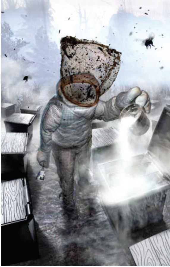
Resim 6. Ansen Atilla , “Göçebe”, 180 x 116 cm, C-Print, 2011.

Ansen Atilla'nın çalışmaları genel olarak, insan ve güç kavramlarına odaklanmaktadır. Ayrıca, mekân ve zaman farklılıklarına rağmen sabit kalan, yasak, suç, yargı ve savaş kavramlarını görünür ya da görünmez niyetler çerçevesinde incelemektedir. Çalışmalarda çeşitli tarihsel olaylar ve güç ilişkilerine dayalı sahneler, dijital medya programlarında bulunan filtrelerden geçerek bir görselleştirmeye tabi tutulmuştur. Bu türden görselleştirmelerin, Photoshop ya da Painter gibi imaj manipülasyon programlarının ustaca kullanımını gerektirmektedir. Dijital medyanın araçsallaştırılarak görselleştirilmesi, bu imgeleri yeni medya sanatı yapmaya yetmemektedir. Daha açıkça belirtmek gerekirse, yeni medya sanatı tarihsel olgular veya güç ilişkileriyle değil, “gizini açmanın bir yöntemi” olan teknikle uğraşmaktadır (“Yeni medya sanatı”, t.y.).