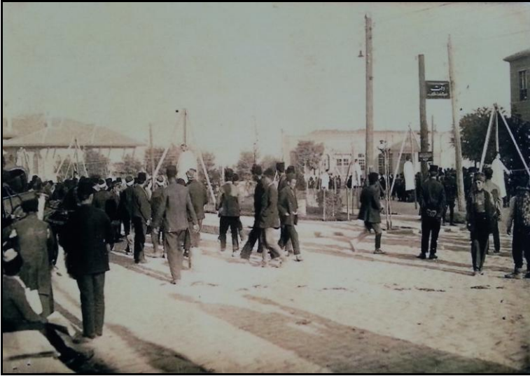
İstiklâl Mahkemesi kararlarının Hâkimiyet-i Milliye (Ulus) Meydanı'nda infazı (1921)

Demiryolu ile şehrin doğrudan bağlantısını sağlayan İstasyon Caddesi'nin Karaoğlan Çarşısı Caddesi (Anafartalar Caddesi) ile kesiştiği nokta olan Taşhan Meydanı'nın (Ulus Meydanı) gelişimi, Cumhuriyet ilanı sonrasında büyük hız kazanmıştır. Daha önce, kışın çamurdan, yazın da tozdan geçilmeyen meydana 1924 yılında Arnavut kaldırımını döşenmiştir. 6 Meydanın adı önceleri "Hâkimiyet-i Milliye" daha sonra da "Ulus Meydanı" olarak değiştirilmiştir.