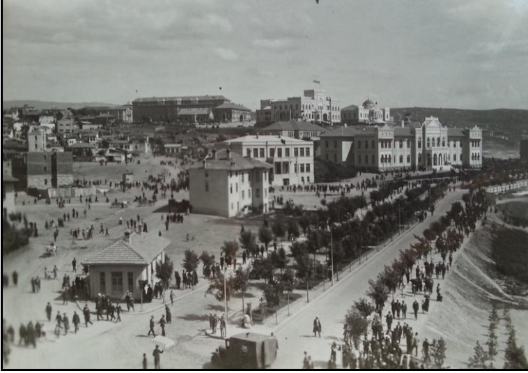
Bir bayram günü Ulus'a giden vatandaşlar (1933)

“Türk Ocağı” (Halkevi) binası 7 yapılmış, yanına “Etnografya Müzesi”, bunların arka kısmına ise “Numune Hastanesi” inşa edilmiştir (Koşay, 1963: 6). Daha sonra, İtfaiye Meydanı ile Talat Paşa Bulvarı arasında bulunan bataklık kurutularak “Gençlik Parkı” olarak düzenlenmiş (Ankara İmar Planı, 1937), parkın yanına Sergi Sarayı (Opera) binası inşa edilmiştir.