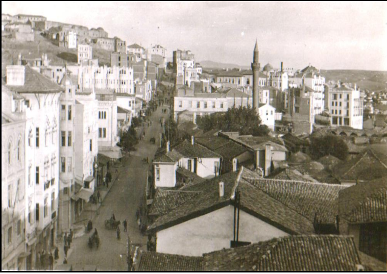
1929 Yangını öncesinde Anafartalar Caddesi ve Tahtakale (1928)

Kadastral haritalarda, ticari kullanımların Ulus Meydanı, Karaoğlan Çarşısı, Balıkpazarı, Tahtakale Çarşısı ve Sulu Han'a kadar ana cadde kenarları ve sokak aralarında yoğunlaştığı görülmektedir.