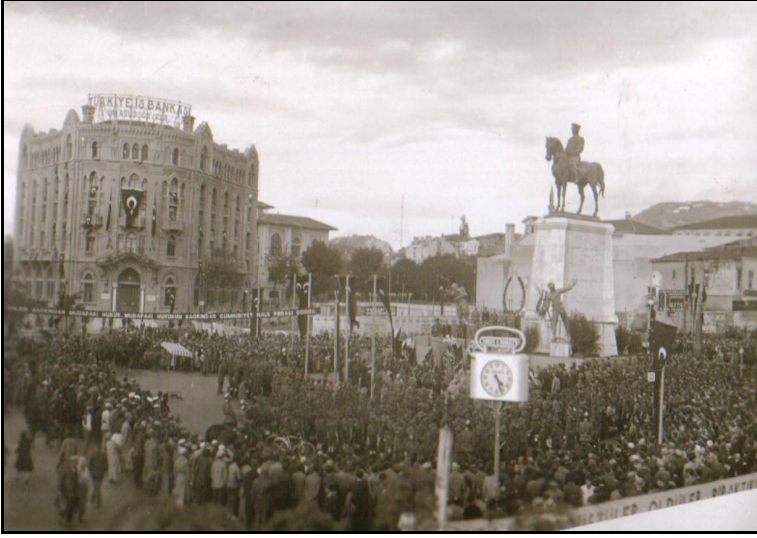
Bir bayram günü Ulus (1936)