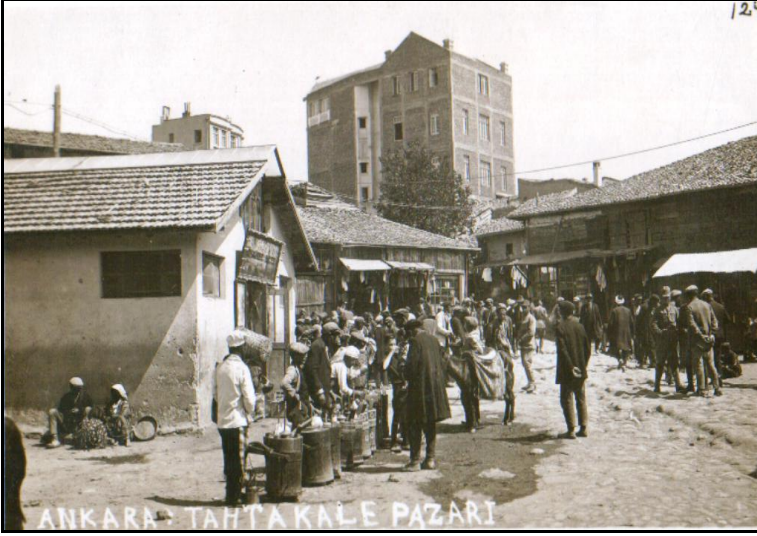
Tahtakale Pazarı (1929)

Ankara'nın Başkent oluşundan ve anılan kentleşme eylemlerinden en çok etkilenen çevre, Taşhan Meydanı çevresi ve Karaoğlan Çarşısı olmuştur. Buna karşın, diğer geleneksel çarşılar ve Tahtakale Çarşısı, kendini çevreleyen ana cadde kenarları hariç eski dokusu ve kullanımını sürdürmektedir.