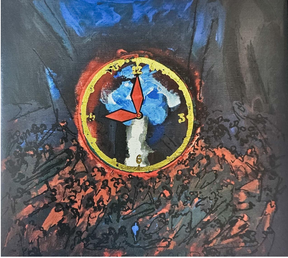
Hasan Pekmezci, Yaşam- Zaman, 2010, tuval üzerine karışık teknik, 110x120 cm.

1968 yılından bu yana başta Devlet Sergileri olmak üzere ülkemizde düzenlenen belli başlı tüm yarışmalara katılan sanatçı, öncekiyle sonraki arasında bir köprü olarak gördüğü otuza yakın kişisel sergi açmış, yirmiden fazla ödül kazanmıştır. Yapıtları pek çok kitap, katalog ve yayında yer almıştır. Dışişleri ve Kültür Bakanlıklarının düzenlediği yurt dışı sergilerde eserleri sergilenmiştir (Yüksel, 2002, s. 107). Yaşam-Zaman kavramlarını metaforik bir veri olarak kullanan sanatçı, evrenin maddeci doğasına karşılık hayalinde kurduğu imgeleri resimlerinin merkezine yerleştirmiştir. Zaman kavramını saatlerle ifade ederken, yaşam kavramını göğe doğru uzanan merdiven imgesiyle anlatmıştır. Sık basamaklardan oluşan uzun merdiven, yerle göğü birleştiren bir yolu andırmaktadır. Maddi dünyadan manevi dünyaya doğru geçişi temsil eden bu imgelerin altına yerleştirilen metaforik kavramlar, izleyicide çeşitli yorumlara neden olmaktadır. Bu merdivenlerin yarattığı etki, aynı zamanda boyutlar arası geçişin çözüm dinamiklerini yansıtmaktadır.