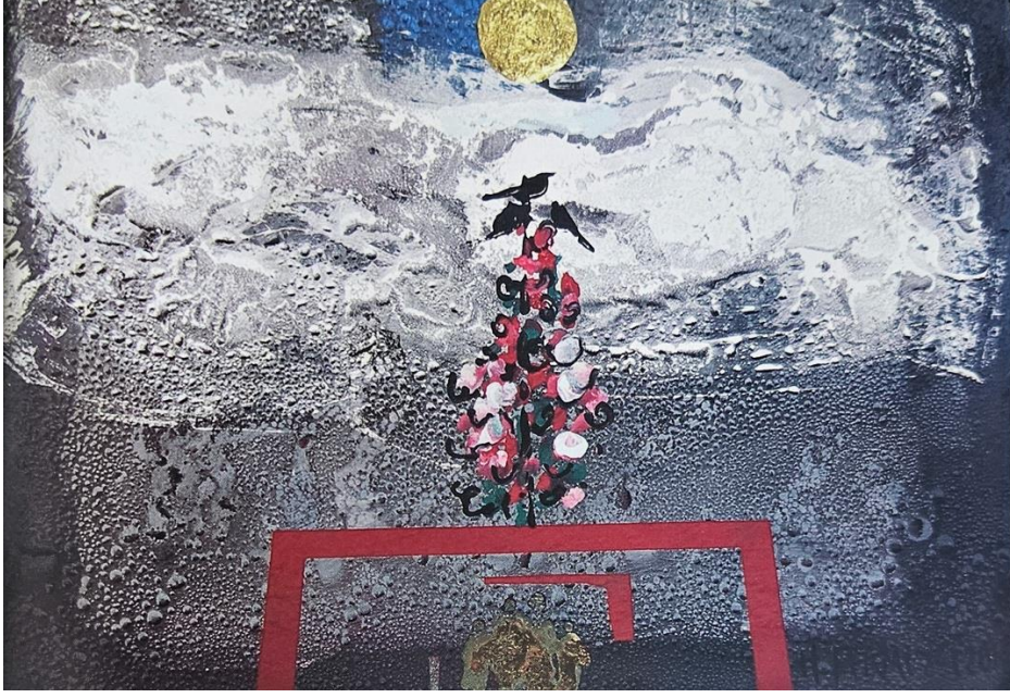
Hasan Pekmezci, Doğa ve Yaşam Üzerine, 2010, duralit üzerine karışık teknik, 35x50 cm.