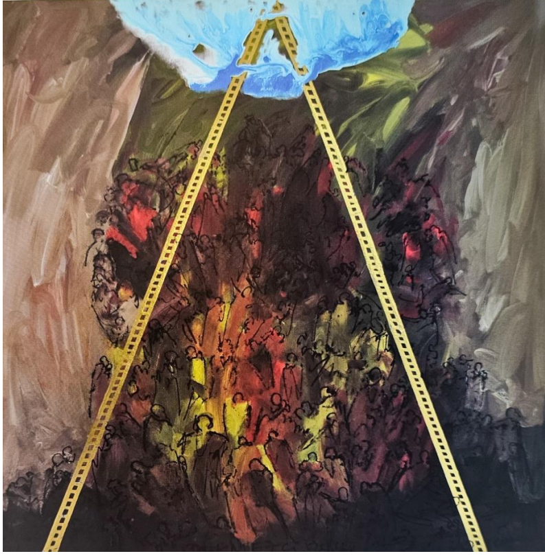
Hasan Pekmezci, Zaman-Yaşam Merdiveni, 2010, tuval üzerine karışık teknik, 150x150 cm.

Hasan Pekmezci, Anadolu coğrafyasının iç bölgesinde Konya'nın küçük bir kasabasında 1945 yılında dünyaya gelmiştir. İvriz İlköğretmen Okulu'ndaki eğitiminden sonra İstanbul Çapa Öğretmen Okulu Resim Semineri'ne devam etmiştir. 1968'de Gazi Eğitim Enstitüsü Resim-İş Bölümü'nü bitirmiştir. Bir süre ortaöğretim kurumlarında resim öğretmenliği yapmıştır. 1978'de Gazi Eğitim Enstitüsü Resim-İş Bölümü'ne öğretmen olarak atanmıştır. Bu bölümde serigrafi atölyesini kurmuştur. 1985 yılında sanatta yeterlik, 1987'de doçentlik, 1987'den itibaren öğretim üyesi olarak görev yapmıştır (Özsezgin, 2010, s. 425). Baskı resimle tanışması onun resim dünyası için ayrıcalıklı bir yere sahiptir. Belki de kendini ifade etmede, çizimlerini çoğaltmada ve yaygınlaştırılmasında bu resim tekniği itici kuvvet olmuştur. Baskı tekniğini kullanırken özgün resim dilinden ödün vermeden çalışan sanatçı, zaman kavramını, saatlerle anlatırken aynı zamanda tükenmekte ve yitip gitmekte olan yaşamsal döngüye vurgu yapmaktadır. Zaman akıp giderken, insanoğlunun kaçırdığı yaşamsal hazın, sonlu durumuna işaret etmektedir. Sanatçıların uzun kelimelerle ifade edilebilecek hikayeleri, resimsel lekelerle ifade etmesi, onların imgesel yeteneğinin göstergesini oluşturması açısından önemlidir. Bu anlamda Pekmezci, imgesel dili çok iyi ifade eden sanatçılardan biri olmuştur.