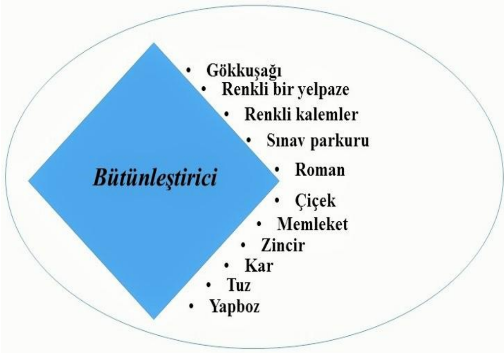
Şekil 5. Bütünleştirici Kategori

Psikolojik danışman adaylarının özel eğitim dersini önleyici olarak görmelerinde kendilerinde oluşan bilgi birikimiyle yapabileceklerini fark etmelerinin, danışmanlarını yönlendirebilecekleri yetiye ulaşmalarının ve özel eğitimin adaylara yeterlilik kazandırmasının etkisi olduğu söylenebilir. Psikolojik danışman adaylarının belirttikleri metaforlar doğrultusunda oluşturulan son kategori “bütünleştirici” kategorisidir (Şekil 5).