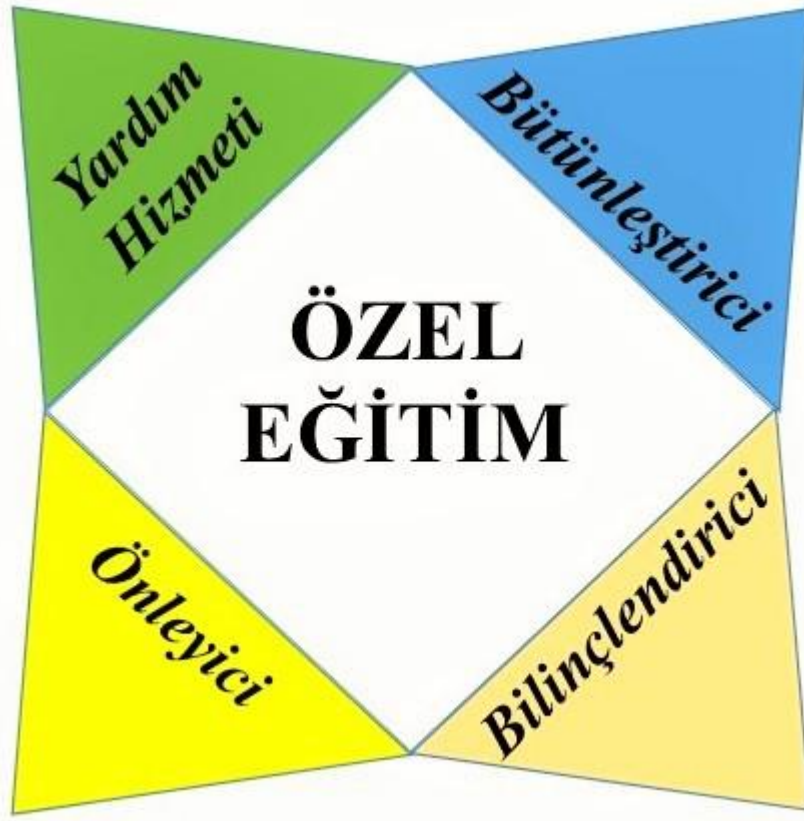
Şekil 1. Özel Eğitim Metaforlarına İlişkin Belirlenen Kategoriler

Şekil 2’de öğretmen adayları tarafından üretilen metaforlar doğrultusunda oluşturulan “Yardım hizmeti olarak özel eğitim” kategorisine ait metaforlar yer almaktadır.