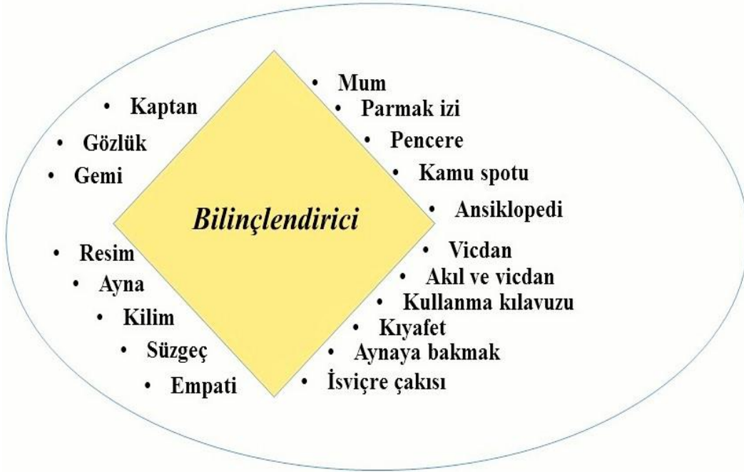
Şekil 3. Bilinçlendirici Kategorisi

Psikolojik danışman adaylarının özel eğitim dersini yardım hizmeti olarak görmelerine, derslerde gördükleri konularda özel eğitime ihtiyaç duyan bireylerin doğru kişilerden doğru eğitimleri aldıkları zaman bireylerde yer alan yetersizliklerin giderildiğini, yeterliliklerinin de arttığını göz önünde bulundurmalarının etkili olduğu söylenebilir. Psikolojik danışman adaylarının belirttikleri metaforlara ilişkin oluşturulan “bilinçlendirici” kategorisi Şekil 3’te gösterilmiştir.